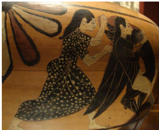
Figura 14. Sátiro y dos ninfas. Hidria. Viena.

En el reverso el artista pintó dos escenas de encuentros sexuales entre silenos y ninfas. En el sector izquierdo, el sileno abraza amorosamente a su compañera y ella responde con sus caricias contemplándolo embelesada. Es evidente que se trata de una relación consensuada, amorosa; basta observar las manos femeninas sobre la pelambre y el brazo de su compañero. La falda levantada enfatiza la blancura de sus piernas que contrastan con el cuerpo negro del sátiro.