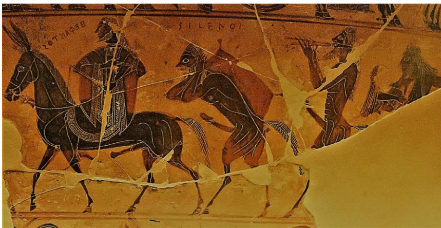
Figura 4. Vaso François. Hefesto y silenos.

patas y colas de caballo (Figura 4). 5 Conformen un grupo transgresor, sinónimo de inversión de las conductas adecuadas a los seres humanos. Sus cabellos excesivamente largos y con mechones enhiestos, erizados sobre la frente son otra indicación más de su animalidad.