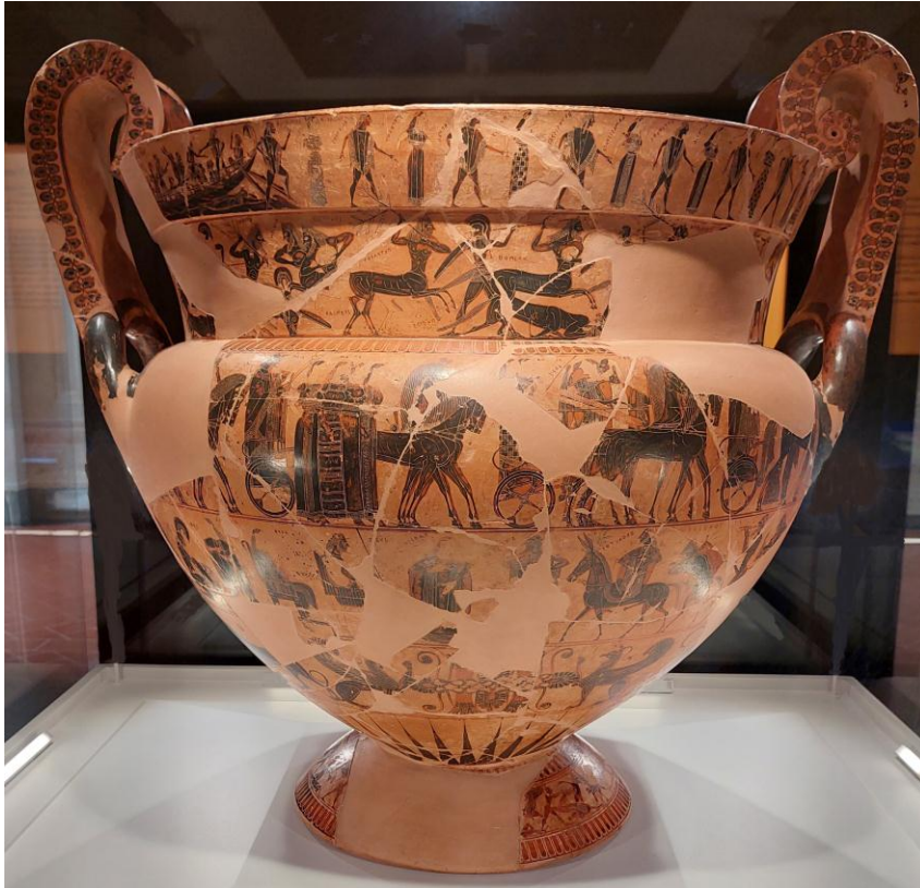
Figura 1. Vaso François.

La cratera, recipiente de gran tamaño y boca ancha, tenía una función primordial en los banquetes: permitía mezclar el vino con el agua. Los placeres del vino, que implican la comunión con su divinidad protectora, debían moderarse a través de la racionalidad. El vino puro conduce a excesos, el placer sin medida es propio de la locura de la ménade o del desenfreno del sátiro. Precisamente, las escenas pintadas reproducen a menudo conductas exaltadas, intimidades de los cuerpos, danzas frenéticas que se asocian con los rituales dionisiacos.