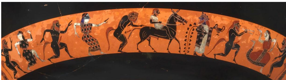
Figura 9. Retorno de Hefesto. Pintor de Oakeshott . Copa.

En aproximadamente los mismos años fue pintada la siguiente copa con el retorno de Hefesto, el thíasos y las nupcias de Dioniso y Ariadna (Figuras 9 y 10). En ambos lados se enfatiza el motivo central flanqueado por una rítmica alternancia de sátiros y ninfas.