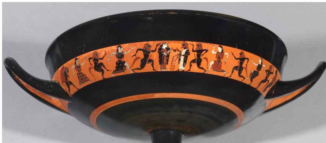
Figura 10. Thíasos con Dioniso y Ariadna. Pintor de Oakeshott . Copa.

Los silenos bailan y exhiben sus falos erectos que el artista ha resaltado con color rojo, al igual que sus colas animalescas, sus cabellos y sus barbas. Uno toca el aulós , otro se encorva bajo el peso del odre con el vino. Las ninfas lucen túnicas coloridas y variadas mientras agitan brazos y piernas frenéticamente. Dioniso y Ariadna