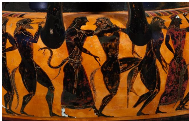
Figura 7. Detalle bajo el asa. Lydos. Crátera.

criatura. Las jóvenes pintadas lucen ajenas a la locura que el nombre de ménade sugiere y tan solo exteriorizan una alegre animación producto del alcohol, la música y el baile. El entusiasmo báquico propuesto por Lydos es el de la fiesta y la alegría y no el de una salvaje demencia.