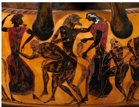
Figura 8. Detalle bajo la otra asa. Lydos. Crátera.

Hay otra serpiente más en este vaso y se encuentra rodeando la cintura de una muy atrevida ninfa, pues es ella quien inicia el juego erótico con un sileno que la observa con cierto asombro (Figura 7). La ubicación de la escena es significativa, está directamente bajo el asa, sitio recóndito, de difícil acceso para el espectador; quizás es la razón para que el artista ubicara las escenas más impúdicas en estos lugares.