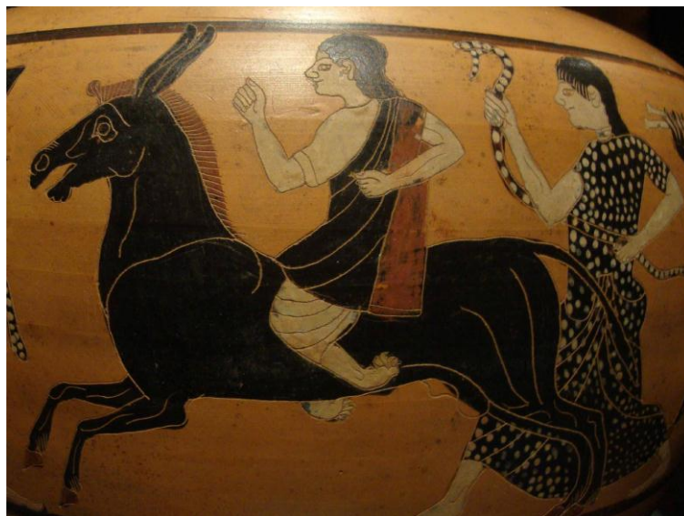
Figura 12. Retorno de Hefesto. Detalle de Hefesto. Hidria. Viena.

sátiro y de la mula contrasta con las carnaciones blancas de los otros personajes. El dios del vino, único inmóvil en la animada composición, viste túnica blanca, manto rojo y un motivo de lunares blanco sobre negro en la nébrida. El diseño moteado se repite en la túnica de la muchacha y en la serpiente.