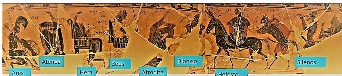
Figura 2. Vaso François. Detalle del Retorno de Hefesto.

vuelva y libere a su madre. Ninguno, ni siquiera el violento Ares, consigue doblegarlo. Al final, Dioniso se vale del poder del vino, lo emborracha y ambos dioses regresan al Olimpo junto con un bullicioso séquito de sátiros y ménades. 4 El hijo de Sémele obtiene de este modo un lugar entre los olímpicos y el herrero divino, la mano de la bella Afrodita.