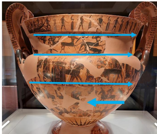
Figura 3. Vaso François. Dirección de las procesiones.

En consonancia con la noción de bestialidad, la deidad defectuosa monta un animal poco prestigioso. Isler-Kerényi (2007: 83) afirma que la mula puede considerarse la variante plebeya del caballo; además, su exacerbada sexualidad indica su conexión con los libidinosos sátiros. La mula avanza y sus patas adoptan el mismo ritmo que el sileno que la sigue, la cabeza dirigida hacia Dioniso, las orejas erguidas. La representación del animal resulta graciosa, aunque su porte contrasta con la lenta marcha de los elegantísimos caballos que guían los carros de las divinidades en el sector principal ubicado justo en la banda superior. Como un indicio más de la alteridad implícita en el bullanguero desfile, la dirección hacia la cual se dirigen Hefesto y sus acompañantes dionisiacos se contraponen a todas las otras procesiones representadas en el vaso (Figura 3).