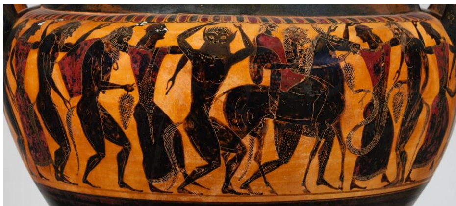
Figura 6. Thíasos con Hefesto. Lydos. Crátera.

La monumentalidad de las figuras se corresponde con la escala del vaso. La alegre procesión, formada por veintiocho personajes, ocupa un friso corrido que rodea la panza de la crátera (Figuras 5 y 6). Hefesto, montado en una mula, está en una de las caras del vaso. En la otra, aparece Dioniso de pie, con el cuerno para beber en su mano. Las deidades están casi perdidas entre las danzarinas criaturas que resultan muy similares a las que Clitias denominó silenos y ninfas. Casi todos se mueven hacia la derecha, los cuerpos se curvan, los brazos suben y bajan, las piernas se flexionan y la escena se carga de entusiasmo, de energía y de ritmos acompasados. Ramas de vid y hojas de hiedra –símbolos del vino y del constante crecimiento de la vegetación– además del único intérprete de aulós , se destacan en el lado correspondiente a Dioniso.