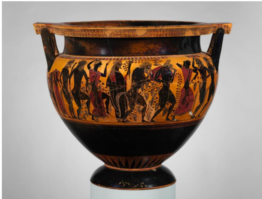
Figura 5. Thíasos con Dioniso. Lydos. Crátera.

Otro artista ateniense, Lydos, 8 agrega el componente festivo del thíasos y algunos de los atributos que irán definiendo el aspecto de las ménades en futuras representaciones. La crátera de Nueva York, realizada hacia el 550, es la obra maestra del pintor. Se trata de un recipiente de gran tamaño, con más de medio metro de altura y con una capacidad de setenta y dos litros.