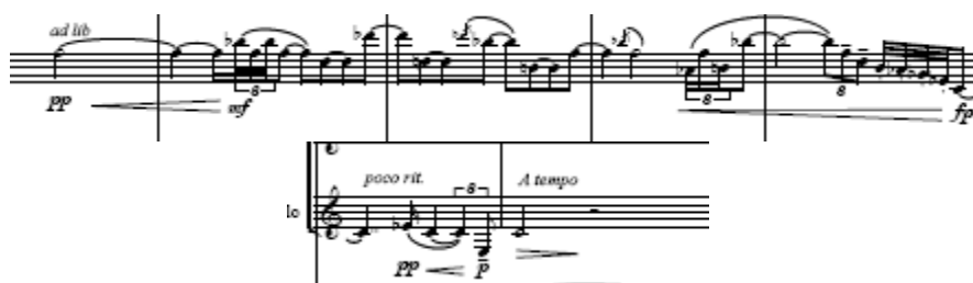
Figura. Idea 2 en Clarinete