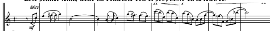
Figura. Tema II

Este primer tema, tiene un contraste con el propuesto en la letra H.