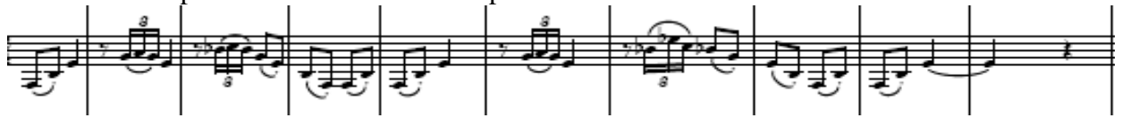
Figura. Idea II, clarinete

acentuaciones expuestas por el clarinete son apoyadas por la orquesta logrando hemiolas bastante características e interesantes. La segunda idea característica de este movimiento la podemos encontrar en compás 15.