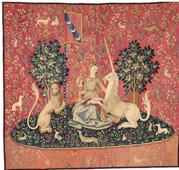
Uno de los tapices de La dama y el unicornio (Flandes, ca. 1500), actualmente en el Museo de Cluny.

El tejido también forma parte de la relación entre Le Guin y Bellessi. Entre los regalos que le hace la escritora estadounidense a Bellessi, llama la atención un bordado hecho a mano por la propia Le Guin. En él, vemos en primer plano a un puma dorado rodeado de flores y mariposas (menos quizás de las que imaginaba Woolf revoloteando alrededor de Ocampo). Una osa aparece en la esquina superior izquierda observando, en segundo plano, entre el ramaje, al esplendoroso puma con su collar de flores, que ocupa el centro de la escena. El arroyuelo que las une (la Osa en el Norte, el Puma en el Sur, pero ubicado en el centro de la tela) surca la parte inferior del bordado. Mientras que la dama europea ocupa el solitario centro entre los animales, aquí la subjetividad misma se convierte en animal. Ya no estamos ante el rico tejido de una tradición a la que la otra llega en el papel de observadora, sino ante un humilde bordado donde las amigas aparecen entrelazadas en puntadas de diálogo, en esfuerzo de alteridad.