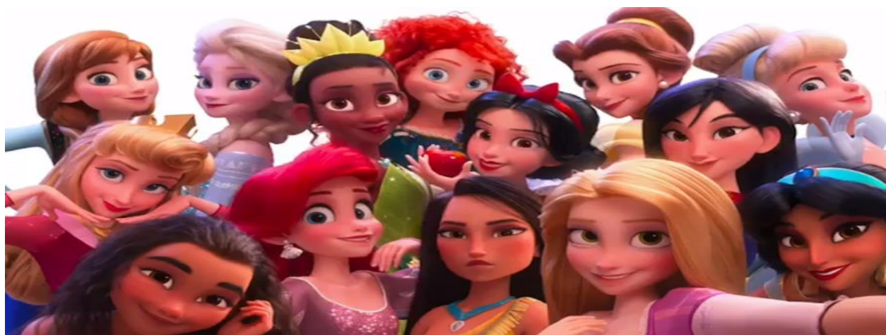
Imagen extraída de la película Wifi Ralph (2018)

El abanico de películas producidas por Disney es muy amplio y diverso. Sin embargo, en esta tesina nos enfocamos en las películas que tienen a las princesas como protagonistas. La franquicia de "Princesas Disney", como la propia productora las denomina, incluye también aquellas películas en las que la protagonista es hija de un gobernador o jefe de tribu, se casa con un príncipe o representa un papel heroico en su país. En total, la Walt Disney Company creó trece películas dentro de esta franquicia: