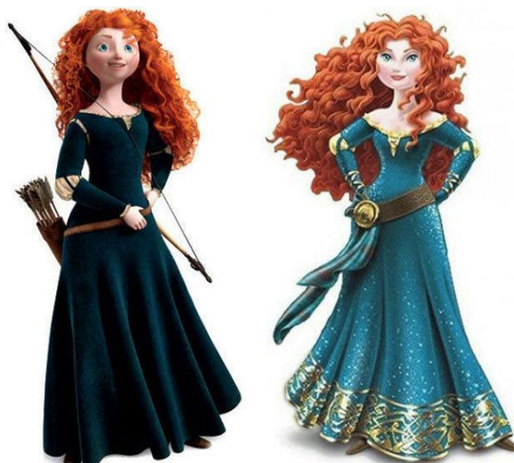
A Mighty Girl, 2013

En cuanto a esto, se recopilaron firmas en la página web change.org para solicitar a Disney que revirtiera los cambios en la imagen de la protagonista Mérida, realizados con el propósito de incluirla en la colección de "Princesas Disney". Es decir, la protagonista en la película tenía una imagen que luego, para incluirla en la colección de "Princesas Disney", fue modificada. Estos cambios difirieron considerablemente de la imagen original creada por su autora. La nueva