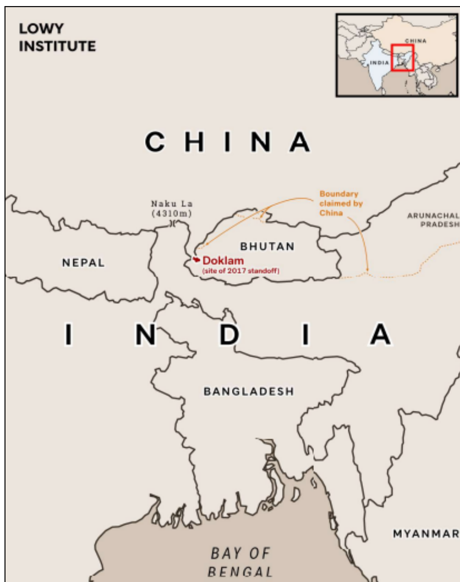
Mapa 2. Frontera Central y Oriental China - India: región de Sikkim donde se encuentra Doklam.