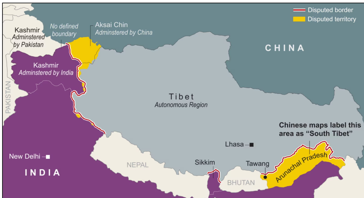
Mapa 1. Frontera China - India en 2023.

India y China comparten una frontera que se extiende aproximadamente 3.500 kilómetros a lo largo de las cordilleras de Karakoram e Himalayas. Esta frontera, conocida como la Línea de Control Real (LAC), aún no se encuentra completamente definida. Está dividida en tres sectores: oriental, central y occidental, siendo cada uno de los tres puntos de conflicto entre ambas naciones.