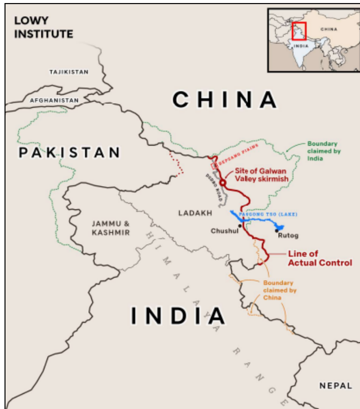
Mapa 3. Frontera Occidental China - India: región de Ladakh y Aksai Chin, donde se encuentra el Valle de Galwan.