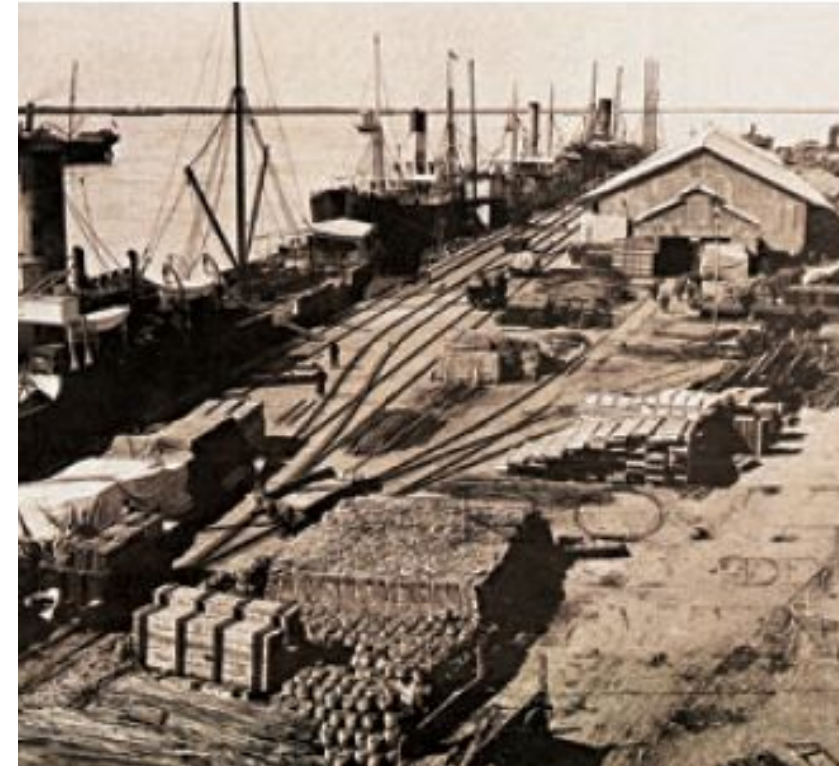
Puerto de Rosario a principios del siglo XX. A partir de fines del siglo XIX, las ciudades de Bahía Blanca y Rosario crecieron intensamente a causa de su actividad portuaria.