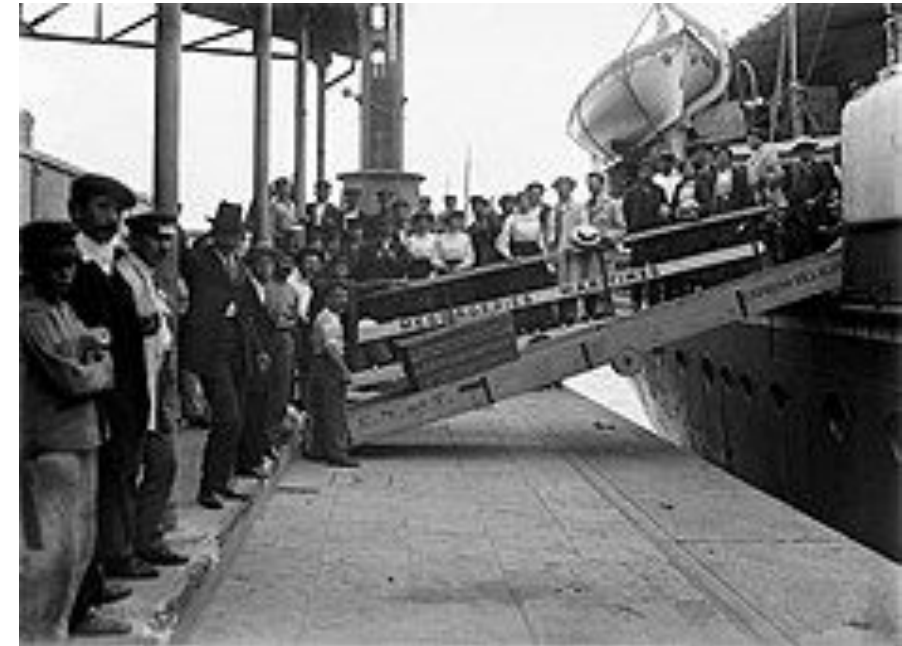
Inmigrantes europeos desembarcando en Argentina en el siglo XIX