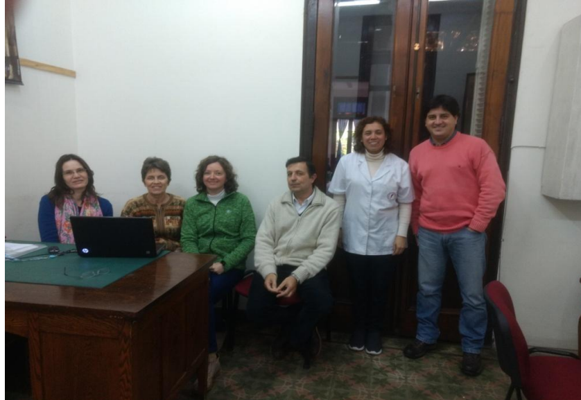
a) Archivo General de la Provincia de Entre Ríos