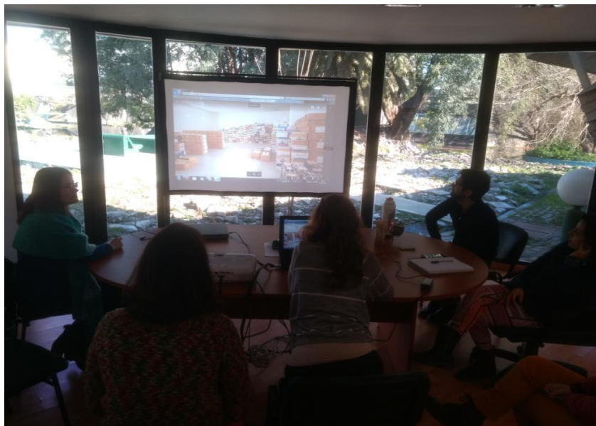
b) Archivo Histórico de los Servicios de Radiodifusión Sonora y Televisiva del Estado (RTA)