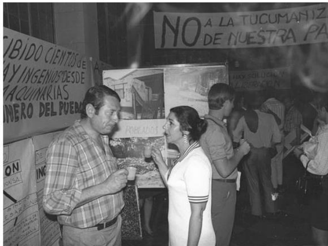
"Tucumán Arde" en la sede de la CGT de los Argentinos, Regional Rosario. Parte de la intervención consistía en servir café amargo .

En este sentido, Tucumán Arde se destaca como una manifestación artística que materializa un contra-discurso, en oposición a la retórica estatal, bajo la constatación de la relación directa que existe entre información y poder, consagrándose esta premisa como una de las principales aportaciones de la vanguardia argentina de los años sesenta, según la lectura que hace Jaime Vindel (2010).