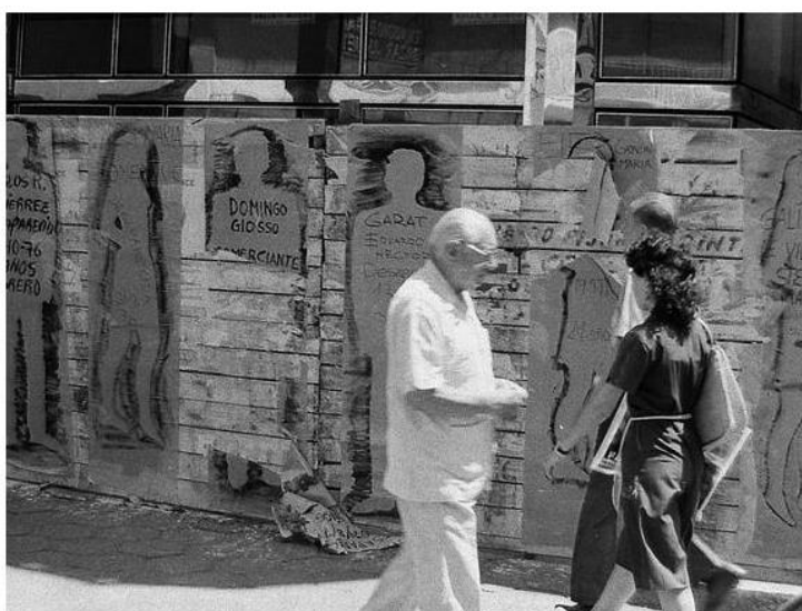
Siluetazo . Rosario, 1983. Locación no especificada.