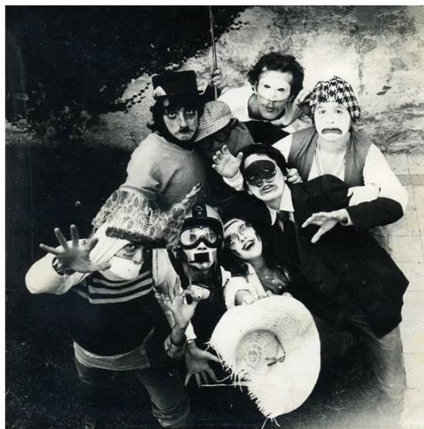
Grupo de Arte Experimental Cucaño. Rosario, 1980.

De esta manera y en retrospectiva, la experiencia de Cucaño puede ser leída en la matriz de resistencias a la dictadura en tanto nos permite dejar de leer este período como un momento yermo o un paréntesis durante el que en materia cultural no pasó nada . Revisitar Cucaño implica considerar las preguntas en torno a la faz productiva del arte, a sus ámbitos de