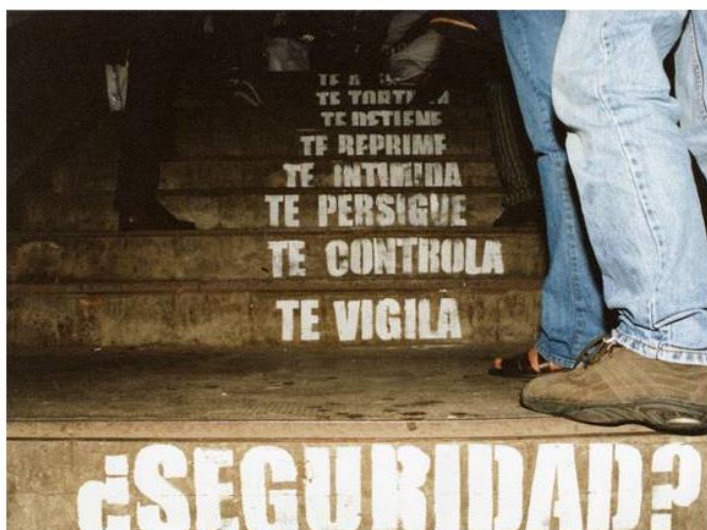
Intervención “Poema visual antirrepresivo”. Estación de Lanús (Buenos Aires), octubre de 2002.

En Capital Federal, se destaca el Grupo de Arte Callejero (GAC) 20 , conformado en 1997 por jóvenes mujeres estudiantes de arte, en la ciudad de Buenos Aires, que decidieron “trabajar y producir por fuera de los espacios tradicionales del arte” 21 . Sus primeras acciones consistieron en la realización de murales en apoyo a la protesta