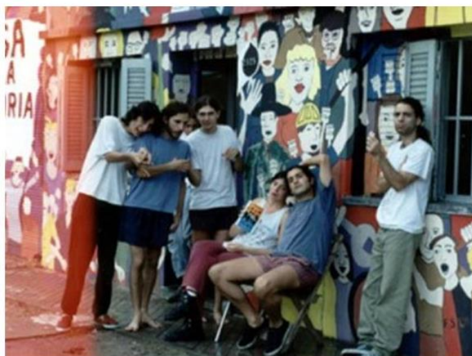
Frente de la “Casa de la Memoria” (Santiago 2815, Rosario). S/F.

El mural fue pintado en ocasión de la recuperación de la casa 19 por parte de la Asamblea Permanente por los Derechos Humanos en 1995, y participaron de forma conjunta Arte en la Kalle , H.I.J.O.S. y el Taller de Arte Experimental. Destacamos la relevancia de