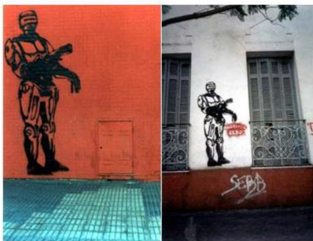
Stencil Robocop. Tolerancia cero . Locación no especificada.

Para ensayar una interpretación acerca del contra-discurso que propuso Robocop. Tolerancia cero , la popularidad del personaje Robocop 58 no puede ser soslayada al momento en el que los y las artistas que produjeron la pieza estética en cuestión lo seleccionaron como vector de transmisión de su mensaje, que necesariamente debía ser sintético, claro y conciso, que apelara a la homologación de ciertos significados y sentidos comunes sociales a partir de la representación de una figura: “queríamos vincular este tipo de abusos [los policiales] con la imagen de Robocop , por el policía bruto que acata las órdenes como una máquina” 59 . Así, en tanto las maneras en las que los referentes visuales habilitan el acceso a la comprensión de la realidad histórica desde una perspectiva