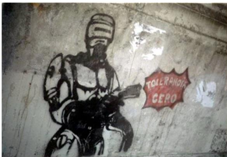
Stencil Robocop. Tolerancia cero . Locación no especificada.

Robocop. Tolerancia cero debe ser entendido entonces, como una totalidad compuesta por su materialidad artística (el stencil replicado en las paredes de la ciudad, el sticker y el tríptico) y su inmaterialidad simbólica (la elección de la figura de Robocop ) en su contexto de producción mediato (la historia del activismo artístico argentino) e inmediato (las declaraciones de funcionarios en torno al endurecimiento del