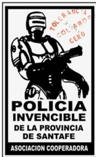
Sticker Robocop. Tolerancia cero.

El tríptico, que se distribuía en las charlas informativas que los organismos de derechos humanos daban en escuelas secundarias, condensaba la información más relevante de las mismas: presentaba una serie de instrucciones o consejos con los pasos a seguir en caso de ser detenidos por agentes policiales (por ejemplo, “Cuando te estén deteniendo siempre hay que llamar la atención, generar testigos”), informaba un número