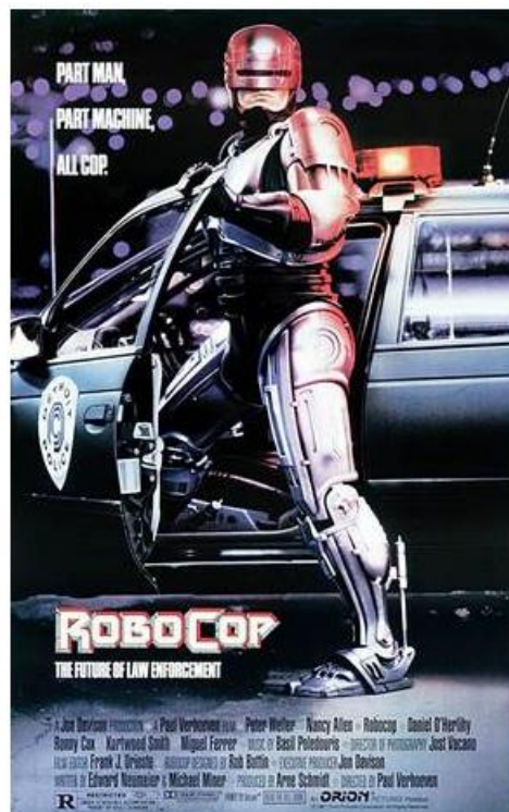
Póster de la película Robocop (Verhoeven, 1987)

La obra constó de varias instancias: concurrieron a escuelas a dar charlas y repartir volantes con teléfonos de abogados para que los jóvenes se comunicaran en caso de ser arrestados; produjeron un micro radial para dar difusión a la campaña que emprendían en contra de la política de tolerancia cero ; se repartieron stickers con la imagen de Robocop (emulando los otorgados por las cooperadoras policiales); y se elaboraron plantillas de stencil con la figura de Robocop a tamaño real y la frase