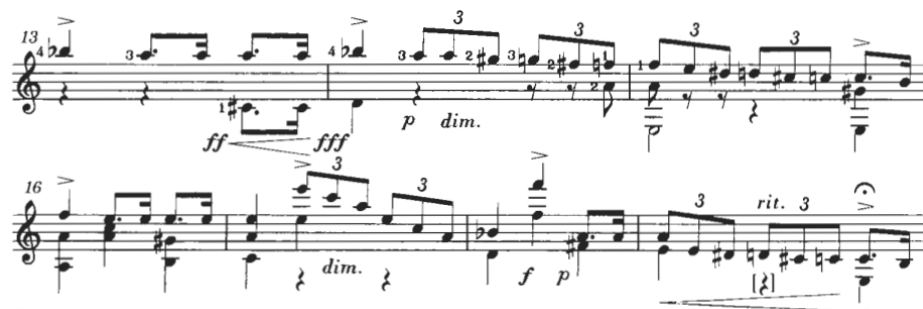
Figura 9: Mertz: Nänien Trauerlieder, Am Grabe der Geliebten , guitarra 1.

Desde el compás 13 hasta el 19, podemos observar una asimilación de la marcha fúnebre al compás de 3/4, con una repetición casi onomatopéyica de la figura de ritmo royal. Por otra parte, se pueden ver elementos del bel canto, propios del estilo cantado, que se alternan entre las 2 guitarras, Figura 9 y 10.