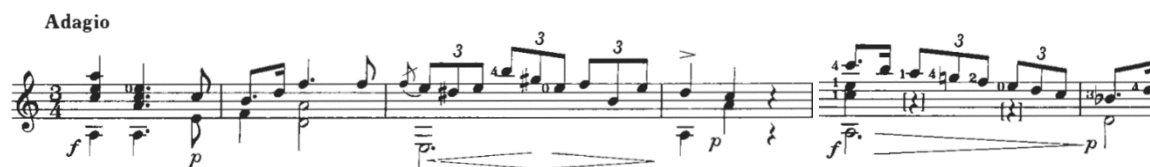
Figura 4: Mertz: Nänien Trauerlieder, Am Grabe der Geliebten , guitarra 1.

La armonía que encontramos en los 3 primeros compases la podemos denominar schemata armónica. La schemata , en palabras de Byros (2014) conlleva un mensaje filosófico que involucra las consecuencias espirituales del sufrimiento, el sacrificio personal y la muerte. La schemata utilizada por Mertz (i-ii5/6-V7, Figura 5) es similar, junto con su ritmo, al Preludio n°20 Op.28 y la Marcha fúnebre Op.72 n°2 de Chopin.