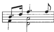
Figura 2: Mertz: Nänien Trauerlieder, Am Grabe der Geliebten , guitarra 1.

En el primer tiempo del segundo compás, en la guitarra 1, nos encontramos con el ritmo de corchea con puntillo y semicorchea, ritmo royal o sea el ritmo punteado de la obertura francesa, que también es considerado un estilo alto en tempo lento, Figura 2.