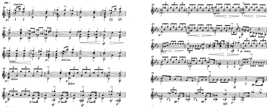
Figura 13 y 14: Mertz: Nänien Trauerlieder, Am Grabe der Geliebten , guitarra 1 y 2.