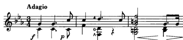
Figura 5: Mertz: Nänien Trauerlieder, Am Grabe der Geliebten , guitarra 2.

La armonía que encontramos en los 3 primeros compases la podemos denominar schemata armónica. La schemata , en palabras de Byros (2014) conlleva un mensaje filosófico que involucra las consecuencias espirituales del sufrimiento, el sacrificio personal y la muerte. La schemata utilizada por Mertz (i-ii5/6-V7, Figura 5) es similar, junto con su ritmo, al Preludio n°20 Op.28 y la Marcha fúnebre Op.72 n°2 de Chopin.