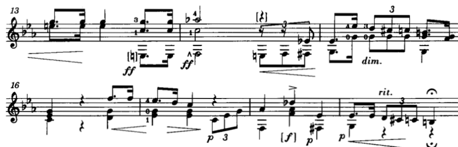
Figura 10: Mertz: Nänien Trauerlieder, Am Grabe der Geliebten , guitarra 2.

A partir del compás 20 y hasta el compás 35, alternado entre ambas guitarras, encontramos un tópico de pictorialismo, el cual Ratner (1980) explica que el pictorialismo en