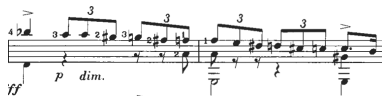
Figura 8: Mertz: Nänien Trauerlieder, Am Grabe der Geliebten , guitarra 1.

En los compases 15 y 16, en la primera guitarra, podemos observar un descenso cromático, Figura 8, este descenso en palabras de Head (2014) está asociado al lamento, ya desde el periodo Barroco y se enmarca en el estilo sensibilidad.