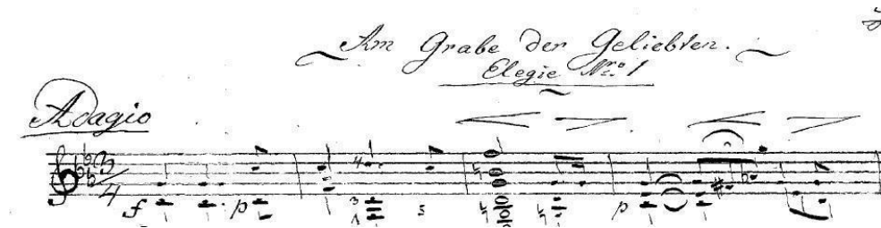
Figura 1: Mertz: Nänien Trauerlieder, Am Grabe der Geliebten , guitarra 1.

En el primer tiempo del segundo compás, en la guitarra 1, nos encontramos con el ritmo de corchea con puntillo y semicorchea, ritmo royal o sea el ritmo punteado de la obertura francesa, que también es considerado un estilo alto en tempo lento, Figura 2.