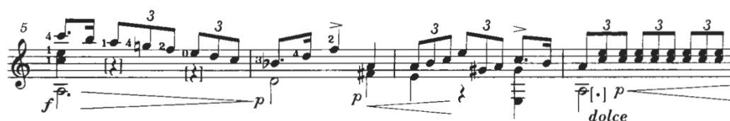
Figura 6: Mertz: Nänien Trauerlieder, Am Grabe der Geliebten , guitarra 1.

El acorde napolitano, en una secuencia cadencial, es frecuente en un final de aria de lamento. Este tipo de uso del acorde es considerado un gesto de exageración, de un gran lamento en el modo menor. El rubato es característico en la interpretación de este acorde. Por otra parte, este fragmento se corresponde con el estilo cantado que plantea Ratner (1980), Figura 6.