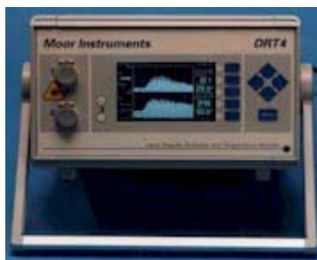
Unidade de laser Doppler Mod. DRT4" da casa MOOR INSTRUMENTS

A partir dos anos 80 foram feitas as primeiras pesquisas sobre as utilidades do Laser Doppler Flowmeter e começam a aplicar-se no sistema microvascular de diversos órgãos vitais, e depois foram realizados estudos sobre o uso na vitalidade pulpar em dentes humanos e inclusive foram informados casos de dentes com traumatismo nos quais o uso do Laser Doppler Flowmeter foi útil.