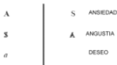
Esquema de la división subjetiva

completud inexistente. Por el contrario, la angustia se escribe en el segundo piso, en donde se sitúa el encuentro con el Otro barrado, con la castración en el Otro, con la certeza de que no hay Otro.