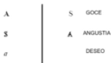
Esquema de la división subjetiva

ansiedad representa más bien una certeza que imposibilita la entrada en análisis. Si en este punto retomamos el esquema de la división subjetiva que Lacan (2006) trabaja en el Seminario X podríamos ubicar ansiedad y angustia dentro de esta estructura para comprender porque el autor coloca a la angustia del lado de la posibilidad del deseo y la ansiedad como una posición que no permite que el análisis se dirija a este punto.