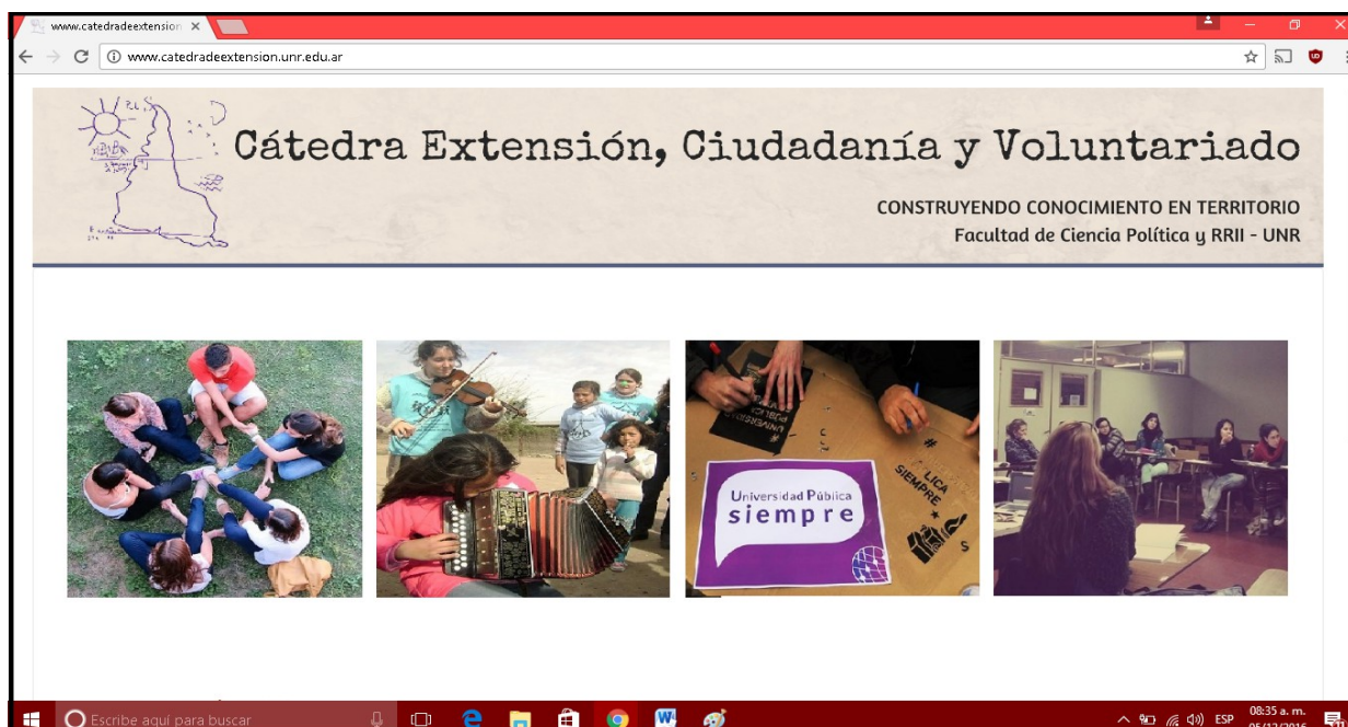
Portada página web

Dialoguemos: conjuga las vías de comunicación que conducen a la asignatura, tales como redes sociales, dirección, teléfono y mail.