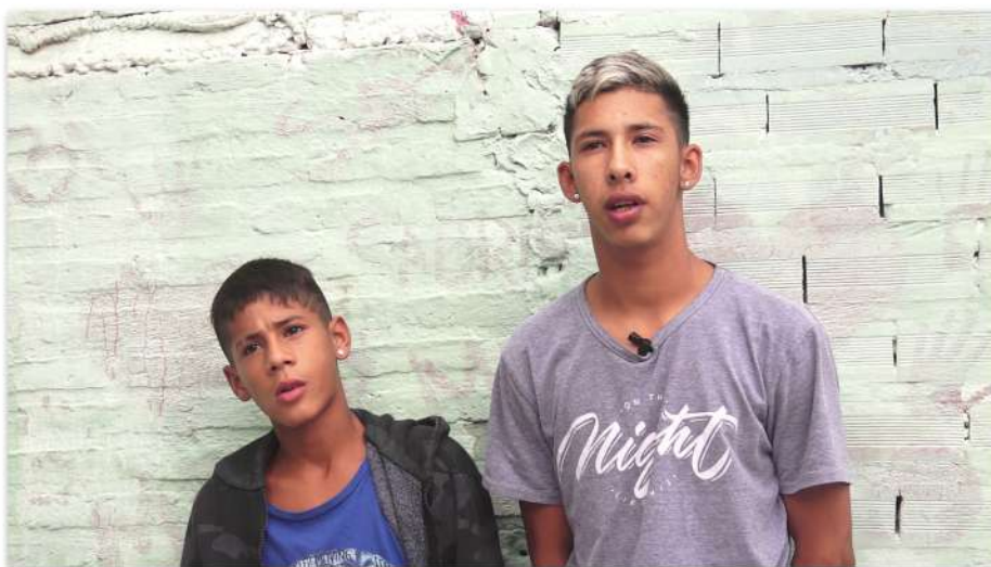
Entrevista en Club 20 Amigos

Por supuesto que no todas las entrevistas fueron igual de fluidas, algunos entrevistados tenían mucha facilidad de expresión o estaban más acostumbrados a dar cuenta de los temas sobre los que estábamos hablando y otros respondían de manera cerrada y más escuetamente, lo que nos demandaba repreguntar o reformular las preguntas para encontrar respuestas más ricas y lograr que se puedan explicar.