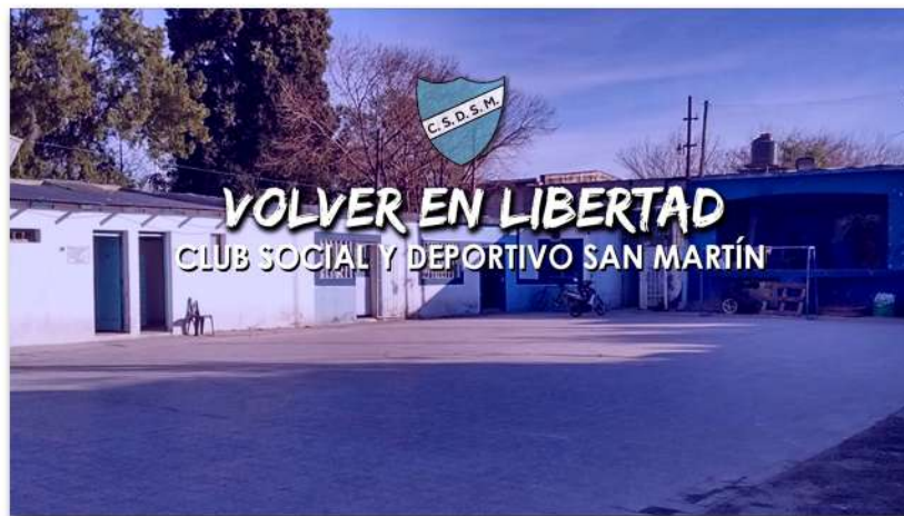
Trabajo final de seminario Laboratorio de Creación Documentales Audiovisuales

Con el paso del tiempo y al ir encontrándonos en jornadas culturales y peñas con personas que participan en esos clubes, aparecieron las ganas de extender y profundizar aquellas primeras producciones que habíamos hecho para el seminario. Así fue que decidimos retomar el proyecto y contar esas historias de organización y resistencia en los barrios de nuestra ciudad.