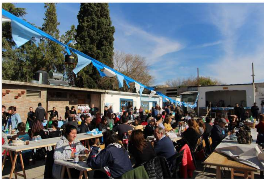
Peña en Club San Martín, barrio la Florida

ocupados por personas que defendían otros intereses. Quienes llevan adelante los talleres donde concurren jóvenes de los barrios, cuentan cuáles son sus motivaciones para sostener esos espacios y destacan el trabajo conjunto con otras instituciones. También está presente la voz de los vecinos y socios que dan cuenta de la importancia de los clubes como lugar de encuentro.