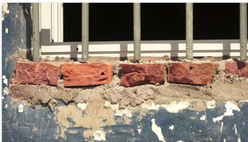
Club San Martín en obras

Para comenzar la producción del documental, nos contactamos con personas de los distintos clubes para contarles la idea, proponerles participar y así fuimos pactando los primeros encuentros y entrevistas. Esta tarea inicial de establecer los primeros contactos nos resultó sencilla, ya que conocíamos de antemano a referentes de los clubes que a su vez nos acercaron a las Comisiones Directivas que rápidamente se mostraron interesadas en el proyecto y dispuestas a colaborar y contarnos sobre su trabajo y actividades.