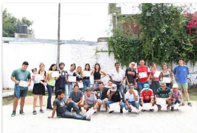
Egresados taller de albañilería.

Al recorrer las historias particulares de estas instituciones, podemos reconocer el rol fundamental de los clubes de barrio en la vida social de la ciudad. Estos espacios, históricamente permitieron y permiten generar vínculos entre vecinos, son lugares para el desarrollo de la juventud, la expresión de la cultura popular, territorios de participación horizontal y solidaria donde día a día se construye identidad.