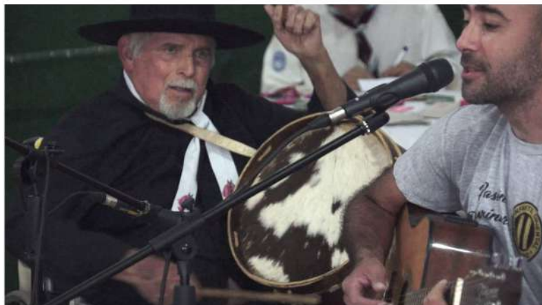
Peña club 20 Amigos