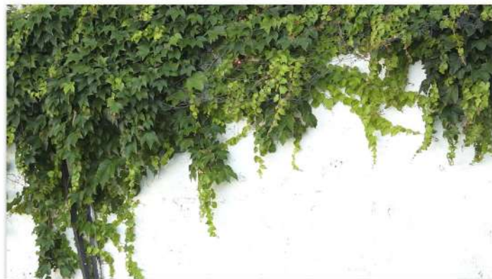
Exterior en club Atlanta

También registramos festejos y peñas que tuvieron lugar en los clubes, para visibilizar de esa manera las distintas expresiones culturales que allí conviven.