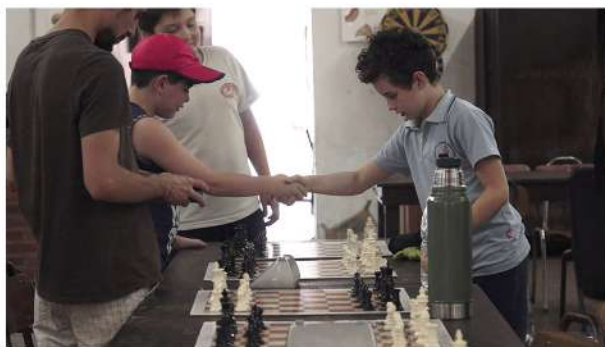
Taller de ajedrez en el club Atlanta

Por eso elegimos contar la vida de estos clubes y su rica historia de organización y construcción solidaria a través de las voces de los vecinos de los barrios Triángulo, Echesortu y La Florida, desde sus socios más antiguos hasta los jóvenes que hoy en día continúan ese legado. Nos resulta importante destacar el proceso que llevan adelante desde hace algunos años, cuando decidieron recuperar los clubes para devolverles su función social y cultural. Entendemos que es fundamental registrar este proceso, que es parte de la historia de esos barrios y también de la ciudad.