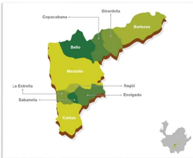
Gráfico 2. División Administrativa de la Subregión del Valle de Aburrá