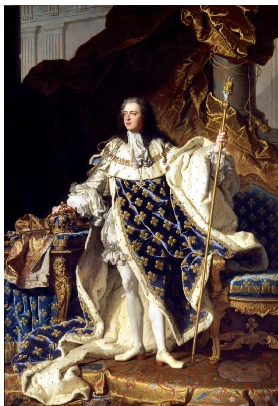
Luis XV de Francia

A mediados del siglo XVIII, la economía de Francia se encontraba en una muy mala situación. El rey Luis XV llevó al país a guerras innecesarias que agotaron el tesoro. Los efectos de estas desastrosas guerras intentaban ser mitigados mediante un sistema fiscal opresivo. Adicionalmente, se habían aplicado políticas mercantilistas que restringían el comercio. El producto de la agricultura y el valor de la tierra decrecían. Los agricultores debían entregar una gran parte de su producto al terrateniente y el resto estaba fuertemente gravado, mientras que la nobleza y el clero, que eran dueños de gran parte de la superficie del país, estaban exentos de impuestos. El sector agrícola estaba en decadencia y la población agrícola disminuía. La fisiocracia surgió como respuesta a este estado de la economía francesa.