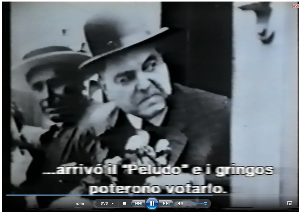
Nº 10 : Representación Los gringos y la política: “nos llamo ciudadanos”... “votamos”