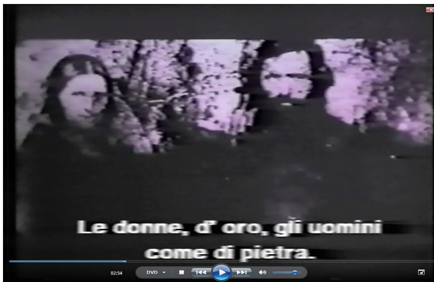
Nº 11: FOTO : sobrepuesta filmina dibujada: ” mujeres de oro y hombres como de piedra “