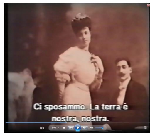
Nº 3 Foto - Representación : Mujer – familia nº 4 : foto: “ nos casamos. La tierra es nuestra , nuestra”.