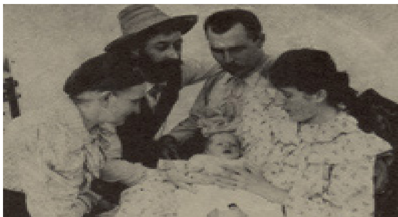
Nº 5 Foto – Representación: “con tu nacimiento se alegró la tierra”