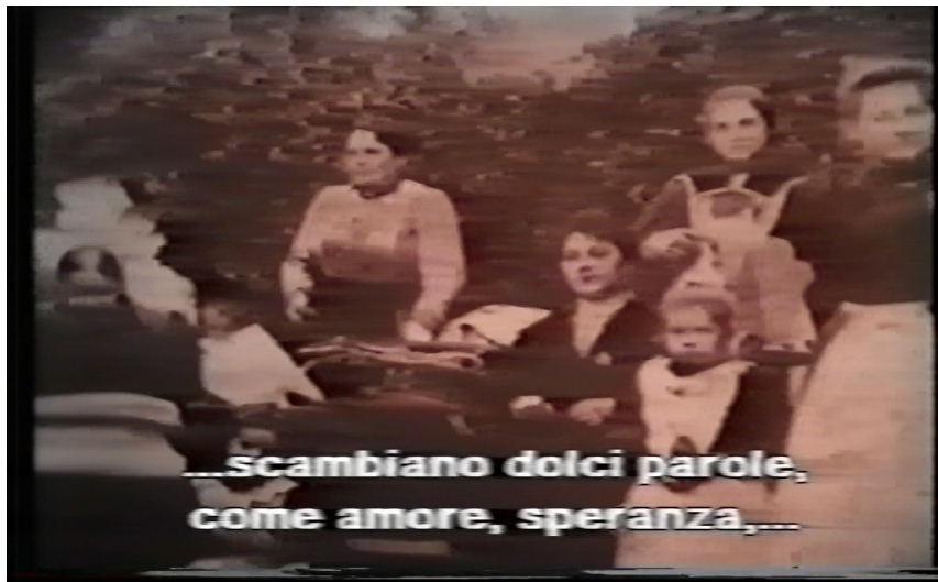
Nº 6: Representación las mujeres : “amor ... compañera de mi vida”