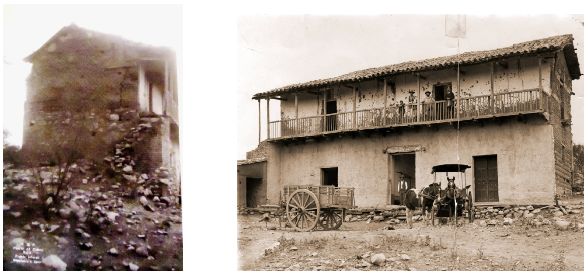
Figura 3. Derecha foto de 1925 en la que puede observarse parte de la estructura excavada en funcionamiento. Izquierda, foto de 1942 en la que se observa el episodio de derrumbe que sepultó la estructura excavada