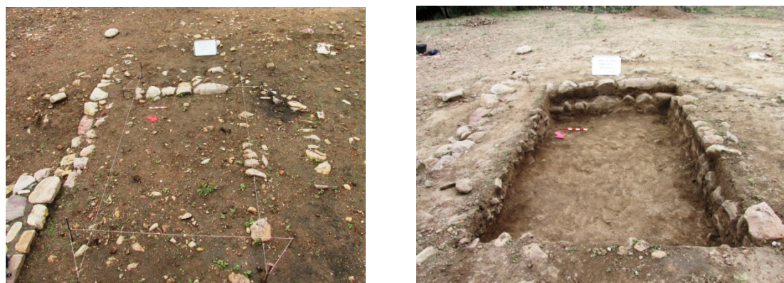
Figura 2. Cuadrícula de excavación en la que se observa la línea de muro de la estructura asociada a la casa principal en el Fuerte de Cobos

Respecto a los conjuntos cerámicos analizados, todos ellos corresponden a cerámica de terracota sin decoración mientras que en un solo caso pudimos detectar cerámica de color verde vidriada. Estas cerámicas se asemejan a aquellas de manufactura jesuita y posiblemente su uso se encuentre extendido entre fines del siglo XVII y XIX.