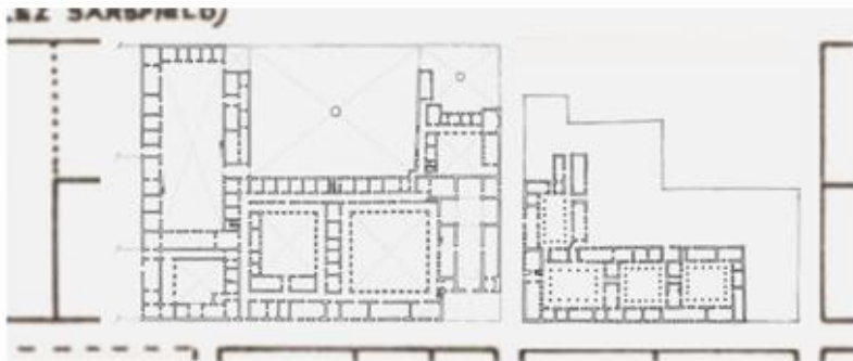
RECONSTRUCCION DE LOS EDIFICIOS DEL COLEGIO MAXIMO Y CONVICTORIO DE MONSERRAT - 1767