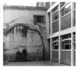
ARCHIVO INSTITUTO "MARINA WAISMAN" UCC - 1978