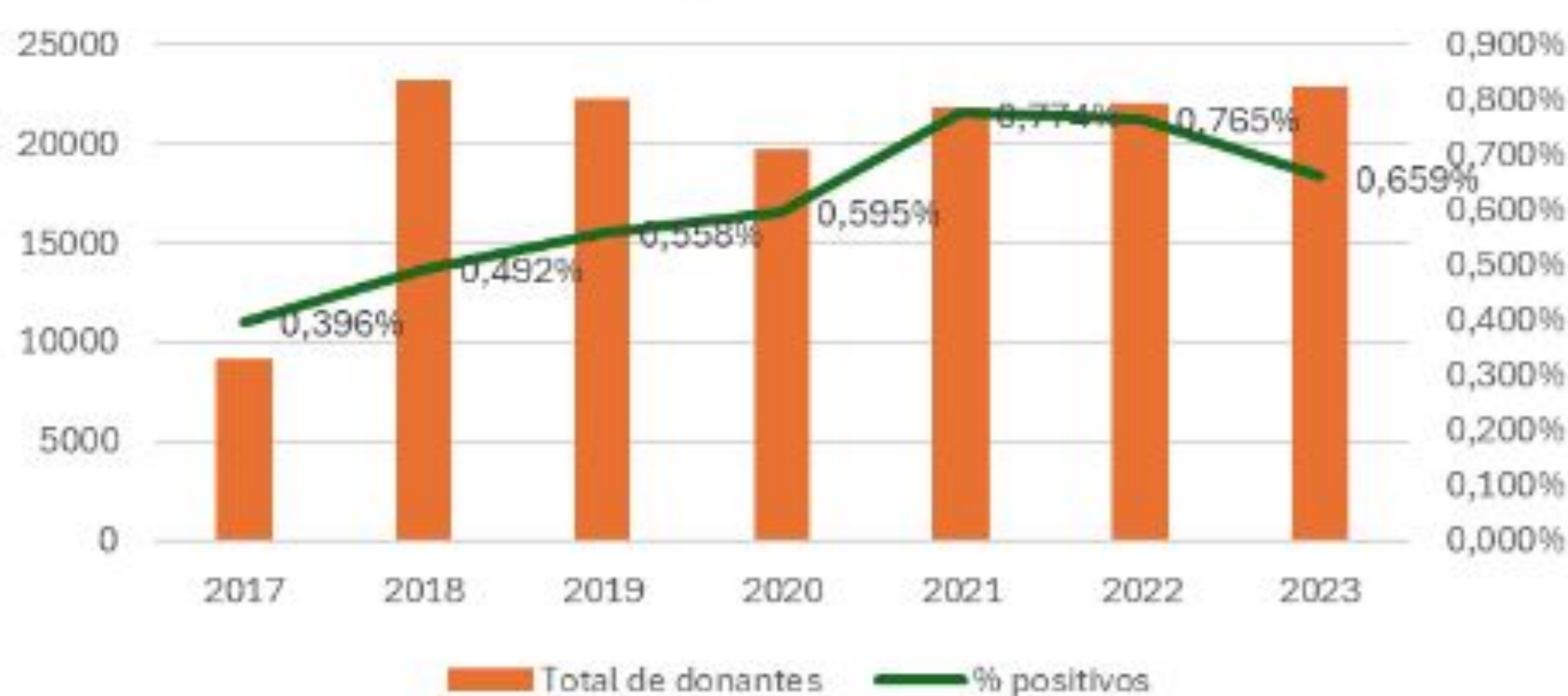
Evolución de cantidad de donantes vs tasa de positivos