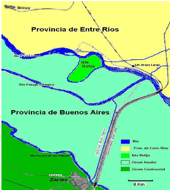
Figura 1. Reserva natural y refugio de vida silvestre Isla Botija