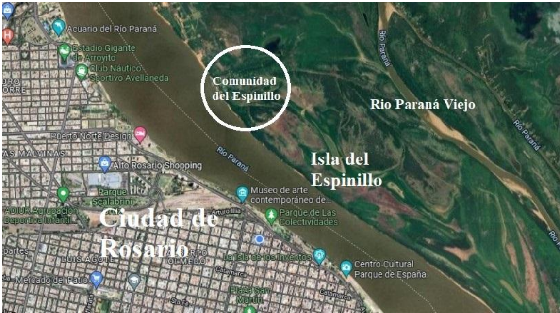
Figura 5. Isla del Espinillo