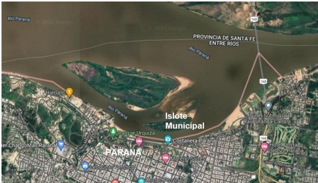
Figura 3. Monumento Natural Provincial Islote Municipal Curupí