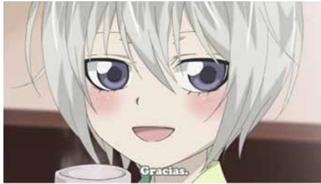
Tomoe se convierte en niño