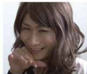
Ranka en el dorama