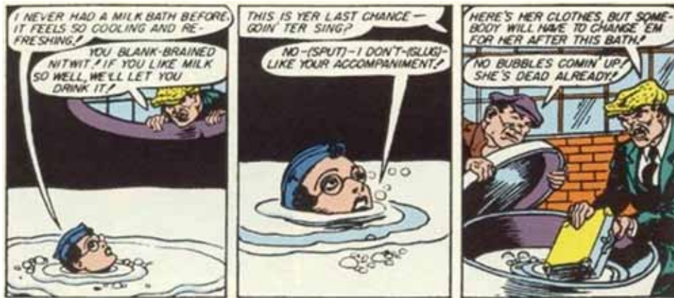
(Detalle de viñetas, Sensation Comics 7, 8 y 9)