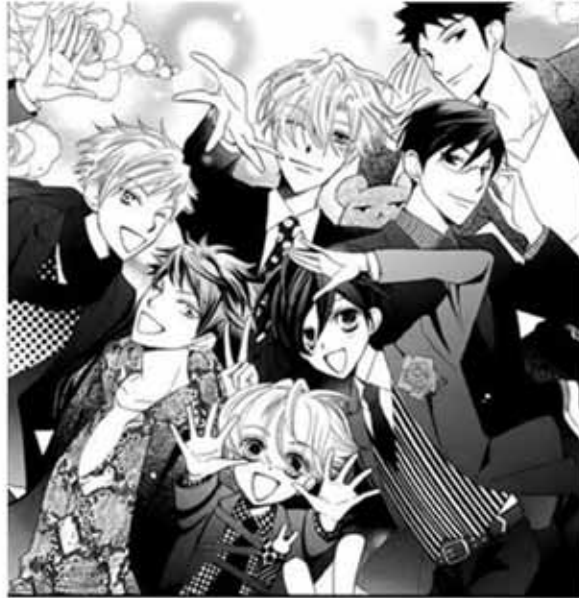
El Host Club en el manga