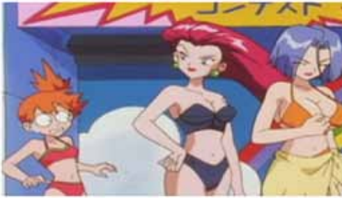
"Vacaciones en Acapulco" (censurado)