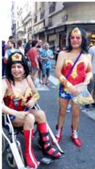
(Marcha del orgullo LGBTIQ 2015, Buenos Aires)

Como señala Spieldenner, la Mujer Maravilla en algún momento del siglo XX se convierte en un ícono de la comunidad gay norteamericana, y gracias a la influencia y proyección del movimiento gay norteamericano y la globalización del género de superhéroes se puede pensar que funcionaría como una suerte de ícono transnacional. Porque, por ejemplo, podemos encontrar a la Mujer Maravilla en la marcha del orgullo en Buenos Aires en 2015.