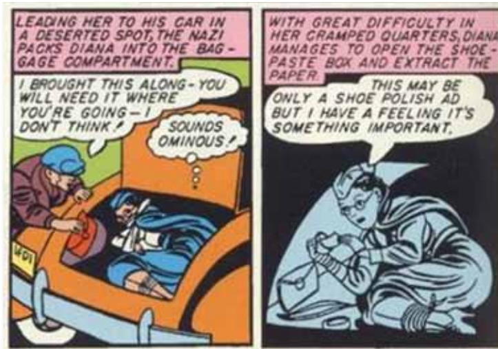
(Detalle de viñetas, Sensation Comics 15, 7)