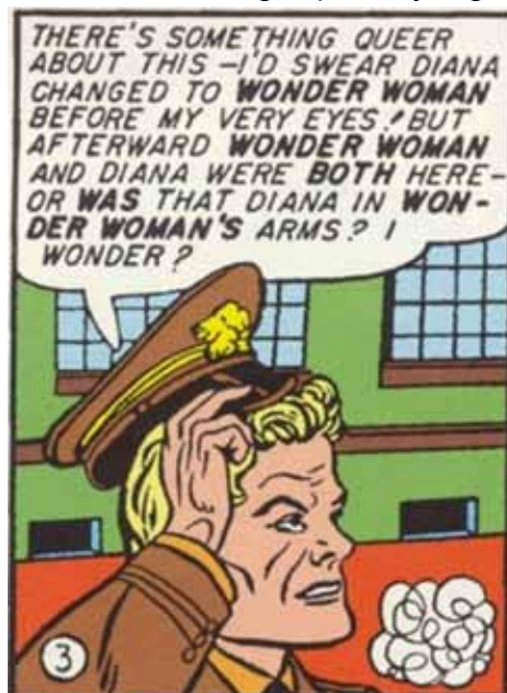
(Detalle de viñeta, Sensation Comics 15, 5)

Llaman la atención, por supuesto, ni queer ni gay tienen el significado que en décadas posteriores, pero ya en esa época eran términos que podían ser leídos por los “entendidos”, formas de leer la sexualidad no normativa entre líneas. ¿Formas de resistencia? Podría ser, algo llama la atención en que Steve Trevor, el interés romántico de Diana, diga que hay algo “queer” en Diana: