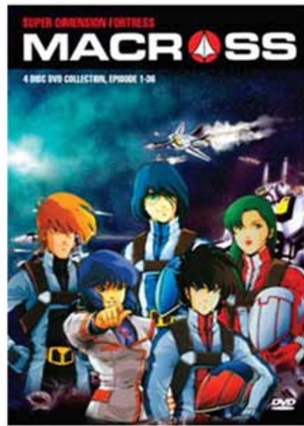
Tapa del DVD de "Super Dimensional Fortress