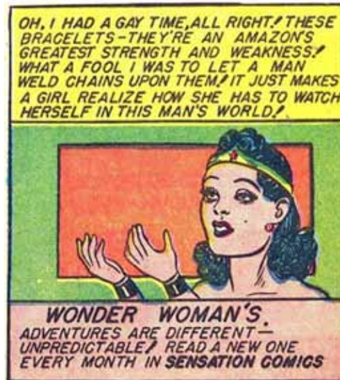
(Detalle de viñeta, Sensation Comics 4, 15)

Ahora, hay algo más, ¿cómo se convierte Wonder Woman en un ícono gay? ¿Simplemente por ser mujer? Hay algunas señales o indicios que podrían ayudar a pensar el recorrido gay de la Mujer Maravilla. Ciertos usos de términos como “Gay times”, “Queer” en algunas historietas: