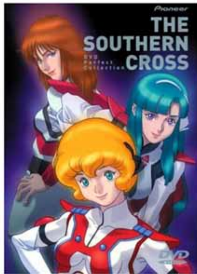
Tapa del DVD "Super Dimensional Cavalry