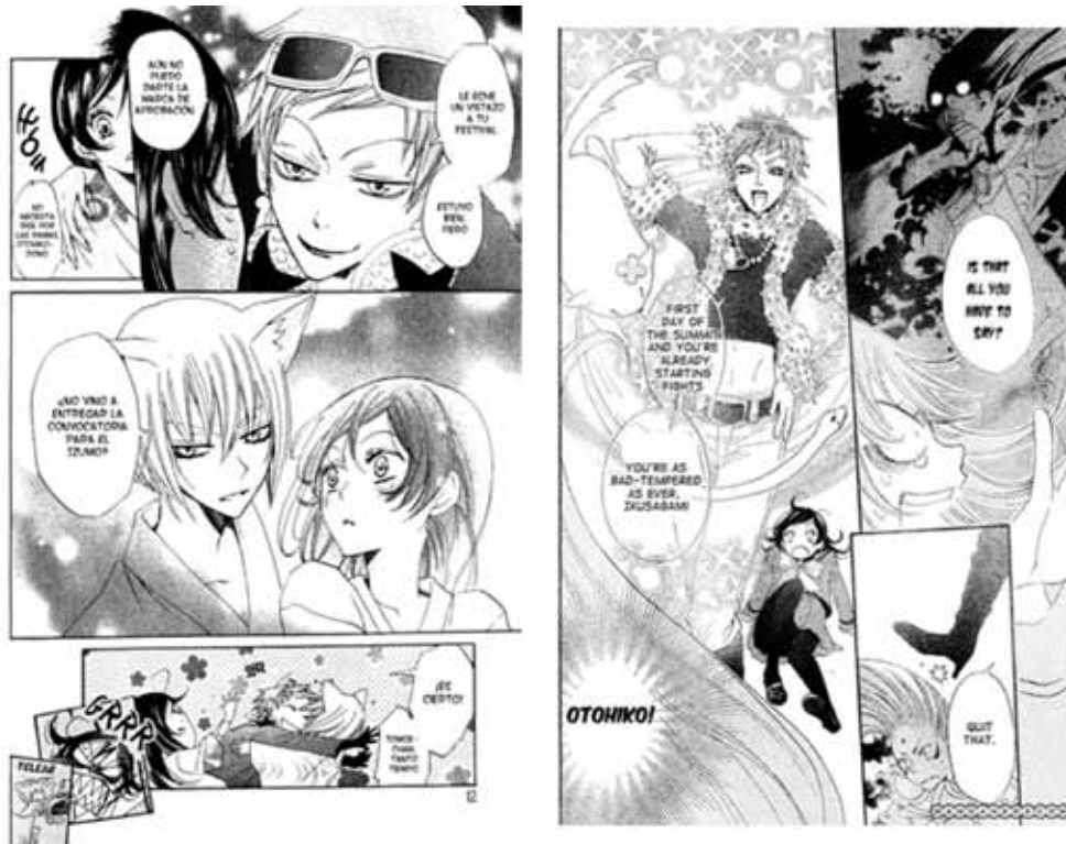
Otohiko en el manga