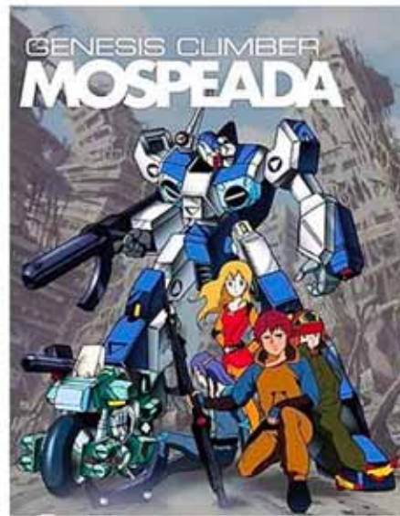
Genesis Climber MOSPEADA