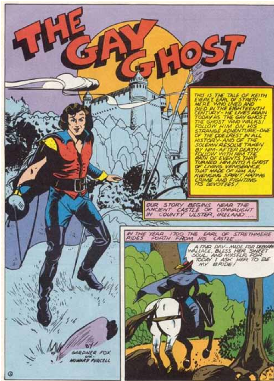
(Página completa, Sensation Comics 1, 33)

Y vamos a otro detalle, en Sensation Comics , durante los primeros números se publican varias otras historias de otros personajes, uno es The Gay Ghost . Eso no quiere decir nada, pero tal vez sean indicios, porque The Gay Ghost es textualmente queer: