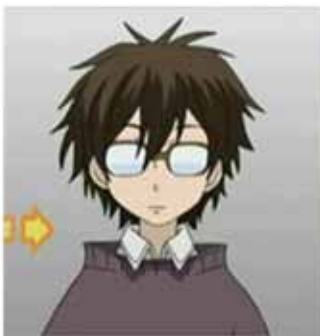
Haruhi "desaliñada" en el animé