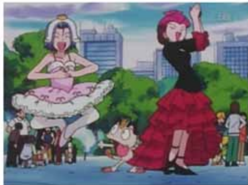
"El poder de las flores" (no censurado)