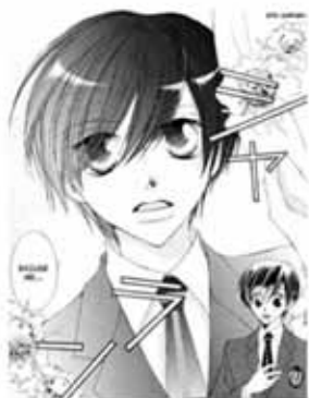
Haruhi-kun en el manga