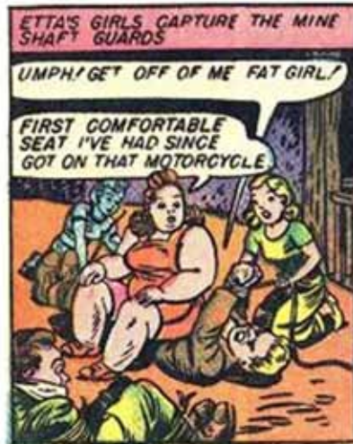
(Etta Candy, detalle de viñeta, Sensation Comics 4, 14)

En los primeros números ya aparece Etta Candy con un ejército de mujeres golpeadoras que responde a la Mujer Maravilla. Y Etta no es la mujer-objeto que puede parecer Diana, Etta es una mujer con sobrepeso que disfruta de su cuerpo y su poder físico: