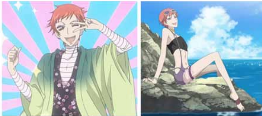
Otohiko en el animé