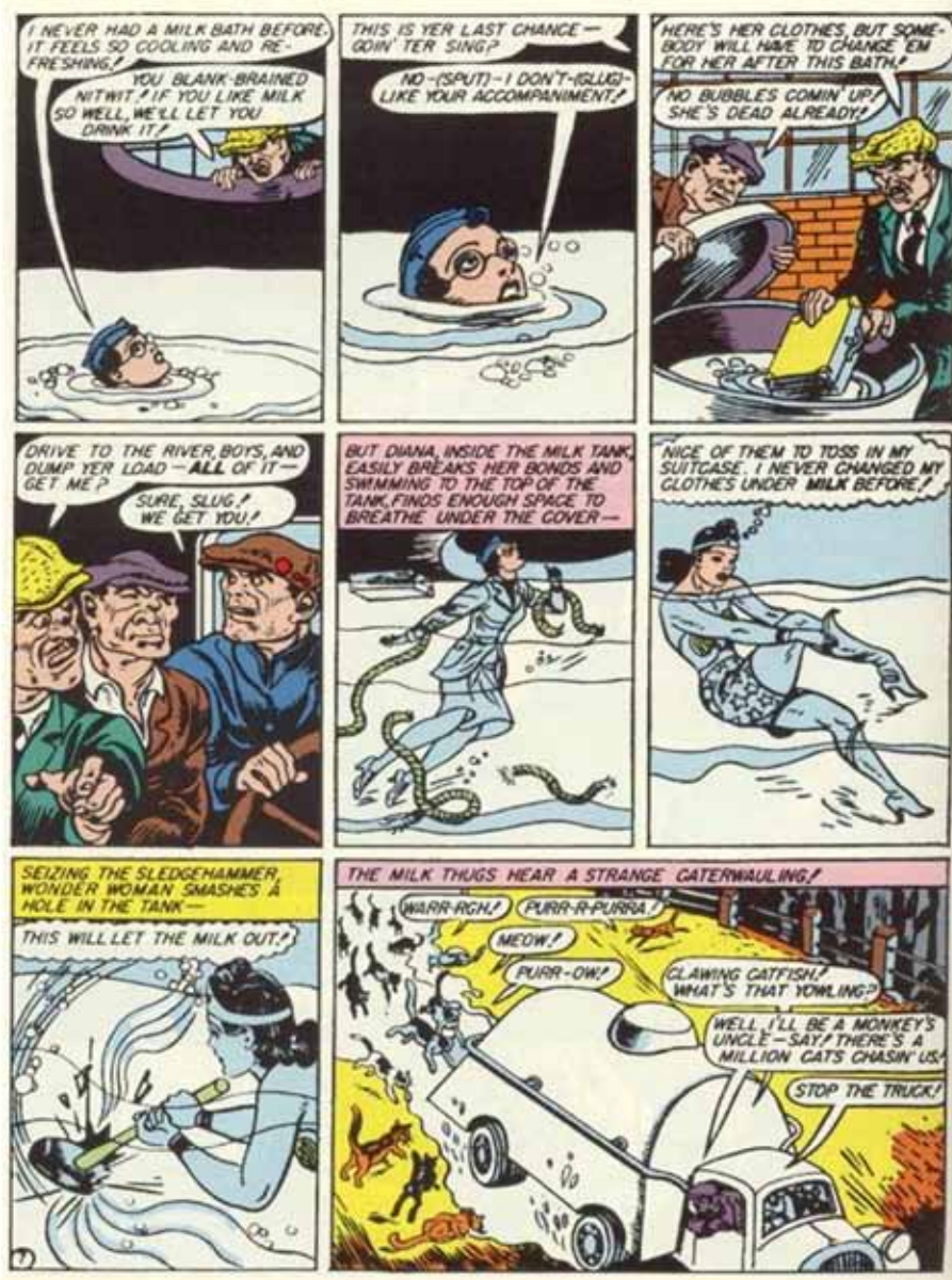
(Página completa, Sensation Comics 7, 9)