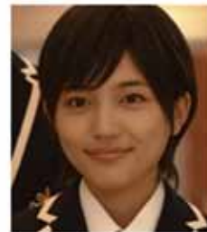
Haruhi-kun en el dorama