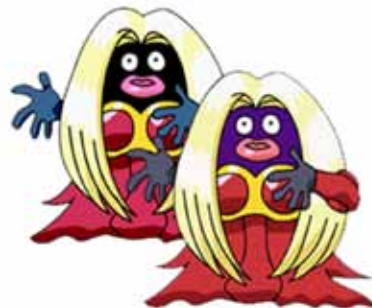
Jinx en sus dos versiones