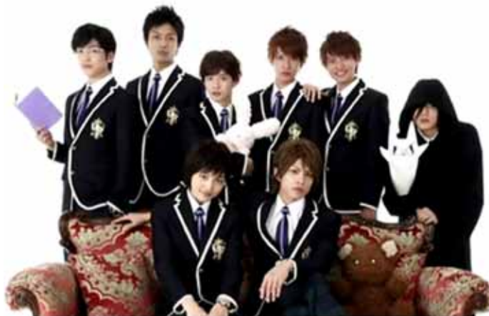
El Host Club en el drama