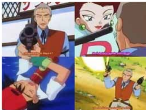
"La leyenda de Dratini"