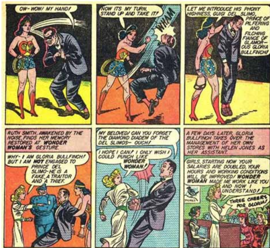
(Detalle de viñetas, Sensation Comics 8, 14 y 15)