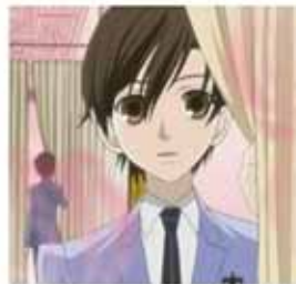
Haruhi-kun en el animé