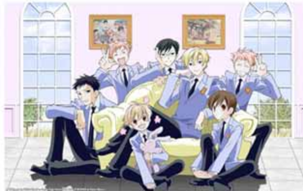
El Host Club en el animé