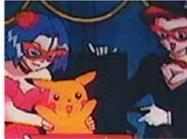
"Día del niño" (censurado)