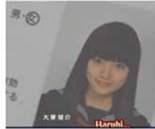
Haruhi con el pelo largo antes de Ouran