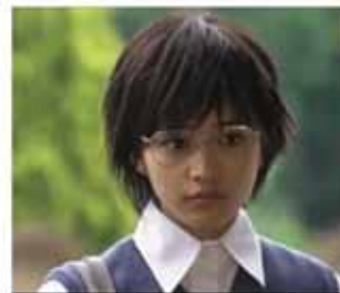
Haruhi "desaliñada" en el dorama