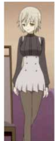
Las transformaciones de Miketsukami-kun