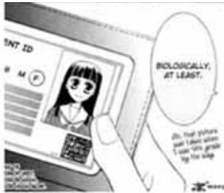
Haruhi con pelo largo en el manga