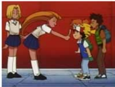
"Batalla a bordo del Santa Ana" (no censurado)