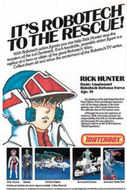
Publicidad de las figuras de acción de "Robotech"