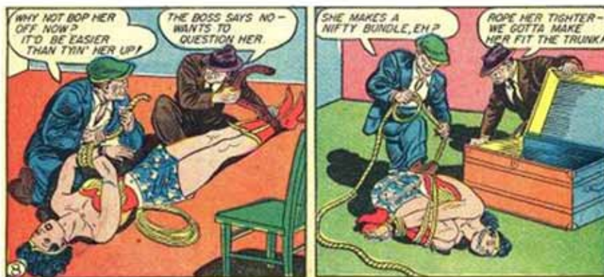
(Detalle de viñetas, Sensation Comics 8, 10)

Pero al mismo tiempo ella siempre triunfa y se libera, o incluso de deja aprisionar sólo para liberarse, y en general cuando las mujeres se reúnen logran triunfar físicamente contra los varones: