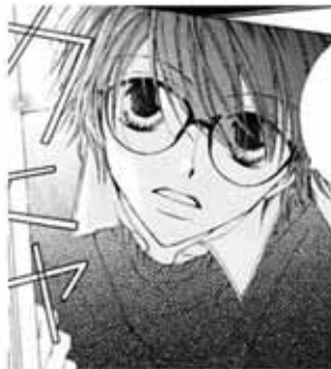
Haruhi "desaliñada" en el manga