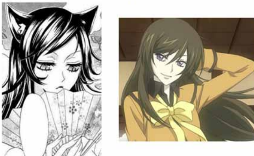
Tomoe se convierte en Nanami