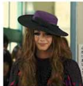
Isabella en la película live action