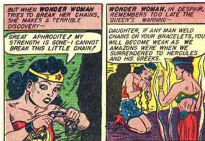
(Detalle de viñetas, Sensation Comics 4, 12)

Las imágenes de cadenas y situaciones extrañas se suceden a menudo: la Mujer Maravilla encadenada, aprisionada, atada, nalgueada, bañada en leche, etc.: