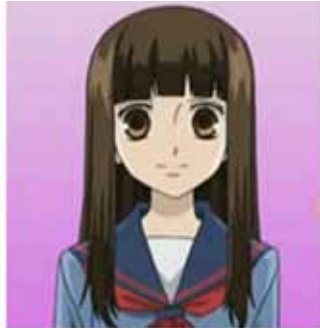
Haruhi con pelo largo en el animé