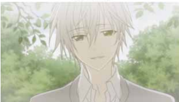
Sōshi en el animé