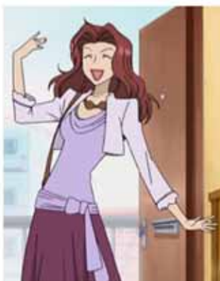
Ranka en el animé