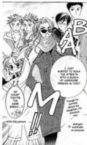
Ranka en el manga