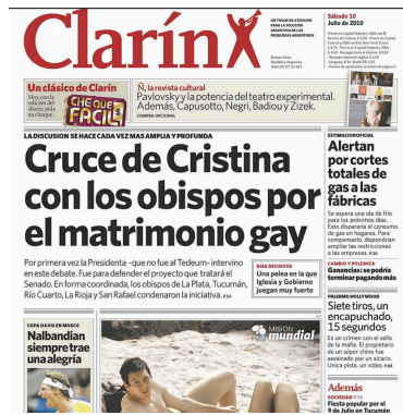
Portada del 10/07/2010

Los titulares no nombran a los actores sociales/culturales comprometidos con el debate, omiten los marcos simbólicos y desactivan los elementos que podrían conferirles densidad política a la cuestión. De este modo, se consolida una estrategia discursiva que construye el acontecimiento como procedimiento. La sobriedad, la impersonalización y la neutralidad aparente no son marcas de objetividad, sino decisiones enunciativas que configuran un posicionamiento específico.