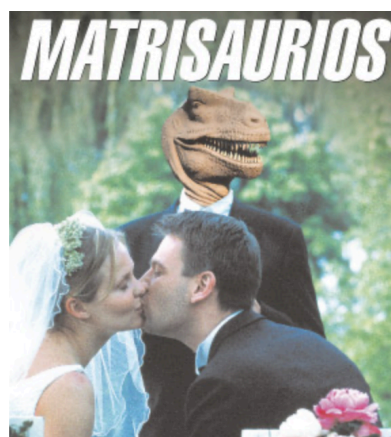
Imagen de tapa del 26/07/2010

El repertorio visual del diario incluye fotografías, caricaturas, ilustraciones y fotomontajes. Esta diversidad responde a una lógica topográfica -más que taxonómica- donde el sentido no se organiza por secciones fijas o jerarquías predeterminadas, sino por el juego articulado de recursos que se disponen de forma estratégica en el espacio tapa. Las caricaturas, por ejemplo, si bien mantienen un mismo lugar en todos los ejemplares de tapa, permiten siempre una intervención crítica mediante la deformación gestual y la sátira política. El fotomontaje de la tapa del 26/07/2010, titulado “Matrisaurios”, muestra a una pareja heterosexual besándose bajo la mirada de un dinosaurio. Esta imagen no documenta un hecho, sino que produce una operación categorizadora: asocia lo conservador con lo arcaico, dotando a la escena de una significación política sin necesidad de explicación verbal.