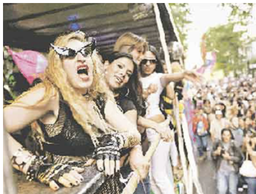
Imagen de la portada del 08/11/2009

En algunos casos, la imagen acompaña desde una escena neutralizada. En la portada del 08/11/2009, la fotografía de una carroza de la Marcha del Orgullo aparece junto al título “Fiesta gay con fuertes reclamos” (una de las pocas veces que aparece una voz no institucional y colectiva). El encuadre enfatiza lo festivo por sobre lo reivindicativo: no hay pancartas legibles ni gestos políticos destacados, no hay reclamos visibles en la imagen. La imagen funciona como documento de color, no como vector de politización: se mostró lo que pasó en relación a la fiesta, no a los reclamos.