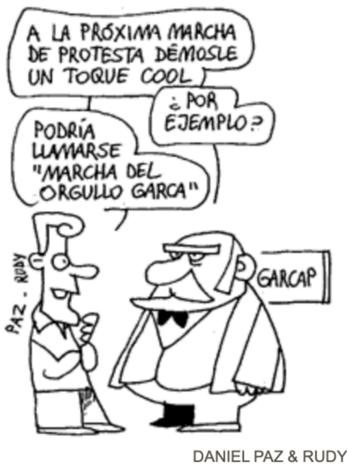
Caricatura del 23/11/2009

elementos centrales dentro de la construcción del sentido en la tapa, con capacidad para intervenir en la lectura del acontecimiento incluso sin apoyo textual. En el caso de las caricaturas de fechas como el 01/11/2009 y el 23/11/2009, la carga satírica permite una desnaturalización del discurso hegemónico, en clave de ironía compartida con el lector, reforzando una relación de complicidad dentro del contrato de lectura.