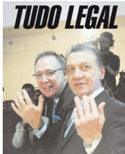
Imagen de tapa del 31/07/2010

Otro ejemplo de esta lógica visual se observa en la tapa del 14/07/2010, que acompaña el título “De igual a igual” con una serie de imágenes afectivas de parejas del mismo sexo. Aquí se activa una función categorizadora, en tanto las imágenes organizan una escena de igualdad, ternura y legitimidad, que dialoga directamente con el título. La escena visual no replica el contenido textual, sino que instala un clima interpretativo desde lo simbólico, intensificando la posición editorial del medio.