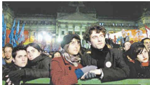
Imagen de la portada del 29/06/2010

Una lógica similar se observa en la portada del 29/06/2010, titulada “Música y voces, en apoyo al matrimonio gay”. Allí, un grupo reducido de personas -no una multitud desafiante como en la imagen aérea de la marcha opositora al proyecto- aparece fotografiado de noche, en plano medio y con composición simétrica frente al Congreso. La imagen evita planos cerrados, no resalta pancartas ni consignas, y muestra solo a parejas heterosexuales, que podrían interpretarse como asistentes al evento, aunque no se visibiliza ninguna inscripción política o simbólica. El acontecimiento se representa como una postal armónica, sin tensiones ni conflictividad. Nuevamente, los cuerpos presentes no son construidos como actores sociales con agencia discursiva, sino como figuras neutras, sin capacidad de intervención ni poder de decisión en la escena pública.