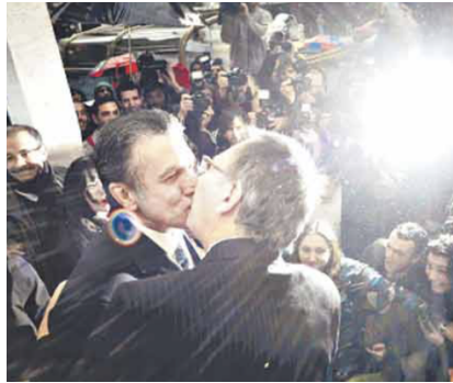
Imagen de la portada del 31/07/2010

En conjunto, las imágenes vinculadas al matrimonio igualitario en Clarín refuerzan una escena de lectura coherente con el contrato de lectura. Las imágenes no narran ni interpretan: documentan desde una distancia institucional. Así, se consolida una estrategia discursiva en la que lo visual estabiliza el acontecimiento dentro de los márgenes de lo informativo.