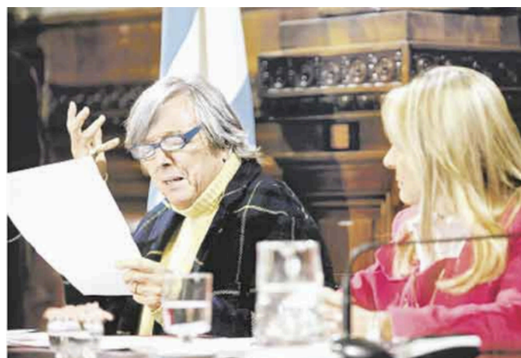
Imagen de la portada del 02/06/2010

El predominio del registro institucional se refuerza en portadas como la del 02/06/2010, donde se muestra a Pepe Cibrián Campoy leyendo en el Senado un discurso a favor del proyecto de ley de matrimonio igualitario. La imagen destaca el marco parlamentario, la sobriedad y formalidad del espacio. Lo performático de la intervención -un actor y director teatral pronunciando una defensa emotiva e interpeladora- queda neutralizado por el encuadre: la fotografía no intensifica el gesto, sino que lo estabiliza en clave institucional. La imagen opera entonces en una función testimonial, limitándose a registrar el acontecimiento sin enfatizar su dimensión disruptiva o expresiva. Está acompañada del título: “Un texto teatral a favor del matrimonio gay”, y en su bajada se afirma que sigue la discusión en el recinto. Este doble anclaje refuerza la operación de neutralización simbólica: el acontecimiento se estabiliza como parte del trámite legislativo.