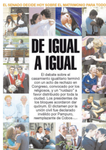
Imagen de tapa del 14/07/2010

Otro ejemplo de esta lógica visual se observa en la tapa del 14/07/2010, que acompaña el título “De igual a igual” con una serie de imágenes afectivas de parejas del mismo sexo. Aquí se activa una función categorizadora, en tanto las imágenes organizan una escena de igualdad, ternura y legitimidad, que dialoga directamente con el título. La escena visual no replica el contenido textual, sino que instala un clima interpretativo desde lo simbólico, intensificando la posición editorial del medio.