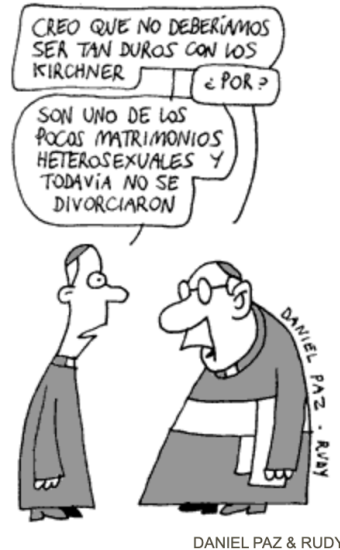
Chiste de tapa del 09/06/2010

contrato de lectura como huellas del enunciador: dispositivos que suponen un lector modelo capaz de decodificar estas claves humorísticas, compartiendo una comunidad de sentido que se reconoce en la crítica satírica al discurso conservador.