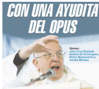
Imagen de tapa del 12/07/2010

simbólica con la función de categorización y señalamiento, transformando un rostro en emblema de un antagonismo político-cultural.