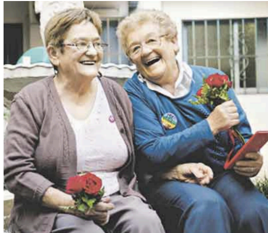
Imagen de la portada del 10/04/2010

El predominio del registro institucional se refuerza en portadas como la del 02/06/2010, donde se muestra a Pepe Cibrián Campoy leyendo en el Senado un discurso a favor del proyecto de ley de matrimonio igualitario. La imagen destaca el marco parlamentario, la sobriedad y formalidad del espacio. Lo performático de la intervención -un actor y director teatral pronunciando una defensa emotiva e interpeladora- queda neutralizado por el encuadre: la fotografía no intensifica el gesto, sino que lo estabiliza en clave institucional. La imagen opera entonces en una función testimonial, limitándose a registrar el acontecimiento sin enfatizar su dimensión disruptiva o expresiva. Está acompañada del título: “Un texto teatral a favor del matrimonio gay”, y en su bajada se afirma que sigue la discusión en el recinto. Este doble anclaje refuerza la operación de neutralización simbólica: el acontecimiento se estabiliza como parte del trámite legislativo.