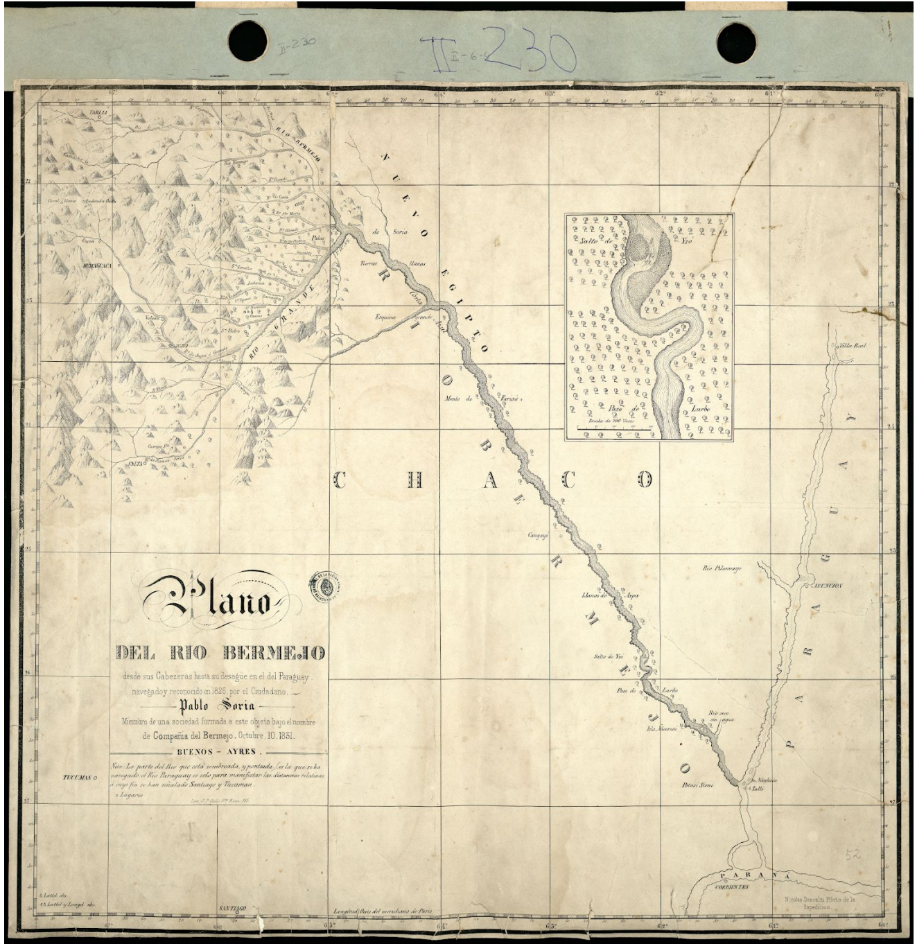
Figura 1: Plano del Río Bermejo, elaborado a partir del viaje realizado por Pablo Soria en 1826 (octubre de 1831). Archivo General de la Nación Argentina / MAP-II-230