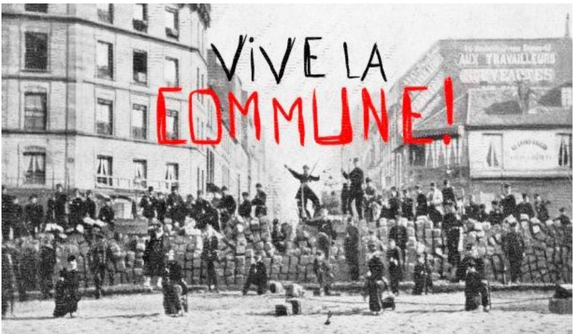
Fotografía 2 – Comuna de París (1871).