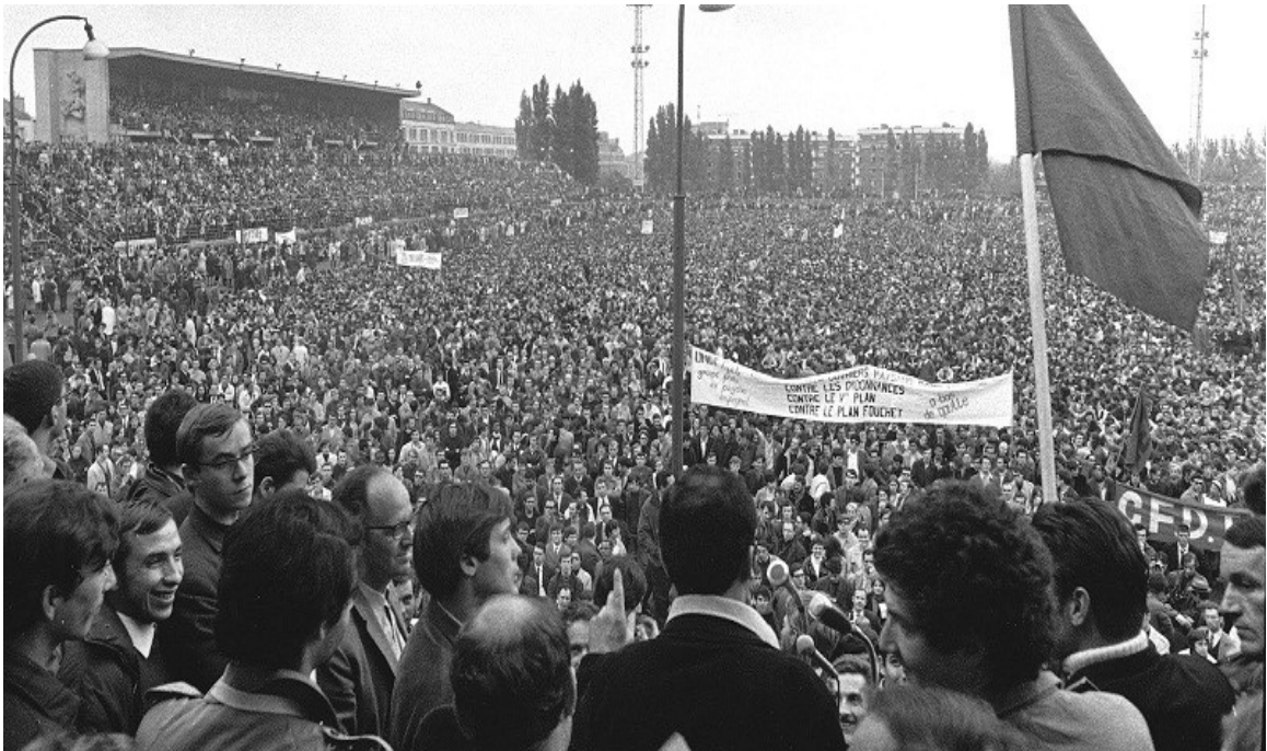
Fotografía 1 – Mayo Francés (1968).