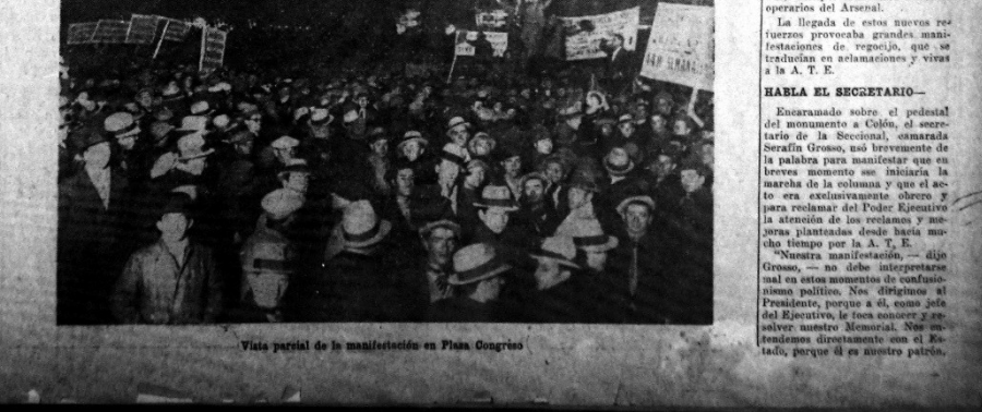
Vista parcial de la manifestación en Plaza Congreso

A esa hora, más o menos, se hicieron presentes algunos empleados de la Presidencia de la República, quienes manifestaron que el señor