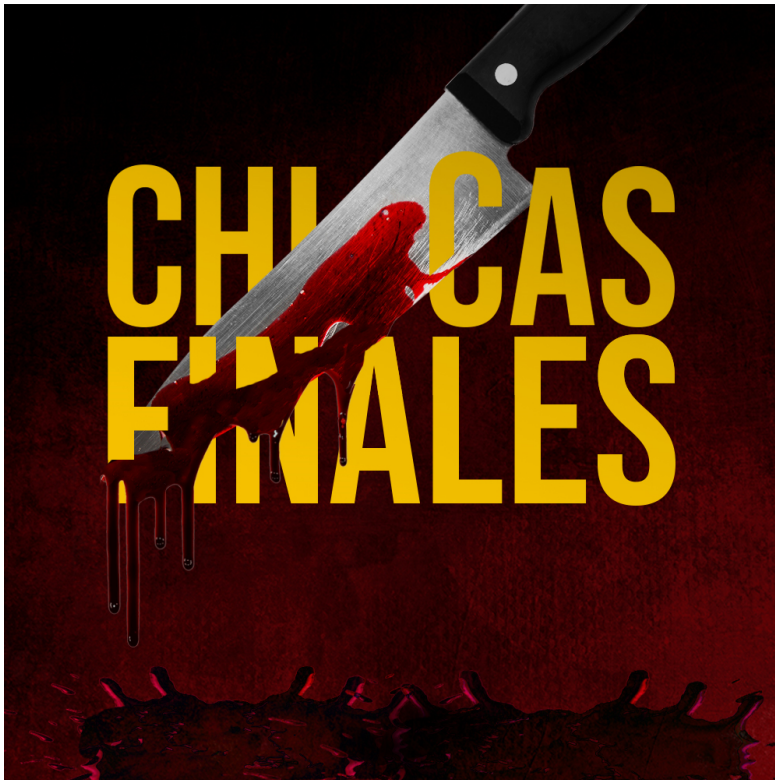
Portada general del podcast.