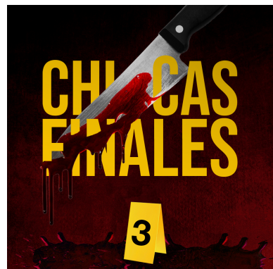
Portadas de cada uno de los capítulos.