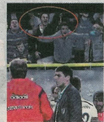
Gestos y cantos. Contra River.