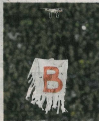
Mal gusto. Y pésimo momento.

Después de varios minutos en el aire, y hasta con un intento fallido del uruguayo Carlos Sánchez de derribarlo de un pelotazo, la pequeña nave se volvió al