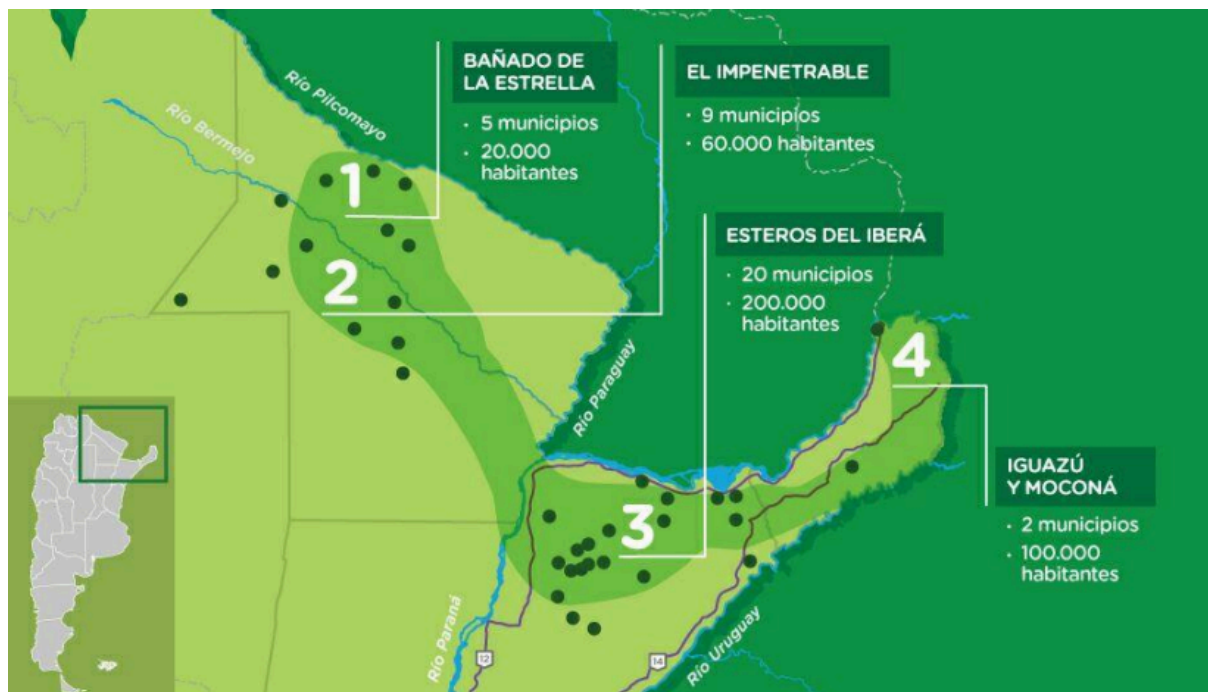
Figura 1. Corredor Ecoturístico del Litoral.

La creación del Parque Nacional El Impenetrable (PNEI) se concretó en el año 2014 mediante la sanción de la ley 26.996, pero fue a partir de 2011 cuando el asesinato del “último propietario de la estancia (territorio ocupado desde 1872), que organizaciones ambientalistas y la Administración de Parques Nacionales propusieron crear un parque nacional y fue la provincia del Chaco quien movilizó el aparato administrativo y legislativo para llevar adelante esta propuesta” (Barrios et al., 2021, p. 5). Luego de varios años de polémicas y disputas legales, la estancia La Fidelidad derivó en el terreno que hoy posee la reserva natural. Con una mirada regional, la creación del Parque Nacional El Impenetrable establece un gran paso para concretar el corredor ecoturístico del litoral, conformando la porción de área protegida más grande del norte argentino, contemplando entre otras, las ecorregiones de Iguazú (Misiones), Iberá (Corrientes), Jaaukanigás (Santa Fe) y Bañado de la Estrella (Formosa). En este sentido, según fuentes oficiales, se afirma que el objetivo de la conformación del Corredor Ecoturístico del Litoral es mejorar la calidad de vida de los habitantes mediante el turismo, “brindando herramientas que faciliten la participación de las comunidades, enfatizando la participación de emprendedores para que desarrollen proyectos exitosos, destinados al aprovechamiento y al uso sostenible del patrimonio natural y cultural de los territorios involucrados” 10 .