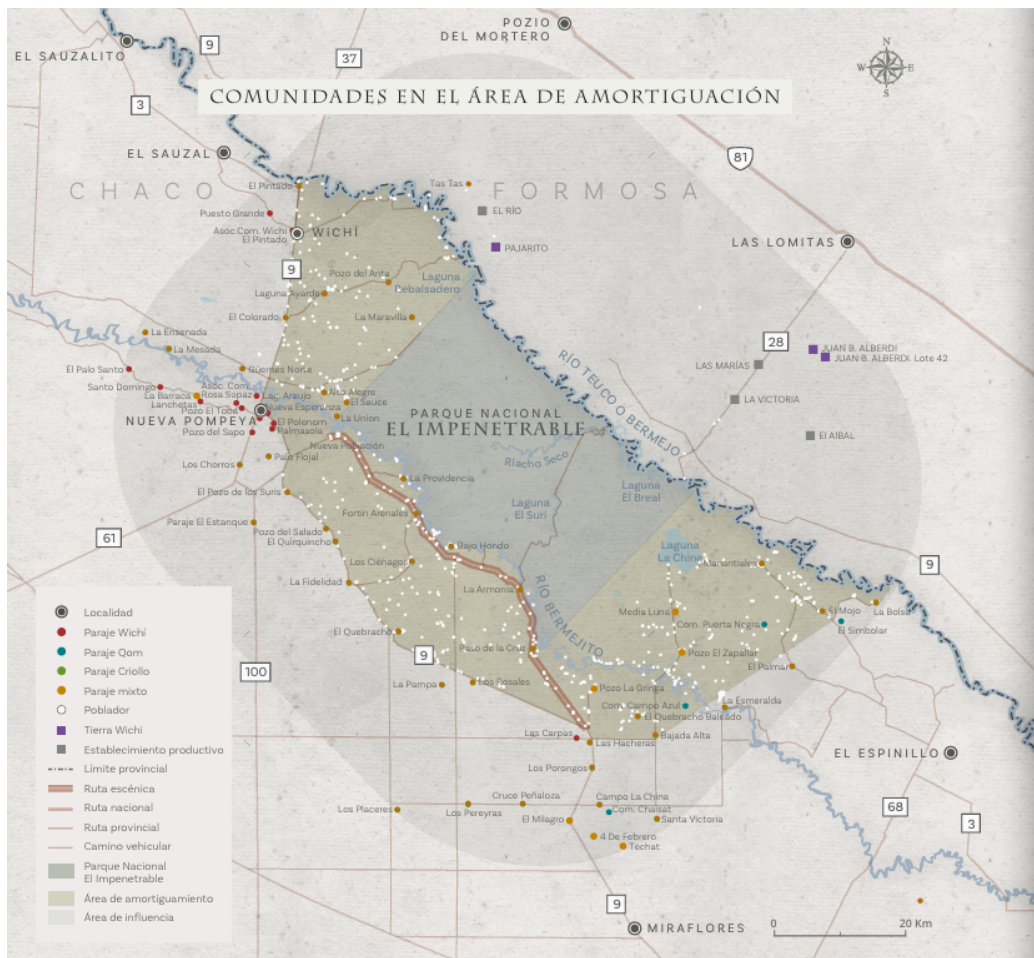
Figura 4. El Impenetrable: Un Territorio de Producción de Naturaleza en el Chaco Seco, 2024

Este contexto complejo, al cual aludimos más arriba, provocaba que hasta ahora las oportunidades para desarrollarse en la región sean muy pocas y que en consecuencia muchos de los jóvenes del paraje La Armonía (así como de El Impenetrable en general) opten por emigrar en busca de alternativas más prometedoras, generando un éxodo desde áreas rurales hacia entornos urbanos, principalmente en las grandes ciudades. Es por esto que -como veremos- se ha tornado imprescindible la planificación -entre otras- de un marco de políticas públicas conscientes del valor cultural de la región y predispuestas a la elaboración de alternativas genuinas para los pobladores de El Impenetrable.