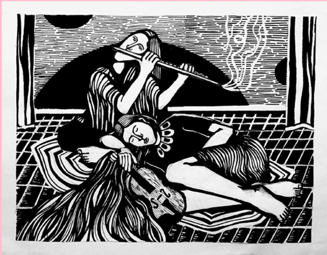
Boceto de Lina Paratore Cátedra de Grabado I com B TP N°1 2021