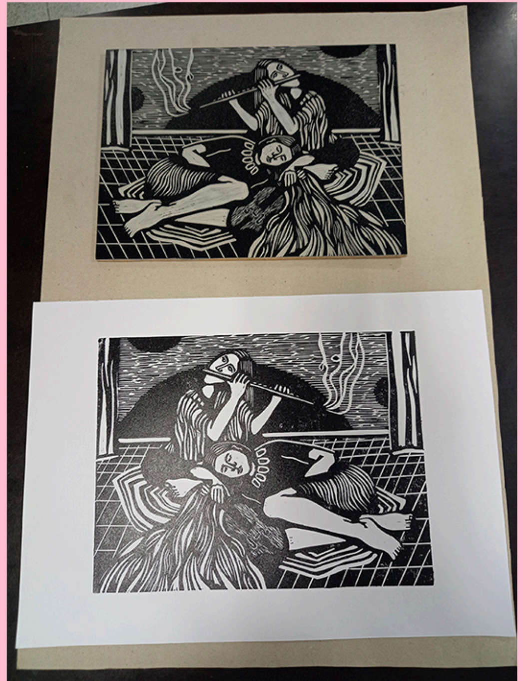
Xilografía sobre MDF Lina Paratore Cátedra de Grabado I com B TP N°1 2021