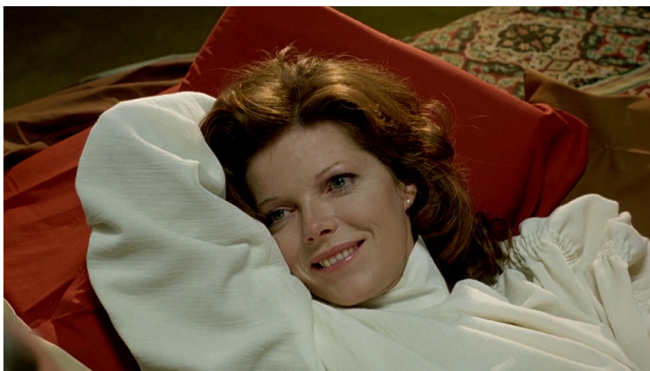
Fotograma de The Brood , de Cronenberg (1979)

A su vez, está imposibilitada de mantener un vínculo saludable con su hija Candice, por negativa y supuesto resguardo de Frank. Su belleza corporal resulta seductora para el psiquiatra quien, por momentos, deja entrever un deseo erótico por la protagonista femenina. Si bien en ciertos análisis sobre Nola se la define como una Venus matricial mutante que se enfurece como un gesto de rebelión y venganza 6 , en general en este film se resalta su costado frágil, sufriente y enfermizo.