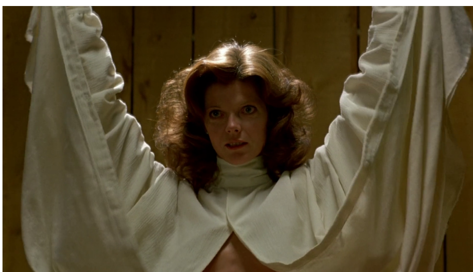
Fotograma de The Brood , de Cronenberg (1979)

Frank dialoga con el Dr. Raglan, quien le revela el secreto de los niños que viven en el ático y que tienen prisionera a Candice. Los pequeños, que encarnarían según las explicaciones médicas el odio que siente Nola hacia sus padres, asesinan también al psiquiatra. Hacia el final Frank habla con Nola, quien le pregunta si él está listo para aceptarla y al abrir su bata blanca exhibe un útero externo en cuyo interior yace un feto, extraído por la propia mujer.