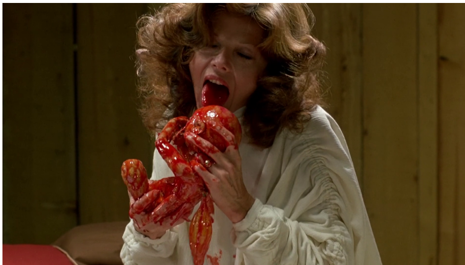
Fotograma de The Brood , de Cronenberg (1979)