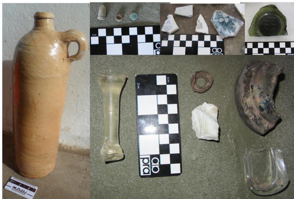
Figura 3. Restos materiales recuperados en el terreno próximo a las ruinas de la casa de Rómulo Franco. Una de las botellas de ginebra holandesa, metal, vidrio y loza, entre otros elementos.

Con respecto a otros elementos recuperados sobre el terreno, actualmente depositados en la sala de interpretación de la isla, deben mencionarse la base de una botella de vidrio verde gruesa; un fragmento de asa similar a las botellas de gres mencionadas previamente; ocho fragmentos de base, cuello y cuerpo de pequeñas botellas de g color crema, doce fragmentos de loza inglesa correspondiente a cuatro tipos distintos (dos del tipo azul sobre blanco, uno verde sobre blanco y otro rojo oscuro sobre blanco), un frasco de porcelana incompleto, un cuello de frasco de porcelana; dos fragmentos de vidrio grabado con diseño floral, un fragmento de cuello de vidrio alargado; entre otros restos vítreos transparentes, azules y violetas. También se recuperaron elementos de metal, como un dedal, arandelas o aros, balas y casquillos de proyectil (Figura 3). Con respecto a los fragmentos de botellas de gres monocromas lisas color crema, corresponden a los envases de cerveza de forma sinusoidal que circularon a partir de la segunda mitad del siglo XIX, en uno de ellos se alcanza a observar parte de un sello circular en el que se observan las letras “NEDY”, las cuáles podrían corresponder a la marca inglesa Kennedy de la ciudad de Glasgow, cuya fábrica funcionó entre 1866 y 1929 (Schávelzon, 1991; Bagaloni y Martí, 2013).