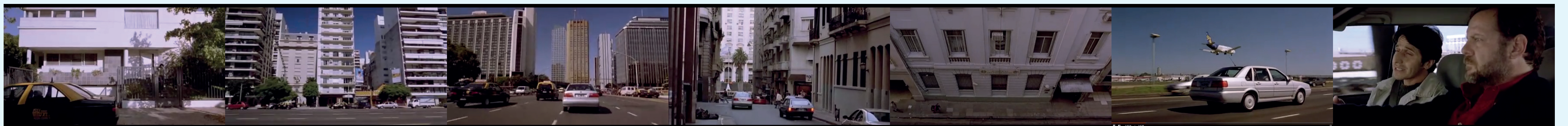
• “Tiempo de Valientes”, Damián Szifron.