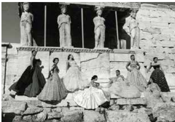
Figura 3: Dior en la Acrópolis de Atenas. Colección 1951.

Esta distinción en la igualdad, la individualidad que se funde en la pluralidad de lo femenino, se aprecia igualmente en las cariátides del Erecteion de Atenas, otro grupo de muchachas atenienses petrificadas para sustituir a las columnas del porche del templo más peculiar de la Acrópolis. También ellas, que fueron denominadas kórai desde la Antigüedad, de una manera menos variada mantienen una cierta individualización. Aparentemente iguales, sus peplos áticos, sus peinados y su movimiento es diferente en todas ellas, volviendo a convertirlas en un desfile de modelos de una misma colección, pero en distintas versiones. Este matiz posiblemente lo intuyó Christian Dior cuando, para presentar su colección en 1951, fotografió a sus modelos, todas ellas diferentes, pero todas vestidas de noche bajo el pórtico de las cariátides. Estas imágenes de mujeres a la moda de la Antigüedad -tanto las kórai arcaicas como las cariátides clásicas- muestran la esencial tensión entre la diferencia y la uniformidad que la moda entraña, la necesidad de mostrar la individualidad a través de la composición de la propia imagen y a la vez la inevitabilidad de vestir “lo que se lleva”, de adecuarse a una propuesta estética que debe ajustarse a unos parámetros que faciliten la integración en la colectividad.