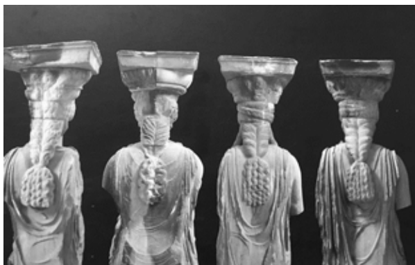
Figura 2: Vista posterior de las cuatro cariátides del Museo de la Acrópolis

Esta distinción en la igualdad, la individualidad que se funde en la pluralidad de lo femenino, se aprecia igualmente en las cariátides del Erecteion de Atenas, otro grupo de muchachas atenienses petrificadas para sustituir a las columnas del porche del templo más peculiar de la Acrópolis. También ellas, que fueron denominadas kórai desde la Antigüedad, de una manera menos variada mantienen una cierta individualización. Aparentemente iguales, sus peplos áticos, sus peinados y su movimiento es diferente en todas ellas, volviendo a convertirlas en un desfile de modelos de una misma colección, pero en distintas versiones. Este matiz posiblemente lo intuyó Christian Dior cuando, para presentar su colección en 1951, fotografió a sus modelos, todas ellas diferentes, pero todas vestidas de noche bajo el pórtico de las cariátides. Estas imágenes de mujeres a la moda de la Antigüedad -tanto las kórai arcaicas como las cariátides clásicas- muestran la esencial tensión entre la diferencia y la uniformidad que la moda entraña, la necesidad de mostrar la individualidad a través de la composición de la propia imagen y a la vez la inevitabilidad de vestir “lo que se lleva”, de adecuarse a una propuesta estética que debe ajustarse a unos parámetros que faciliten la integración en la colectividad.