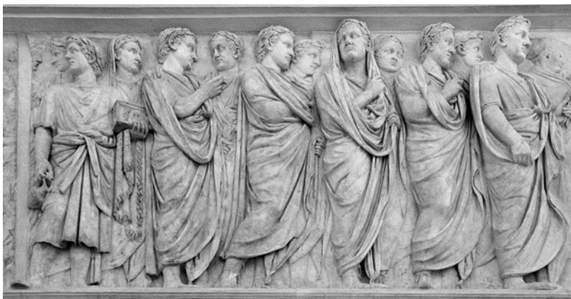
Figura 4: Relieve del Ara Pacis Augustae.

El monumento se convierte así en el escaparate de la moda romana del momento, una moda que implica una uniformidad que en otros momentos de la historia se ha vuelto a producir, por ejemplo, en la imposición de los uniformes en la China de Mao; en esa ocasión, por el contrario, con consecuencias nefastas para la estética de todo un pueblo. La uniformidad se convierte sin duda en una marca estética importante en toda imposición política y en el necesario reconocimiento del grupo.