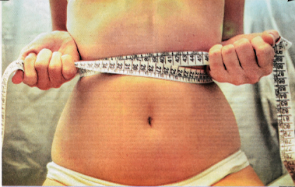
La imagen de una mujer siempre estuvo muy determinada por la presión social, que en algunos casos toma la forma de una sardina. En la actualidad, la presión es estar delgada a todo costo.