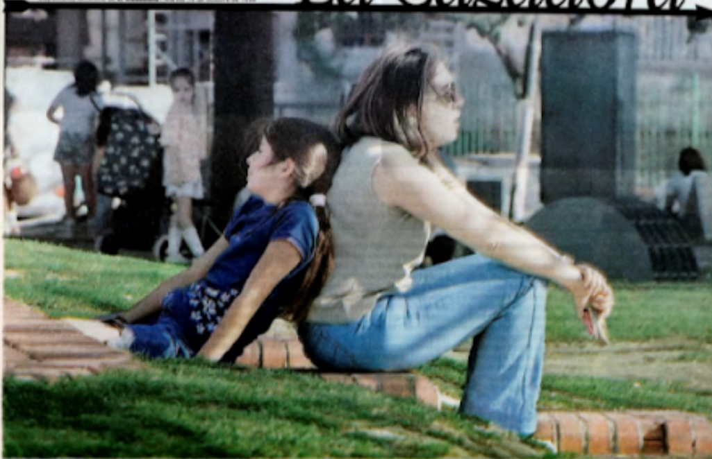
En los últimos años, muchas mujeres han tomado un camino que las lleva a renunciar a la exclusividad del rol de la maternidad para ir en busca de otros...