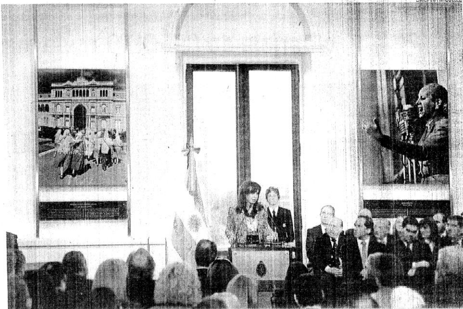
SALON DE LA MUJER. LA PRESIDENTA EN LA PRESENTACION DEL PROYECTO DE LEY DE COMUNICACION AUDIOVISUAL, AYER, EN LA CASA ROSADA

Desde buena parte de la oposición salieron ayer mismo a criticar la propuesta haciendo hincapié, sobre todo, en el momento elegido por la Casa Rosada para enviar