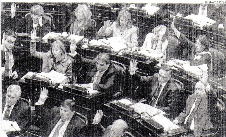
DEFINICIÓN. EL MOMENTO EN QUE LOS SENADORES VOTABAN, ESTA MADRUGADA, LA POLEMICA LEY QUE IMPULSO EL KIRCHNERISMO TRAS 16 HORAS DE DEBATE.

La larga sesión sirvió para que los senadores hicieran extensos relatos sobre cómo los suelen tratar los medios, pese a que el tema en discusión era la regulación del espacio radioeléctrico y no las opiniones del periodismo independiente. Con todo, de la superposición de argumentaciones a favor y en contra, pudo rescatarse un puñado de ejes que vertebraron