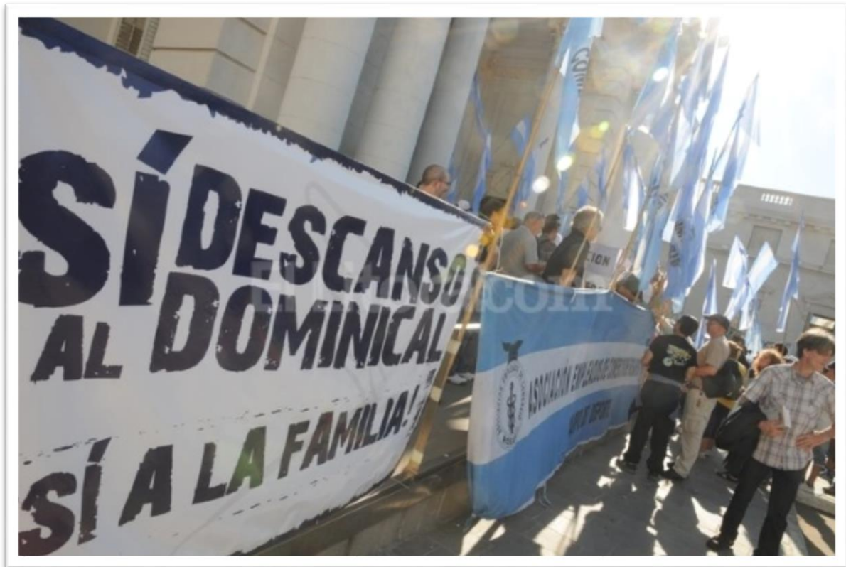
Jueves 30 de octubre de 2014. Representantes de la AEC se manifiestan en la puerta de la Legislatura provincial. [Fotografía de Luis Cetraro]. (Santa Fe, 2014). El Litoral.

mantuvieron hasta esa hora inactivo al recinto, y muy activo a su entorno. Según describió ese día el diario santafesino El Litoral , los pasillos, los despachos y la sala de reuniones de la Presidencia encerraron negociaciones tensas y dejaron escapar todo tipo de versiones periodísticas ( El Litoral , 2014). Mientras tanto, afuera se escucharon los bombos del gremio mercantil que reclamaban con pancartas: “Sí al descanso dominical, sí a la familia”.