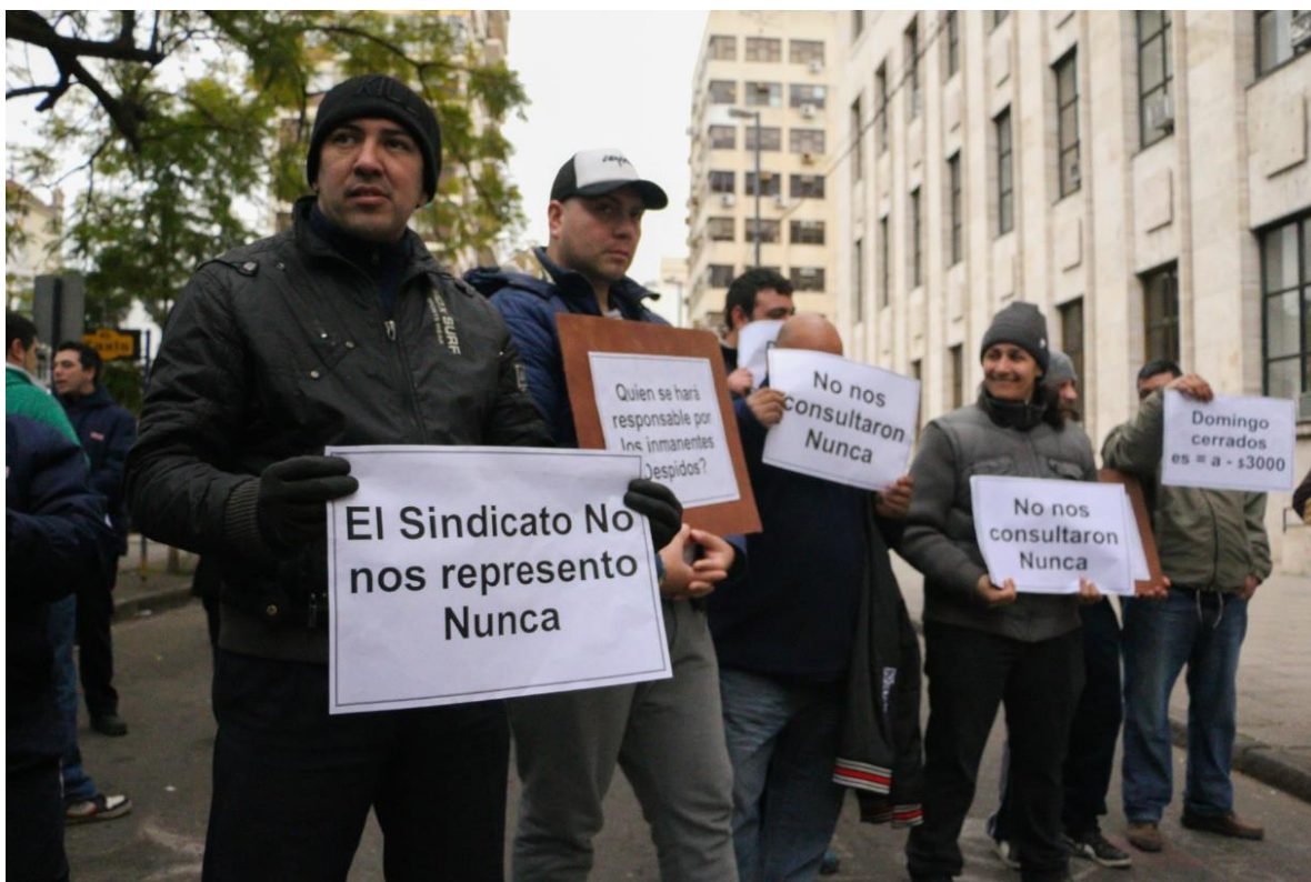
Lunes 18 de julio de 2016. Trabajadores de supermercados protestan frente a los Tribunales de Rosario.