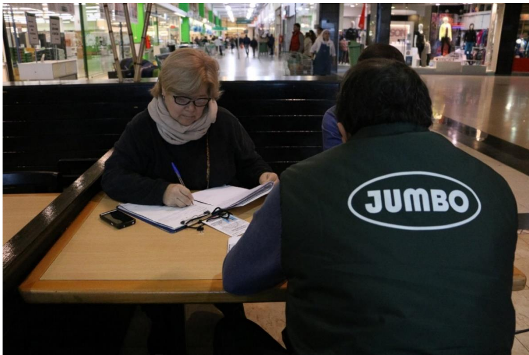
Domingo 3 de julio de 2016. Inspectora del Ministerio de Producción santafesino –órgano de aplicación y control de la ley 13.441– labra un acta al supermercado Jumbo que violó la prohibición y abrió. [Fotografía de Alan Monzón]. (Rosario, 2016). Archivo Descanso dominical. Rosario3.com