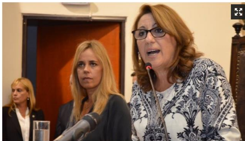
Fein habló de la polémica ordenanza que se aprobó en el Concejo.