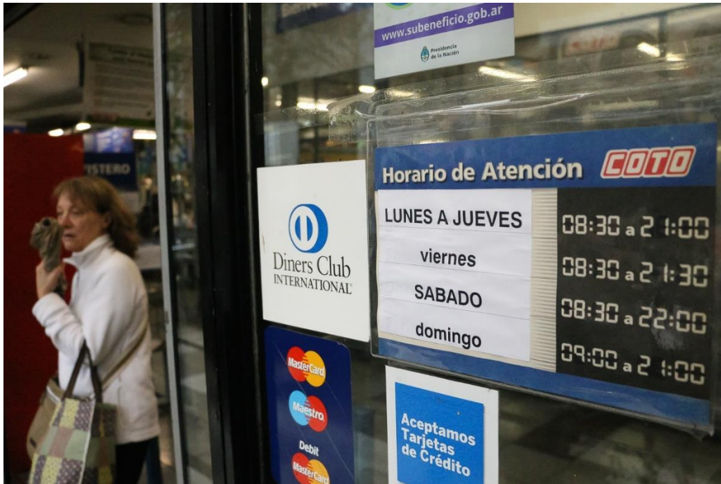
Domingo 3 de julio de 2016. Coto a puertas abiertas en el “debut” del descanso/cierre dominical. [Fotografía de Alan Monzón]. (Rosario, 2016). Archivo Descanso dominical. Rosario3.com