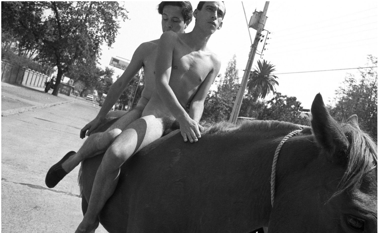
FIG.11. Yeguas del Apocalipsis, Refundación de la Universidad de Chile , Santiago de Chile, 1988.

En otra de sus obras, Que no muera el sexo bajo los puentes (1989) Las Yeguas posan de manera provocativa sentadxs sobre una cama. Esta fotografía fue publicada junto a otras tres en la revista Trauko publicada en agosto de 1989. Acompañando a las imágenes se publica una carta escrita por Las Yeguas y dirigida “a mi querido niño” en la que relatan un suceso en el que intentan interrumpir en un acto del partido comunista. Sostienen Las Yeguas (1989) al respecto: “¡En el partido no hay maricones! nos gritaron casi con miedo, dos homosexuales contra un estadio, (...) el lienzo que no pudimos abrir decía: “homosexuales por el cambio” como yeguas troykas, y no tenía ninguna falta ORTOgráfica, pero no lo entendieron... ¿cachay?” (Yeguas del apocalipsis en Revista Trauko, 1989).