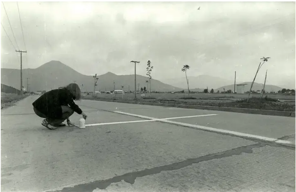
FIG. 15. Lotty Rosenfeld, Una milla de cruces sobre el pavimento , 1979.

La artista convierte su obra en un gesto de insumisión a lo impuesto, a la vez posible de trasladar hacia los demás sistemas de poder (Richard, 1986), el acto de transgredir un sistema que delimita la circulación, en un contexto marcado por la prohibición, se convierte en un modo específico de interrogar los mandatos que ordenan la convivencia social. En este sentido, la obra surge como desacato e interpela la actitud irreflexiva de los ciudadanos al obedecer reglas constantemente.