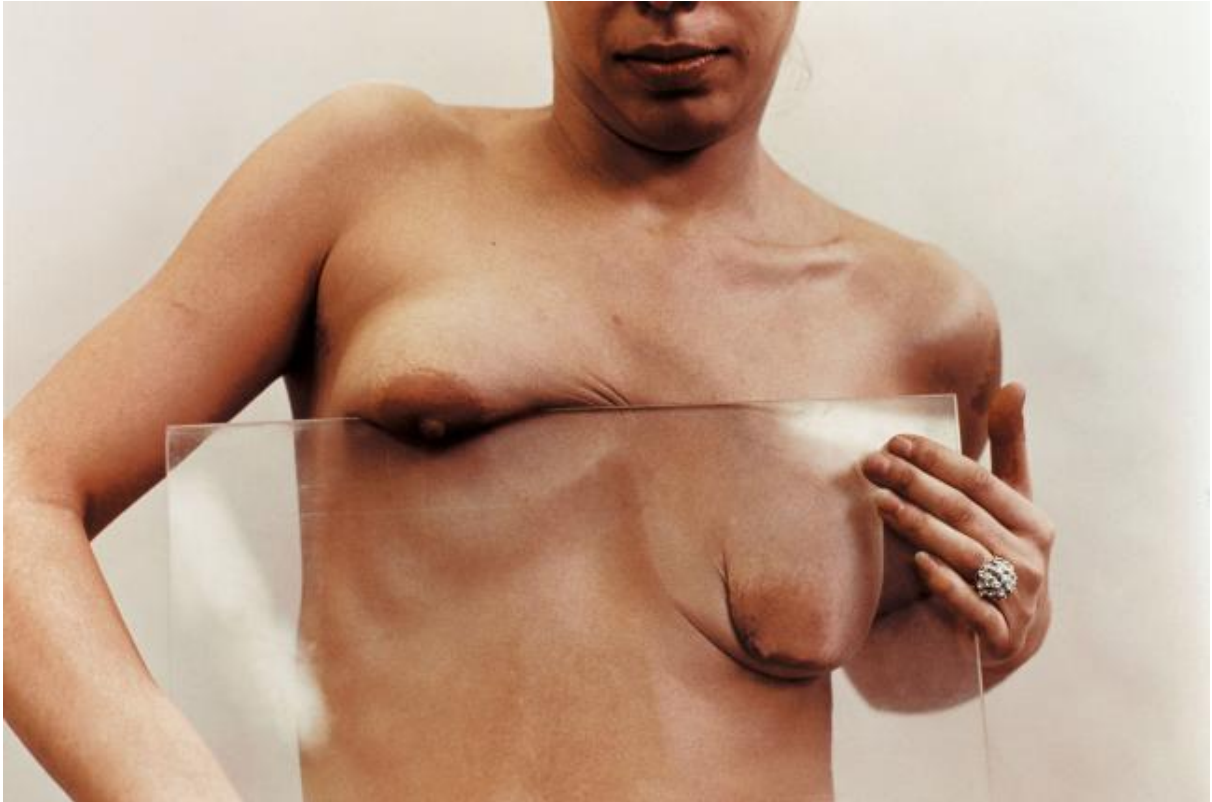
FIG. 2. Ana Mendieta, Glass on body , 1972.

Durante el mismo año (1972) Mendieta realiza como parte de la finalización de sus estudios en el curso Intermedia Studies Program de la escuela de arte de la universidad de Iowa, la acción Facial Hair Transplant (FIG. 3), mediante la cual pide a un compañero que se quitara su propia barba para poder colocarla en su rostro. En las fotografías que registran la acción se puede ver cómo ambos van realizando ese pasaje de vello facial. Morty Sklar, su compañero, va cortando poco a poco su barba, al tiempo que Mendieta recoge y va pegando pedazos de esos vellos en su propio rostro, hasta convertirse en una mujer monstruosa, que porta una barba trasplantada. Mediante esa acción la artista problematiza las convenciones sociales que enmarcan y delimitan el género como algo natural y necesario, mostrando el artificio del mismo, su construcción. Su rostro muta al portar la barba de su compañero,