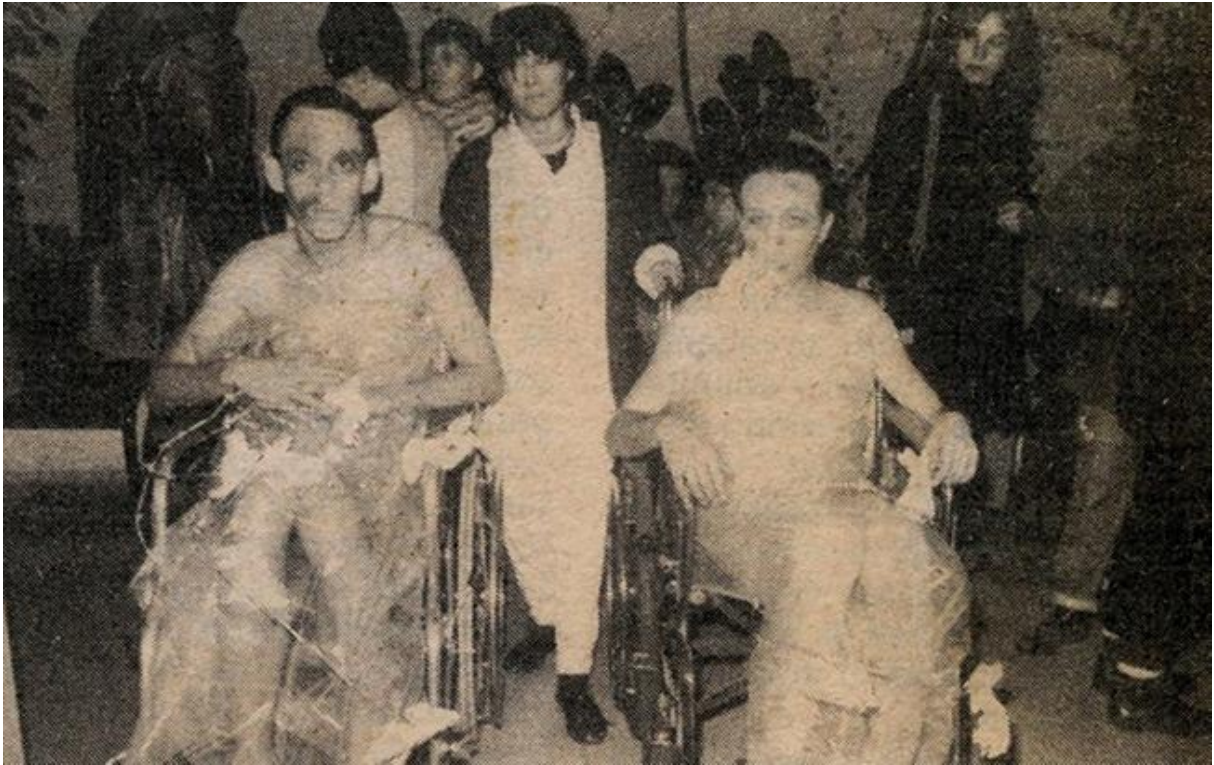
FIG. 13. Yeguas del Apocalipsis, Intervención en la exposición Cuerpos Contingentes , Galería de Arte CESoc, Santiago de Chile, Registro de Leonora Calderón, 1990.

Retomando los lineamientos planteados anteriormente, es posible pensar cómo en las obras de Las Yeguas se entrecruzan la sexualidad, el arte y la política y a su vez este recorrido lo realizan sin prestar atención a las instituciones y sin responder demasiado a las catalogaciones entre arte oficial, arte contestatario o cultura under. Por fuera de los discursos que rondan entre los espacios artísticos oficiales, Las Yeguas desplegaron una nueva sensibilidad que dejaba ver ciertos deslices en el arte, en el que no eran tan importantes las lealtades discursivas. Sostiene al respecto Richard (2018):