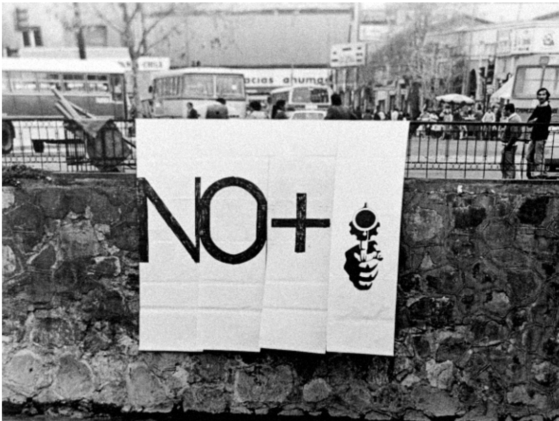
FIG.18. Grupo CADA, Acción NO+ , Santiago de Chile, 1983.

lenguaje, el grupo CADA logró trastocar la institución artística, citando a las vanguardias en la fusión arte/vida, lo que implicaba denunciar la institucionalidad del arte como espacio cerrado, y en contraposición a aquel cierre, aparece el espacio público como entorno abierto, donde la obra se convierte en situación, y donde lo artístico se fusiona con lo cotidiano. Tanto en las acciones Ay Sudamérica (1982) como en NO + (1983), se interrumpe la ciudad y la obra pasa a completarse en relación con lxs otrxs, con el transeúnte que ve los carteles colgando, o recibe los volantes y los lee. Es decir, la ciudad se vuelve soporte de las acciones, y la comunidad en su totalidad es concebida como partícipe de la obra. Son acciones que seducen desde la convocatoria a ser parte, no como espectadores sino desde una presencia que acciona y por lo tanto, que cambia el ritmo de la cotidianeidad.