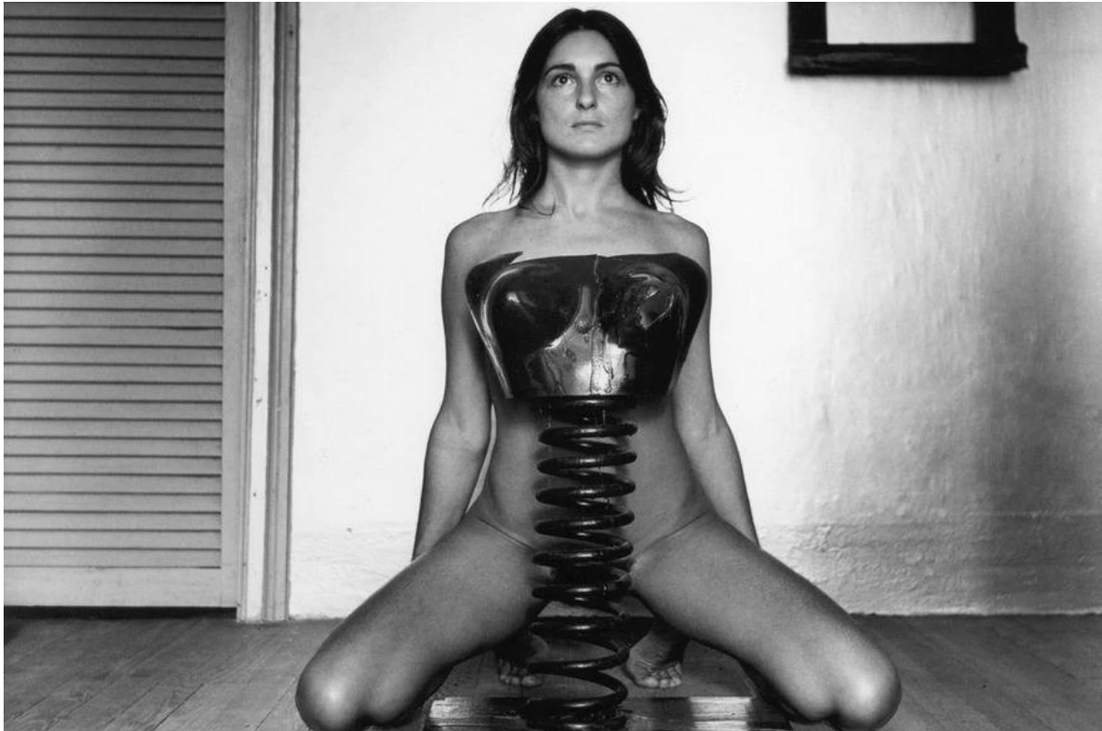
FIG. 7. Liliana Maresca, Sin título , de la serie Liliana Maresca junto a su obra , Fotografía de Marcos López, 1983.

En otra de las fotografías (FIG. 7) Maresca posa detrás de una estructura de hierro y se encuentra semisentada con las rodillas apoyadas sobre el piso. La estructura que se ubica por delante de su cuerpo tiene la forma de un resorte que sigue la línea de su torso, unida a otra estructura que simula un torso femenino. El cuerpo de la artista se encuentra por detrás de la misma, a su vez su forma acompaña las partes de su cuerpo, en una especie de fusión con el mismo. Los senos ficticios de la estructura encajan con la silueta de Maresca, dejando ver cierta tensión entre el objeto y el cuerpo. Esa estructura dura podría hacer alusión a cómo el cuerpo de la mujer es mirado, cómo la construcción social sobre lo femenino condiciona la vivencia de las corporalidades. Maresca posa con su cuerpo desnudo pero esa desnudez es vista desde un lugar de tensión, se convierte en un cuerpo-estructura, cuerpo-robot que deja ver el artificio que condiciona la mirada sobre las mujeres y la construcción de la subjetividad. En este sentido, la estructura de hierro funciona como símbolo opresor de su corporalidad.