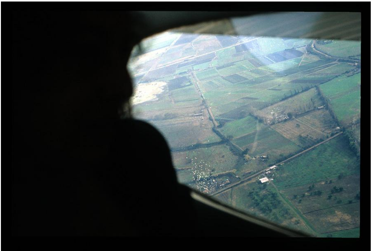
FIG. 16. Grupo CADA, Ay sudamérica , 1981.

aquella intervención: sobre ella caen los volantes, y serían los transeúntes de Santiago quienes “completan” la acción tomando los papeles y leyendo las consignas. Si aquellos volantes hubieran caído en una zona despejada, donde no viviera nadie ¿tendría el mismo efecto? Pienso que probablemente no, ya que la reflexión que contienen los mismos es en torno a la ampliación de los espacios de vida, pensando en el arte como complemento o como expansión de la misma, y fue diagramada para interpelar a lxs ciudadanos. Plantear la idea de ampliar los espacios de vida en un contexto de dictadura habla de un particular vínculo entre arte y política. Los volantes cayendo por el cielo se transforman en una imagen poética, el espacio aéreo se torna imposible de censurar debido a su inmensidad y a la volatilidad de los papeles, que se dispersan por el cielo y pasan a formar parte del paisaje urbano.