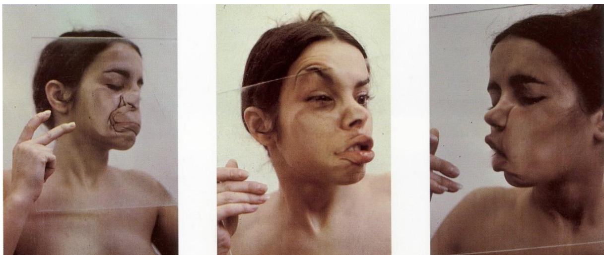
FIG. 1. Ana Mendieta, Glass on body , 1972.

En Glass on body (1972) hay un corrimiento del lugar de seducción del cuerpo femenino, el desnudo aparece mediado por un elemento que oprime y deforma. Sostiene Ruido (2002) al respecto: “La búsqueda de un cuerpo con existencia propia, no asimilable a la paralizante mirada cosificadora conformada por el deseo masculino es una constante en el trabajo de Mendieta y de casi todas las artistas feministas en esos años” (p. 19).