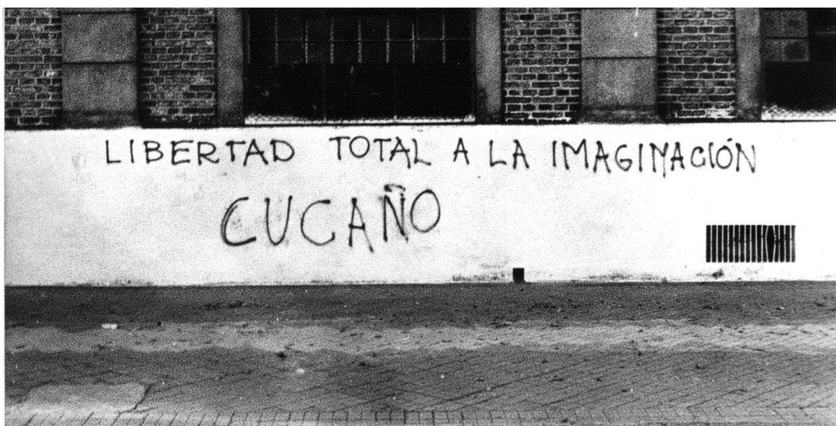
FIG. 20. Grupo de Arte Experimental Cucaño, Libertad total a la imaginación .

El final de aquel misterio que se revelaría al finalizar Las brujas (1981) se llevó a cabo mediante una acción que aludía a un cortejo fúnebre en el que lxs artistas se trasladaron desde el centro de la ciudad hasta la confitería VIP de Rosario. En aquel lugar se realizó una intervención en la que, desde la oralidad se referían a aquel ataúd como una generación muerta. Aquellas personas que se mostraban conformados con la situación política del país u obedientes, eran nombrados como cadáveres en este hecho artístico. Lxs miembros de Cucaño eran de una generación más joven que la que había sufrido la mayor violencia por parte de la dictadura, sin embargo en Las Brujas , aparecía un llamado hacia la juventud a retornar a la rebeldía. Sostiene La Rocca (2012) al respecto: “Con Las Brujas, se evocaba el emblema de la subversión para la modernidad, aquel que desde fines de la década del ‘60 en diferentes puntos del planeta, había encarnado por antonomasia la juventud” (p. 14).