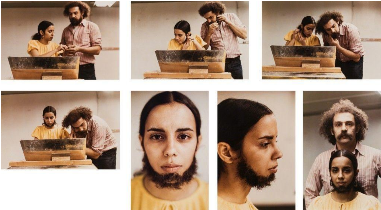
FIG. 3. Ana Mendieta, Facial Hair Transplant , 1972.

corriéndose así de los modelos de belleza femenina y a su vez abre sentidos sobre la autopercepción sobre el cuerpo, permitiéndose jugar de manera crítica con la identificación.