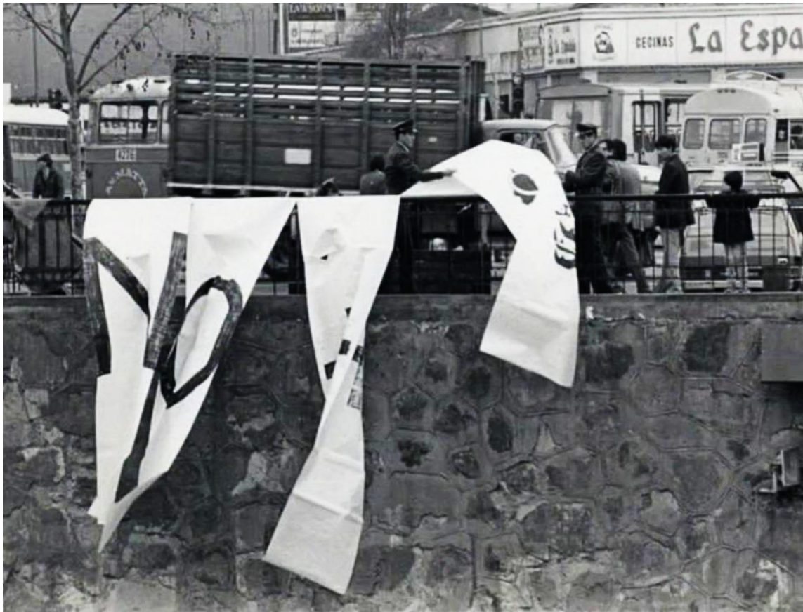
FIG.19. Grupo CADA, Acción NO+, Santiago de Chile. 1983.

En las obras analizadas se visibiliza una ciudad que habla, por pedazos, en fragmentos, dispersa en miles de volantes, o escrita en las paredes. El espacio público violentado por la vigilancia y la represión condiciona el accionar, y en este contexto, el CADA crea intersticios, permite vislumbrar fisuras desde donde dar aire a la represión, desde donde pensar la propia realidad y a los ciudadanos con sus respectivas demandas. Por otro lado, en ambas obras el registro de video y la fotografía de las acciones se convierten en archivo y a su vez, en obra. En estos recortes se reconstruye la memoria chilena desde los fragmentos de un cuerpo colectivo que interrumpe en la vía pública, atravesada por el riesgo, y permiten, mediante el archivo, inscribir esos cuerpos en el repertorio de la resistencia a la vigilancia y la violencia. Esa inscripción a su vez deja ver estas historias que se agenciaron desde la precariedad de la performance , noción que habilita, retomando a Fabião (2019), la creación en dirección