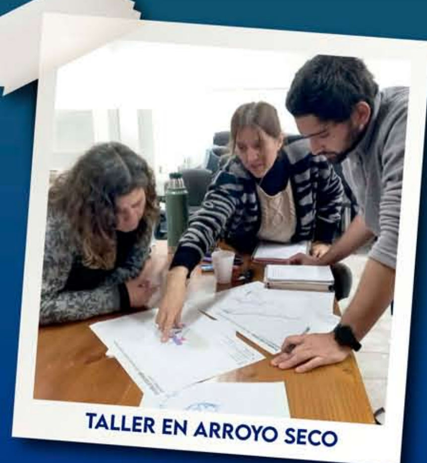
TALLER EN ARROYO SECO