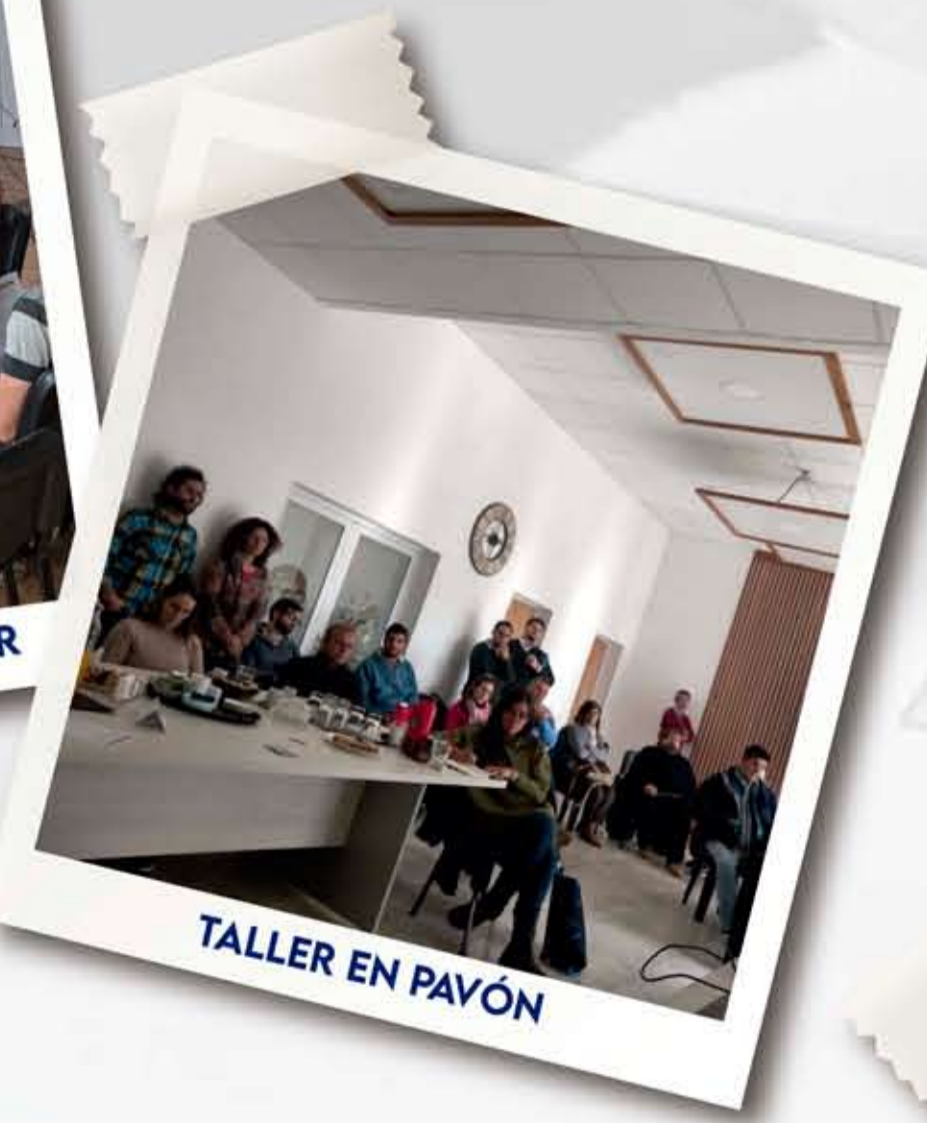
TALLER EN PAVÓN