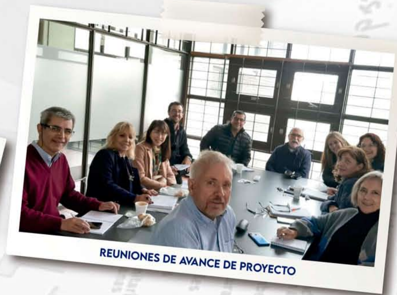
REUNIONES DE AVANCE DE PROYECTO