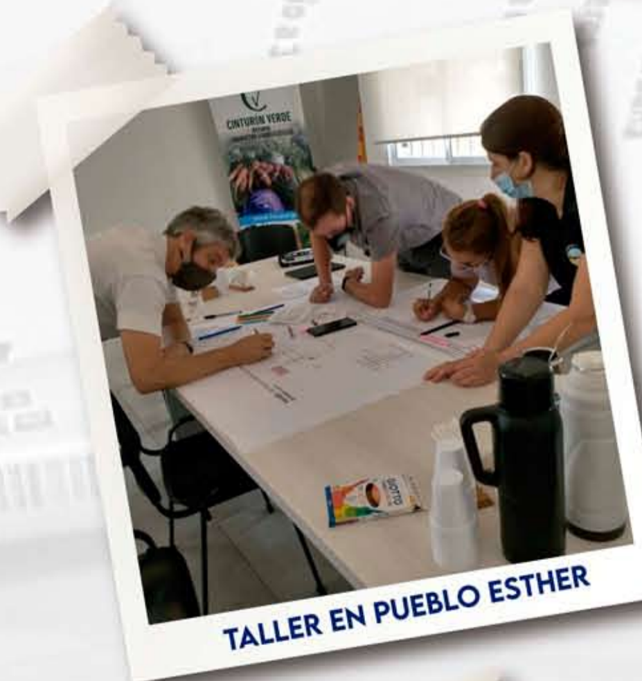
TALLER EN PUEBLO ESTHER