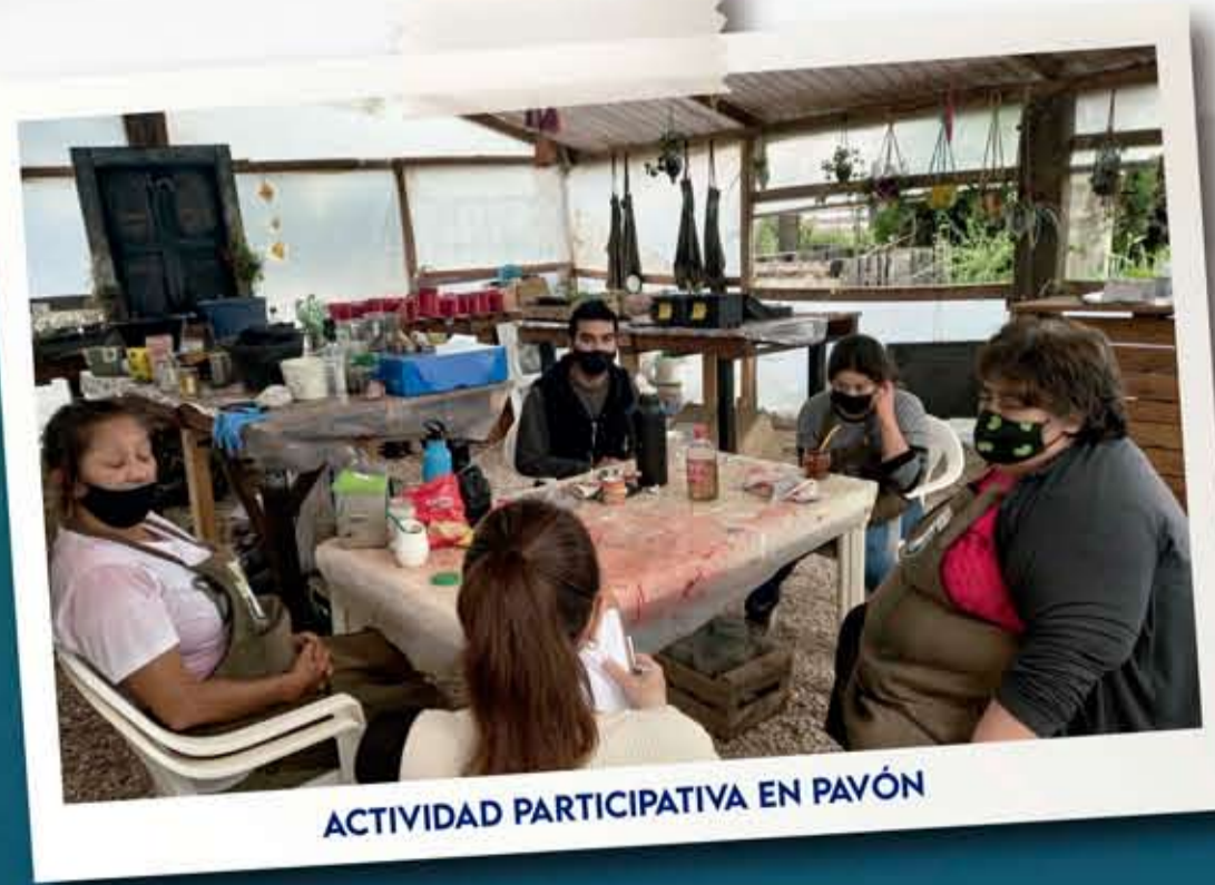
ACTIVIDAD PARTICIPATIVA EN PAVÓN