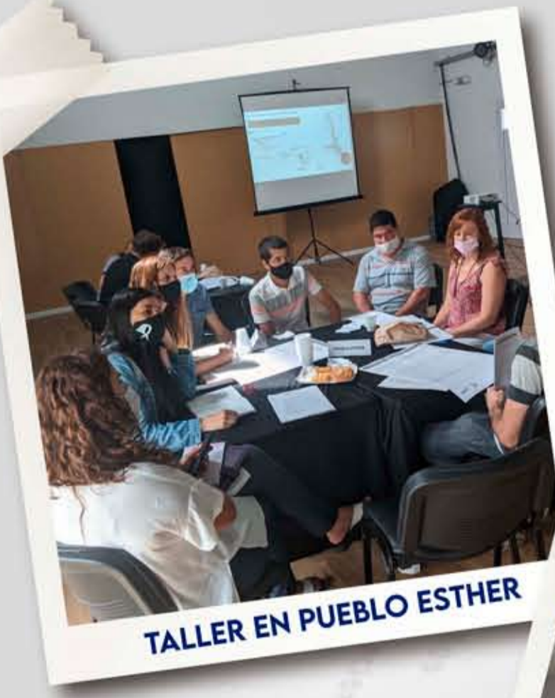
TALLER EN PUEBLO ESTHER