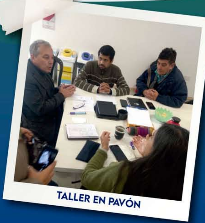
TALLER EN PAVÓN

ACTIVIDADES PARTICIPATIVAS con técnicos MUNICIPALES