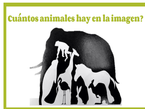
Pregunta del Circuito bibliotecario

En general, se puede decir que el mayor inconveniente fue la conectividad. La saturación en las redes hacía que se tuviera una mala señal por parte de los participantes, incluso del capacitador, siendo una costumbre la solicitud que se apaguen las cámaras.