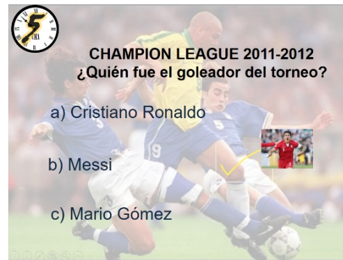
Preguntas concurso Intercolleras