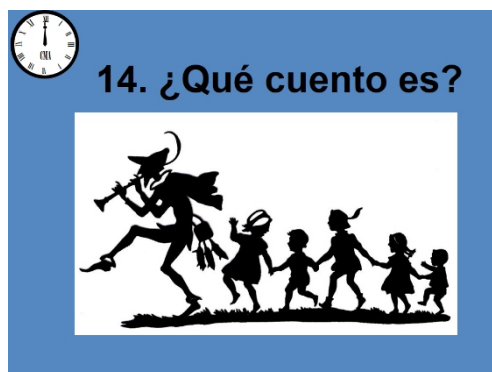
Litureteando: adivinando el cuento a través de sombras