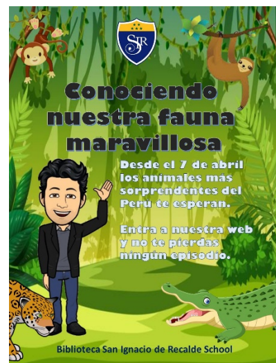
Afiche Conociendo Nuestra fauna maravillosa