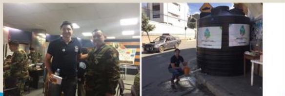
Figura 5. Centro de coordinación de distribución de agua potable.