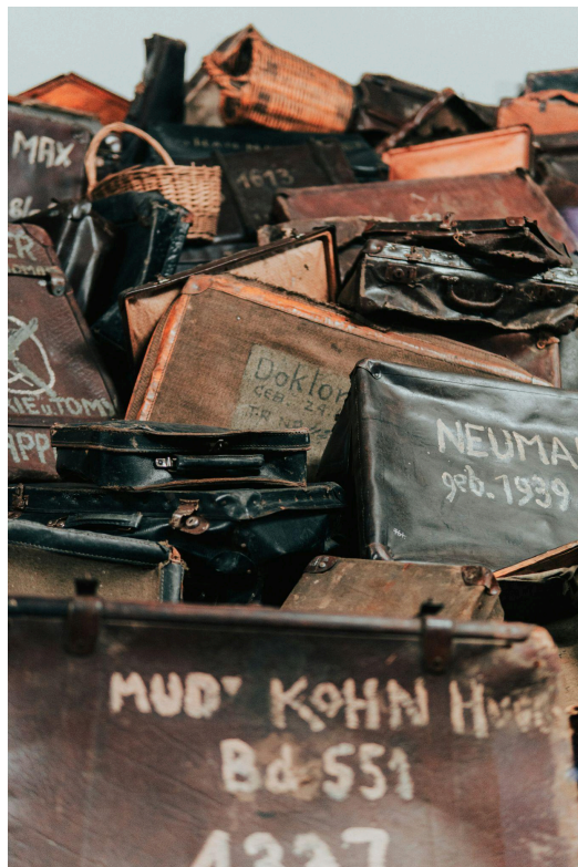
Emer, J. C. (2019). Sin título. [Imagen].