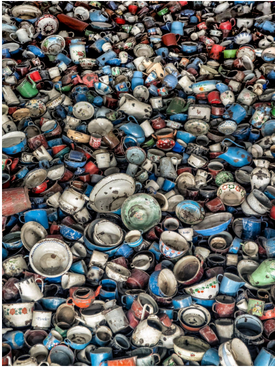
Warby, W. (2023). "Pots and Pans at Auschwitz". [Imagen].

Fuente: https://unsplash.com/photos/a-large-pile-of-old-and-used-cups-and-saucers-tQF3kYU80hQ