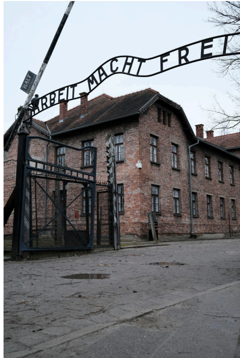
Dauer, S. (2023) “Entrada al campo de concentración Auschwitz-Birkenau” [Imagen]

Imágenes de la parte exterior del “Museo Estatal Auschwitz-Birkenau”.