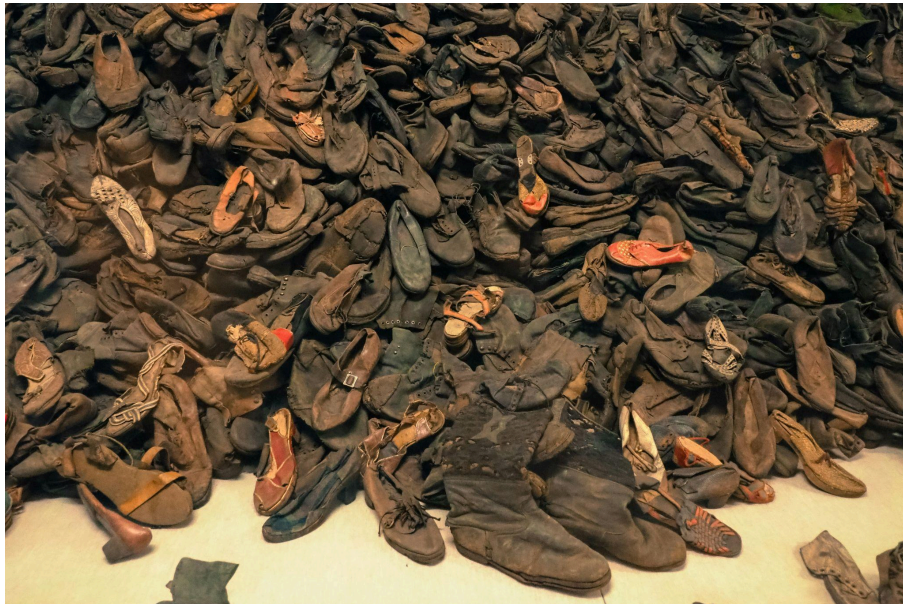
Stawinska, L. (2023) “Memorial and Muzeum Auschwitz - Birkenau Former German Nazi Concentration Extermination”. [Imagen]