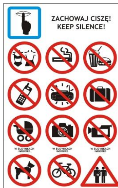
Figura 2: “Reglas y objetos prohibidos durante la visita”. [Imagen].

En los últimos años, un gran número de personas ha visitado los campos con propósitos educativos. Los visitantes suelen realizar un viaje de una hora desde Cracovia hasta Oswiecim para comenzar el recorrido, ya sea el tour estándar para grupos o una visita independiente. La admisión al lugar es gratuita, sin embargo existen tarifas para realizar los tours guiados. A través del sitio web oficial de la institución se recomienda a los visitantes realizar el recorrido con un “educador-guía”, se les informa el requerimiento de comportarse apropiadamente durante el mismo, se les pide leer atentamente ciertas reglas e incluso se les ofrece un curso gratuito de preparación previo a la visita en varios idiomas. El museo informa que se pueden tomar fotos sin flash en todos los espacios menos en el bloque 4, en donde se encuentra exhibido cabello de las víctimas, y en el sótano del bloque 11. Además, no se recomienda la entrada a menores de 14 años y se ofrecen sillas de ruedas para el traslado de personas con discapacidad ya que, como informa la institución, no se garantiza la accesibilidad del lugar con motivo de preservar su autenticidad histórica. Por otro lado, la duración de la visita se estima alrededor de tres horas y media.