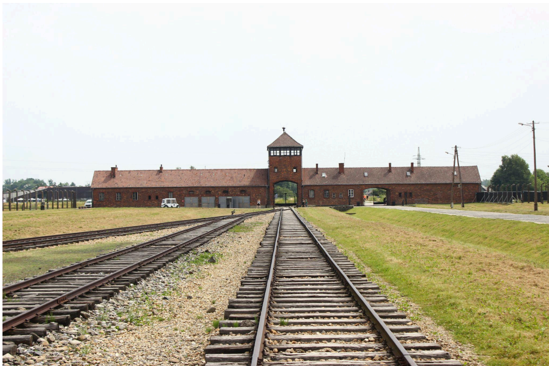
Artmane, L. (2021). “Entrada del Museo Auschwitz-Birkenau desde dentro”. [Imagen]

Fuente: https://unsplash.com/photos/an-old-brick-building-with-a-large-iron-gate-in-front-of-it-XBpik9LO-m8