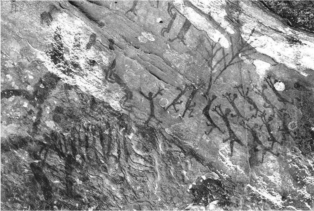
Figura 1. Sítio Toca da Extrema II, Serra Branca, Parque Nacional Serra da Capivara. Cena de Relação entre humanos e o meio ambiente.

As pinturas, se entendidas como cultura, facilitariam a adaptação dos primeiros habitantes ao meio ambiente em todas as partes do mundo. A cultura seria um produto social que, de algum modo, contribuiria para o homem em sua adaptação ao meio em que vive (Franch 1982:61).