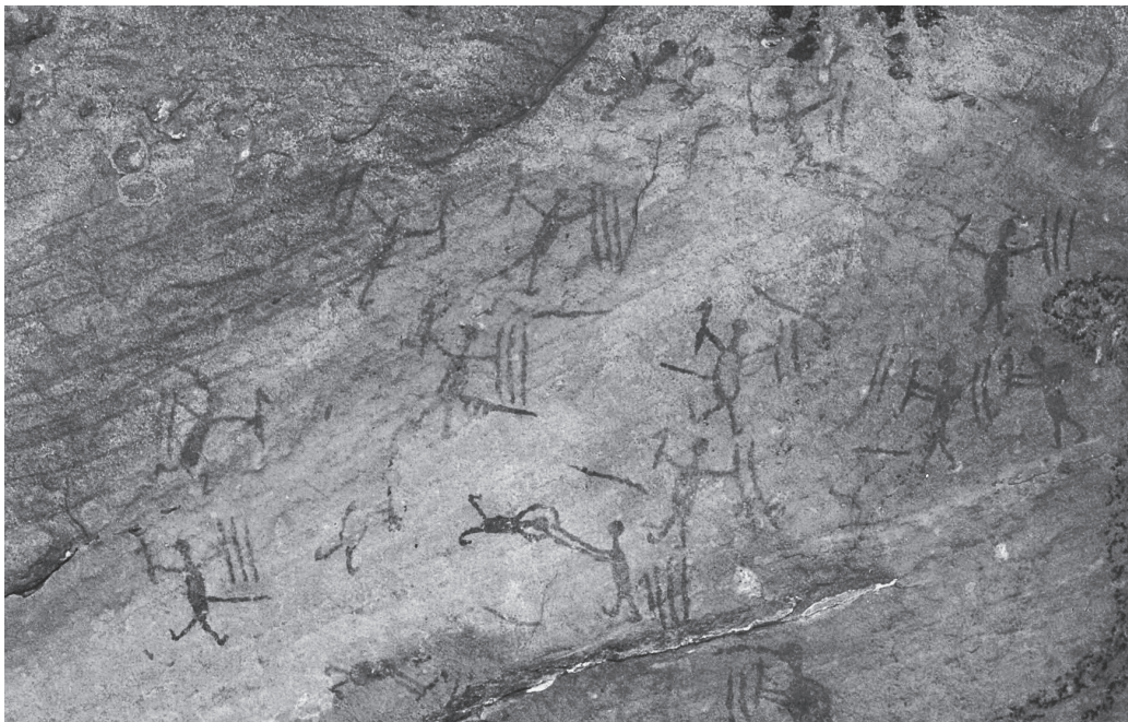
Figura 3. Sítio Toca da Extrema II, Serra Branca, Parque Nacional Serra da Capivara. Luta Social.

Sabe-se que a população das Américas pré-conquista europeia era muito maior do que se supunha. E, como eram muito maiores, estas populações estavam de certo modo em contato umas com as outras e as crenças, as práticas e os costumes