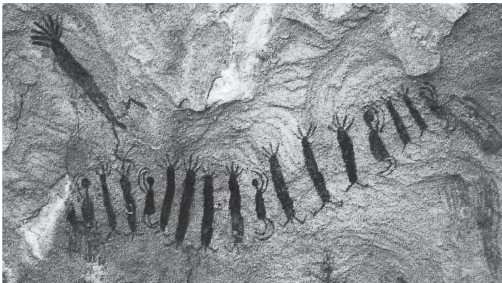
Figura 2. Sítio Boqueirão da Pedra Furada, Serra da Capivara, Parque Nacional Serra da Capivara. Cena de Ritual.

As pinturas seriam como que uma necessidade coletiva da vida em grupo, em nome de sua própria socialização dos saberes e dos conhecimentos, para a divisão dos afazeres e da produção e da compreensão das histórias e lendas do grupo.