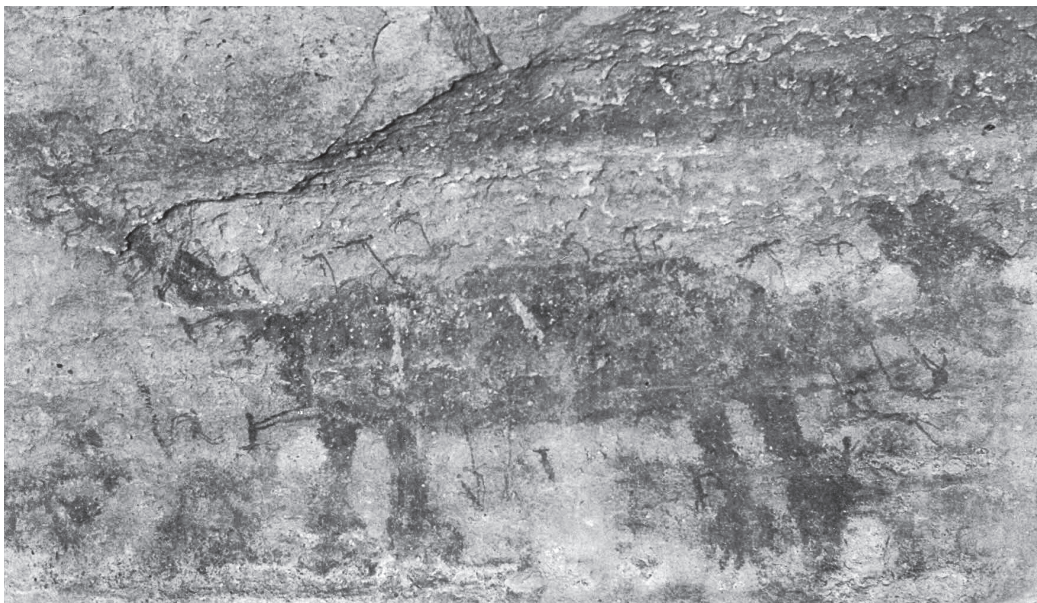
Figura 4. Sítio Toca da cabaceiras, Serra Talhada, Parque Nacional Serra da Capivara. Divisão da caça.

O saber traria caráter público e cooperativo, e apresentar-se-ia como uma série de contribuições individuais, organizadas sob a forma de um discurso sistemático e oferecidas com vistas a um êxito geral, que deve ser patrimônio de todos os homens (Rossi 1989:16). Esse saber nasceria da colaboração entre vivos e mortos e do trabalho comum. Ele não está encerrado apenas nos arquivos e bibliotecas, mas atua e toma corpo em todas as atividades a que se dedicam os humanos e contribuem para a obra dos cientistas e doutos e para as observações dispersas dos artesãos e camponeses. Também contribuem outras categorias sociais como músicos, pessoas do teatro, marinheiros, mercadores, cavaleiros, dançarinos e charlatões (Rossi 1989:111). Todos sem exceção, sempre contribuíram!