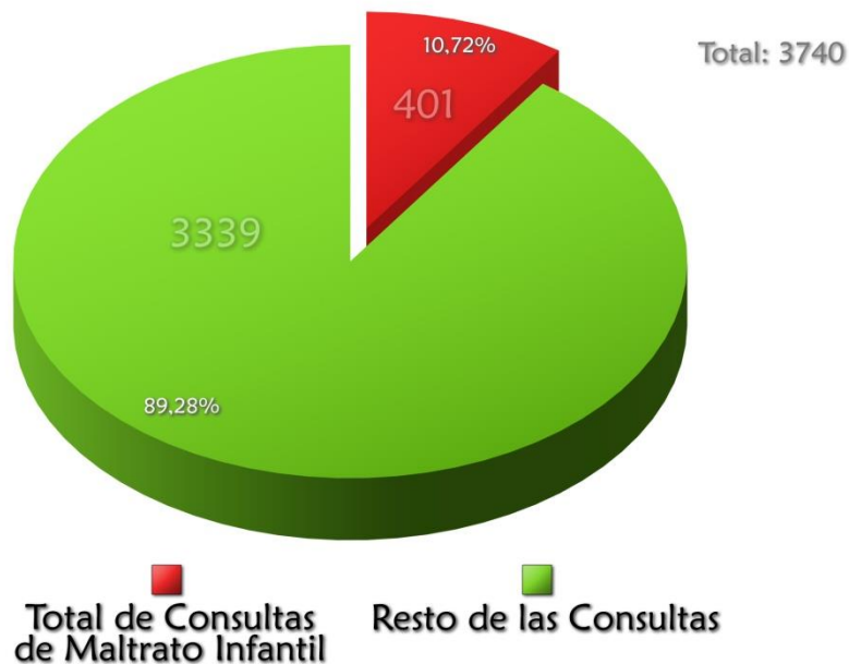
Porcentaje Casos de Violencia Infantil sobre el total de Consultas en Centro de Salud San Martín de VGG. en 2019

Según la división por grupo etario la mayor frecuencia se halló en el grupo 3 (mayores de 6 a 12 años). Grafico 2