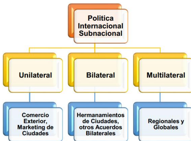
Gráfico N°1: Conceptos, dimensiones e indicadores para el Índice de Participación Internacional

gubernamental y son implementadas por actores subnacionales en el ámbito de las relaciones internacionales, ya sea a nivel regional o global (Calvento y Di Meglio, 2023).