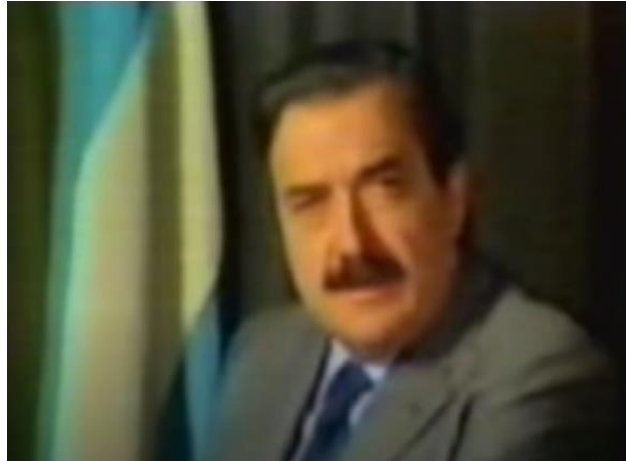
Alfonsín en primer plano durante una de las escenas del spot "Los tres puntos"

Se asemeja a una cadena nacional ya que así están conformadas audiovisualmente en nuestro país. Todas las cadenas nacionales comienzan con la palabra de un/a locutor/a con su voz en off presentando al presidente/a mientras en escena se observa nada más que la bandera argentina flameando. Posteriormente, la escena se basa en la figura del presidente/a sentado/a en su sillón presidencial, con la bandera argentina ubicada de fondo hacia la izquierda. Con esa misma escenografía se observa a Alfonsín, en un primer plano pronunciando y enumerando sus promesas políticas para con los ciudadanos argentinos. Claro está que esta estrategia respecto a la escenografía planteada, pretende lograr la idea de que se va a llegar al objetivo, que no se trata ya de algo utópico sino más bien de lo cerca que se está de la concreción del objetivo que esa escena está reflejando, la de un Alfonsín presidente, gobernando en pleno ejercicio de la democracia argentina, a fin de lograr instalar una imagen de la democracia, un escenario propio de esa vida en democracia.