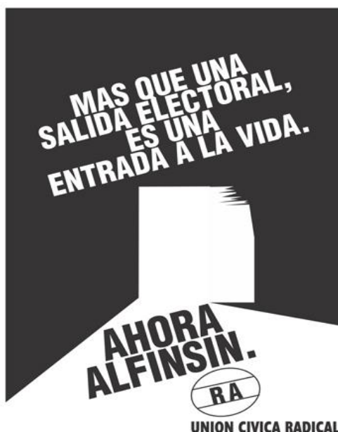
Ilustración presente en varias aperturas y cierres de los spots radicales

Luego de la escena que reproduce la imagen de una puerta abriéndose y la aparición de la frase “más que una salida electoral es una entrada a la vida” con su tipografía usual, en ésta toma se realiza un zoom inn hacia el interior de la puerta que se abre, dando lugar a una nueva escena que reproduce un video sobre un acto político en el que se observa a Alfonsín hablándole a una multitud de personas que lo aclaman mientras pronuncia el preámbulo de la Constitución, otra de sus “marcas” registradas logradas durante la campaña.