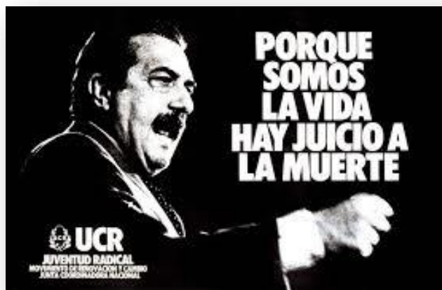
Afiche perteneciente a la campaña gráfica y firmado por la Juventud Radical