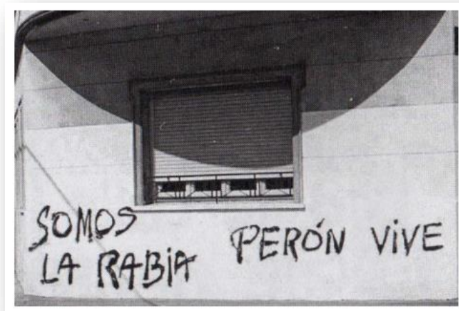
Pared intervenida con un mensaje pintado por parte de la Juventud Peronista

Un claro ejemplo es el mensaje tipo grafiti escrito en las paredes “somos la rabia” a lo que el radicalismo contestaba y por ende se diferenciaba en su respuesta plasmando “somos la vida”.