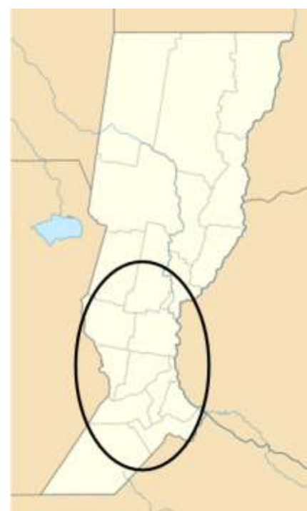
Figura 1: Ubicación de la zona en estudio dentro de la provincia de Santa Fe.

Los datos que se presentan a continuación son solo a una parte del relevamiento realizado y corresponden a las siguientes variables: régimen de tenencia de la tierra, residencia del productor, mano de obra, asesoramiento profesional, limitantes de