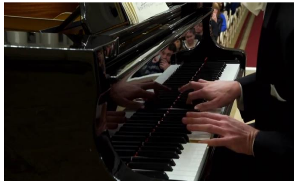
Figura 15: tensión muscular y aproximación del torso al teclado en clímax de A (compás 3).

Al llegar al tercer compás, clímax de A, se produce otro aumento dinámico congruente con la secuencia ascendente del gesto. El acorde es tocado con mayor tensión muscular en sus manos y se percibe asimismo una ampliación del tempo . El torso del pianista se aproxima al teclado de manera más pronunciada que en el compás anterior (Fig. 15). A partir de la acentuación agógica del acorde ubicado en el segundo tiempo de negra, Lugansky rompe la tendencia inercial ya que desde este punto el impulso del gesto se ralentiza y su intensidad disminuye.