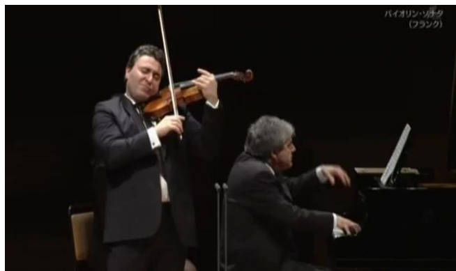
Figura 23: amplitud gestual en el clímax (segundo tiempo de compás 51).

eleva su mano izquierda luego de atacar el acorde del segundo tiempo, gesto expresivo que, como ya mencioné, enfatiza la llegada al punto climático de la línea melódica (Fig. 23).