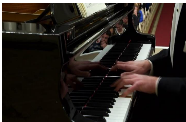
Fig. 13: el torso se aproxima al teclado al tocar el acorde (compás 2).

El segundo gesto menor (compás 2) es tocado con mayor impulso: se percibe una aceleración del tempo y un aumento de la intensidad. Luego de la corchea inicial claramente articulada, se observa cómo al tocar el acorde con la mano derecha muy armada, su torso se aproxima al teclado colocando el peso del gesto en la segunda negra del compás (Fig. 13).