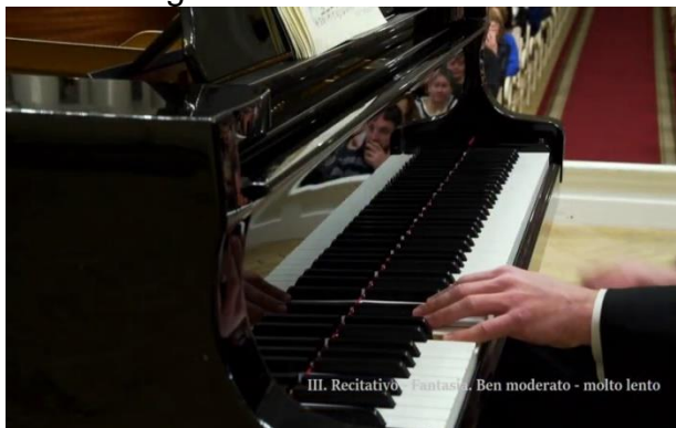
Figura 12: movimiento energético de salida con mano derecha (compás 1).

relaja la tensión del gesto como sucede en las otras versiones.