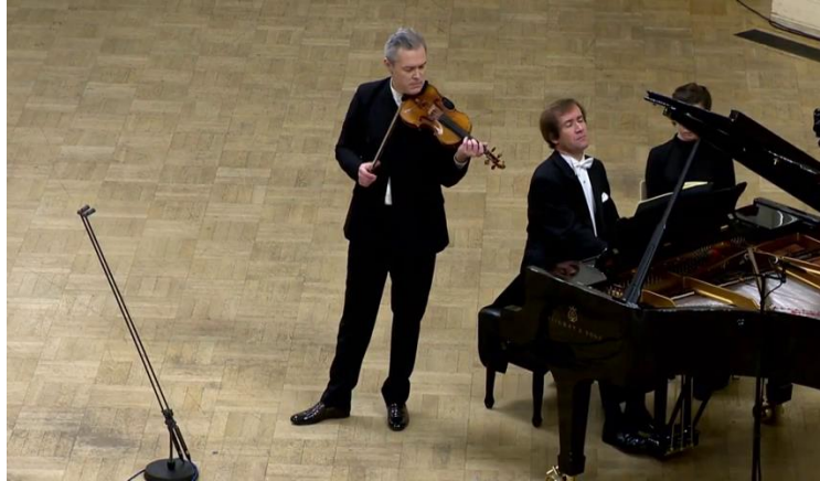
Figura 16: final de A (compás 4)

Tomando en consideración que Larson define a la inercia como la tendencia de un patrón determinado a seguir de la misma manera, se observa aquí una manifestación diferente de esta fuerza respecto a la performance anterior y cercana a la versión de Barbizet. En cuanto a la dinámica, ya mencioné que partiendo de un ámbito mf encontramos un progresivo crescendo coincidente con los tres gestos menores que llega a su punto climático en el acorde de compás 3. También en el plano temporal ocurre una progresiva aceleración del tempo , en contraste con lo realizado por Papian. A lo largo de los primeros tres compases Lugansky va evidenciando la tendencia inercial a través de los recursos musicales mencionados y es interesante observar cómo su gestualidad corporal manifiesta asimismo la fuerza que actúa en esta organización secuencial. En sus movimientos se percibe un esfuerzo físico cada vez más pronunciado: la aproximación del torso con respecto al teclado y la tensión en la musculatura de sus manos se van intensificando con la llegada de cada acorde. El movimiento enérgico de salida con el que abandona cada gesto menor constituye, además de un modo de articulación visual, un elemento que sostiene la tensión y proporciona más impulso a la secuencia. Finalmente, al igual que en las otras versiones, es notable cómo en el momento en que la inercia se detiene –luego del punto climático de compás 3- la gestualidad corporal del pianista se retrae para darle paso al primer solo del violín.