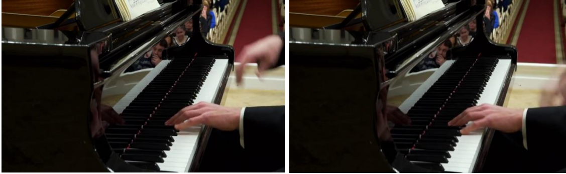
Figura 14: secuencia de salida enérgica mano derecha (compás 2).

Al llegar al tercer compás, clímax de A, se produce otro aumento dinámico congruente con la secuencia ascendente del gesto. El acorde es tocado con mayor tensión muscular en sus manos y se percibe asimismo una ampliación del tempo . El torso del pianista se aproxima al teclado de manera más pronunciada que en el compás anterior (Fig. 15). A partir de la acentuación agógica del acorde ubicado en el segundo tiempo de negra, Lugansky rompe la tendencia inercial ya que desde este punto el impulso del gesto se ralentiza y su intensidad disminuye.