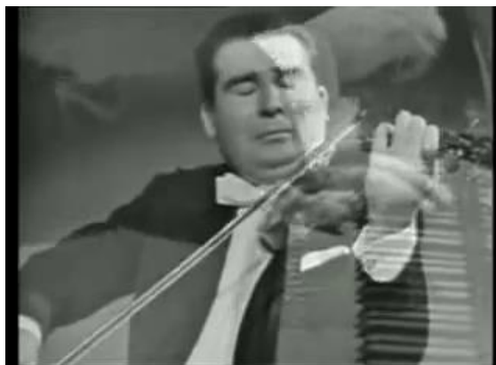
Figura 20: elevación de mano y antebrazo derechos antes de C.