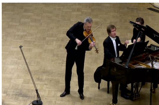
Figura 26: la gestualidad de ambos intérpretes transmite el impulso del clímax (c. 51).

Al llegar a B 5 , el violinista se inclina pronunciadamente hacia su ángulo inferior izquierdo y realiza el arpeggio ascendente tirando para luego llegar al re agudo empujando con mucho vibrato . Si bien estos arcos coinciden con los de Ferras, las versiones se diferencian en que Repin no detiene el impulso del gesto inmediatamente luego de alcanzar este punto climático. En cuanto a Lugansky, en este momento levanta exageradamente su mano izquierda luego de tocar el acorde fortissimo acompañando la energía de la llegada al clímax (Fig. 26), gesto expresivo que, como puede notarse, resulta un recurso común a las tres performances analizadas.