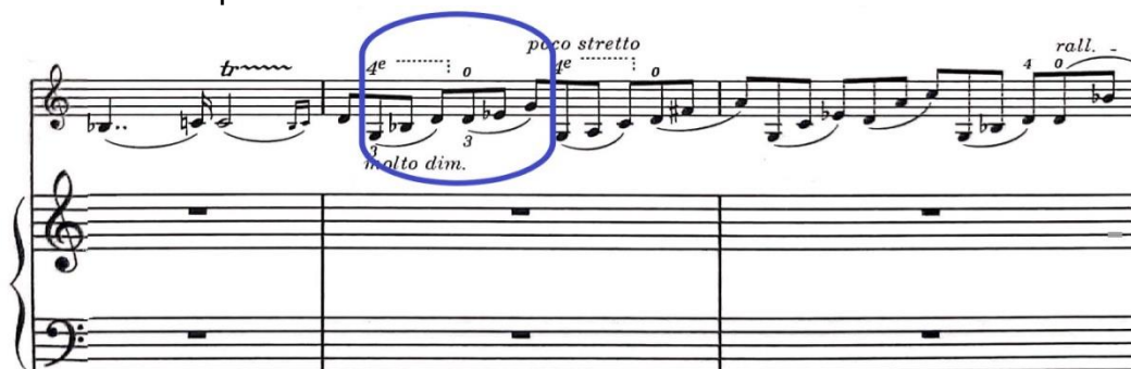
Figura 5: el gesto que realiza el piano es extraído de este solo del violín ubicado en compases 8 y 9 del mismo movimiento.

La línea del violín se mueve por blancas, es decir que resulta estable métricamente. Sin embargo, como anticipé, encontramos un elemento que contradice esta sensación de estabilidad: el diseño melódico de los tresillos en el piano se encuentra desplazado una corchea con relación al compás. Esta disposición desestabiliza la estructura del gesto y supone un desafío para los intérpretes a la hora del ensamble, más aún teniendo en cuenta la indicación legatissimo que Franck coloca en la parte del piano. Asimismo, si observamos el diseño de los tresillos, notaremos que, además de citar una parte del solo del violín -señalada en la Figura 5-, la corchea que termina cada gesto genera un contracanto que coincide con las blancas de la línea melódica.