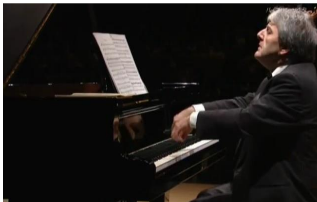
Figura 11: final de A (compás 4)

pronunciada, agregada por los intérpretes, detiene demasiado el discurso produciendo una ruptura en el diálogo camarístico.