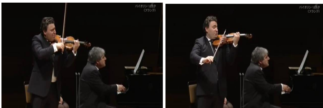
Figura 25: secuencia del cambio postural (blancas iniciales de compases 53 y 54).

25). La trayectoria del torso de Vengerov coincide exactamente con la curva melódica del gesto, ya que alcanza su postura más erguida en el re del compás 54, punto climático de C. En cuanto a su cabeza y expresión facial, luego de tocar la blanca que inicia el gesto –acción descrita anteriormente-, el violinista permanece con una leve inclinación del rostro hacia el ángulo inferior y su ceño fruncido. En contraste, al llegar al re, erguido en su punto máximo, realiza una elevación del violín tocando dicha nota más suavemente. Su expresión facial se modifica: nuevamente, como en el inicio de C, la elevación de sus cejas coincide con un salto interválico ascendente, en este caso de tercera menor. Posteriormente, en el momento de la resolución del gesto –al tocar el do de la siguiente blanca más suavemente- su rostro y torso vuelven a inclinarse hacia el ángulo inferior.