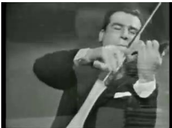
Figura 18: clímax de la sección (c.51)

Este movimiento enérgico, sumado al efecto del pedal derecho, produce una resonancia importante que enfatiza la llegada del violín al re #, punto climático de la sección. Además, la amplitud de dicho gesto coincide con la del movimiento de arco de Ferras; ambos gestos se perciben como consecuencia del impulso inercial implícito en el pasaje. Inmediatamente después, vemos su torso acercarse al teclado (Fig. 19) a la vez que sus manos detienen esta fuerza y se mantienen más cerca para hacer el molto ritenuto y disminuir dinámicamente.