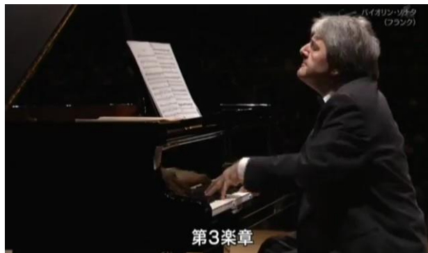
Figura 9: elevación de mano izquierda que destaca el diminuendo de la voz inferior.

izquierdo en los finales de primer y segundo gestos, destacando el movimiento de la voz inferior a través de la elevación de su codo y muñeca. (Fig. 9). Si bien el gesto corporal es similar para ambos finales, Papian destaca el si bemol que produce la fricción en compás 2 por medio de un aumento dinámico que sostiene la tensión armónica.