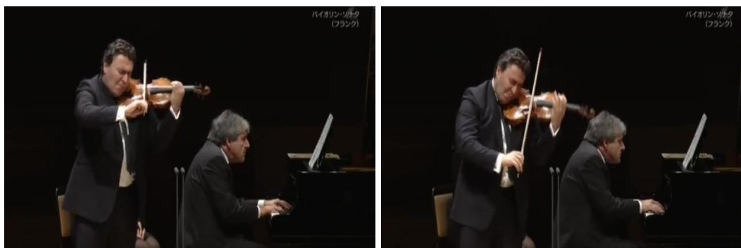
Figura 22: secuencia del cambio postural en disonancia (primera y segunda negras de compás 52).

La actitud de Papian, a diferencia de la de su compañero, no parece tan turbada. El balanceo de su torso es casi imperceptible y permanece con las manos cerca del teclado; al igual que con su sonido, el pianista se ubica visualmente en segundo plano. No obstante, como Barbizet, en compás 51