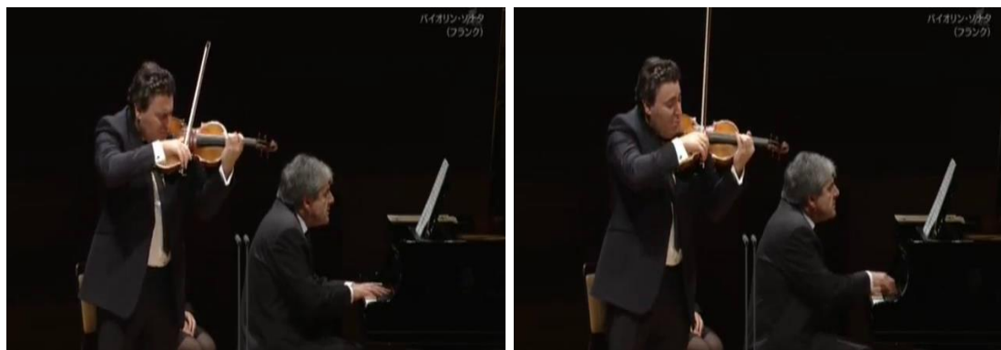
Figura 24: secuencia de cambio postural entre final de B 5 y comienzo de C.

Al llegar a la segunda sección –que inicia con C- el tempo es, en mi opinión, el más cercano a la indicación del compositor - Ben Moderato - y además el más lento de las tres versiones analizadas. Esta decisión interpretativa potencia los elementos estructurales que, como vimos en el análisis textual, contribuyen a generar un estado de calma aparente. En este momento, Vengerov modifica notablemente su actitud corporal. En la secuencia de imágenes (Fig. 24) podemos notar cómo alza su rostro, antes crispado e inclinado hacia el ángulo inferior, y realiza además una elevación de sus cejas. Estos gestos expresivos transmiten el esfuerzo implicado en el salto melódico de quinta justa y comunican el cambio de carácter que ocurre entre las secciones.