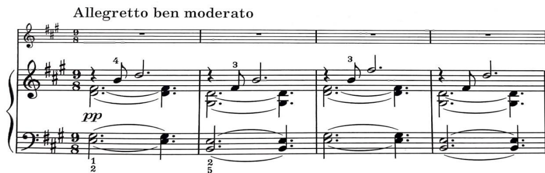
Figura 2: comienzo de la Sonata (compases 1 a 4 del Primer Movimiento)

La textura a cinco voces remite al estilo litúrgico, característico de Franck, emulando la escritura organística. Este gesto se relaciona con el motivo inicial de la Sonata 87 (Fig. 2) por varios aspectos.