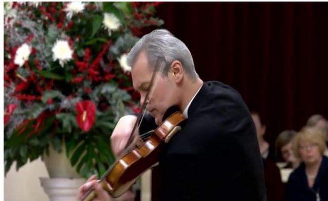
Figura 27: Repin detiene la inercia manteniendo la intensidad del gesto, tanto sonora como visual (compás 52).

sólo los valores largos. A través de su actitud corporal, torso y cabeza inclinados hacia el ángulo inferior, se percibe el énfasis puesto en el gesto. La decisión interpretativa de detener el impulso inercial en ese punto y no inmediatamente después del clímax difiere de las demás y es, en mi opinión, la más cercana a la estructura textual ya que señala exactamente el momento en el que B 5 se convierte en un gesto retórico.