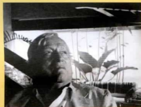
Arquitecto Fruto Vivas

Entre sus obras más memorables se encuentran el pabellón de Venezuela en la Exposición Universal de Hannover 2000, el Club Táchira, la Iglesia de la Concordia y recientemente "La Flor de los Cuatro Elementos", el mausoleo del ex presidente venezolano Hugo Chávez Frías. En ediciones anteriores se ha galardonado a otros profesionales como Juan Navarro