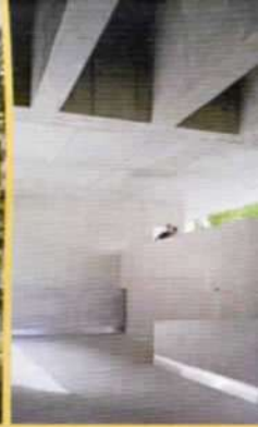
El "B" Auditorio en Cartagena: Selgas Cano Arquitectos (España)