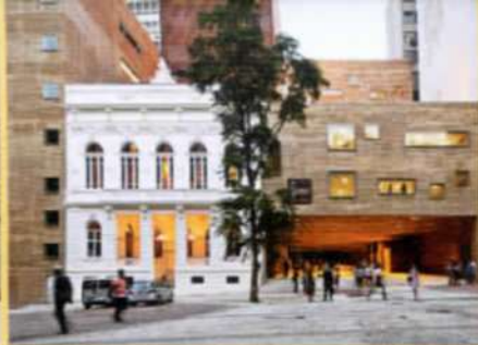
Escola de Leça do Baího: aNC arquitectos. Teresa Maria Dias Novais Gonçalves (Portugal)