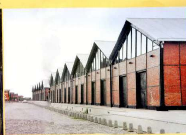
ROSARIO: OBRA DE LA MUNICIPALIDAD DE ROSARIO