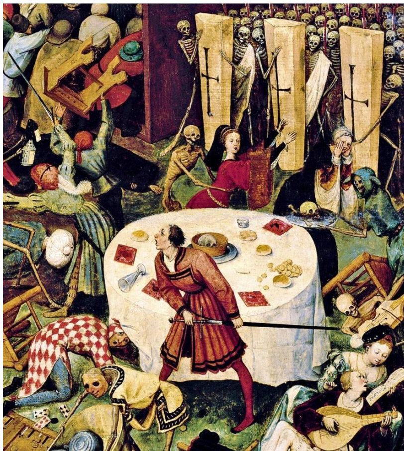
Detalle del óleo "El triunfo de la muerte" (1562), del pintor flamenco Pieter Brueghel el Viejo (Bélgica, 1525 - Bélgica, 1569)

Antes debemos ubicarnos en el contexto de la época: pequeñas comarcas, esparcidas todas a lo largo y ancho del territorio europeo, organizadas alrededor de un castillo, de una abadía Cristiana, de un convento. La cotidianidad se caracterizaba por el miedo, la estrechez de horizontes, la pobreza, la inmensa fragilidad ante una peste, un animal salvaje, el clima, que derrumbaba las casas, arruinaba las cosechas, enfermaba y acababa con la vida.