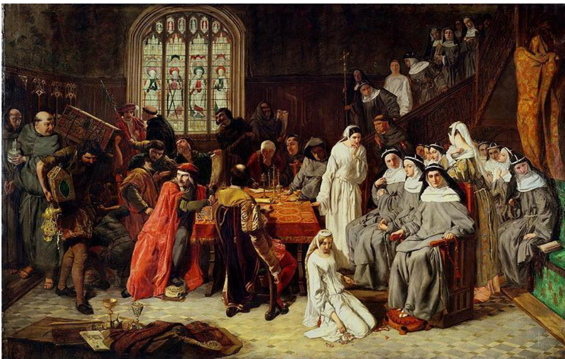
Óleo "Visita y entrega del convento de Syon a los comisionados de 1539", del Artista inglés Paul Falconer Poole (1806-1879)