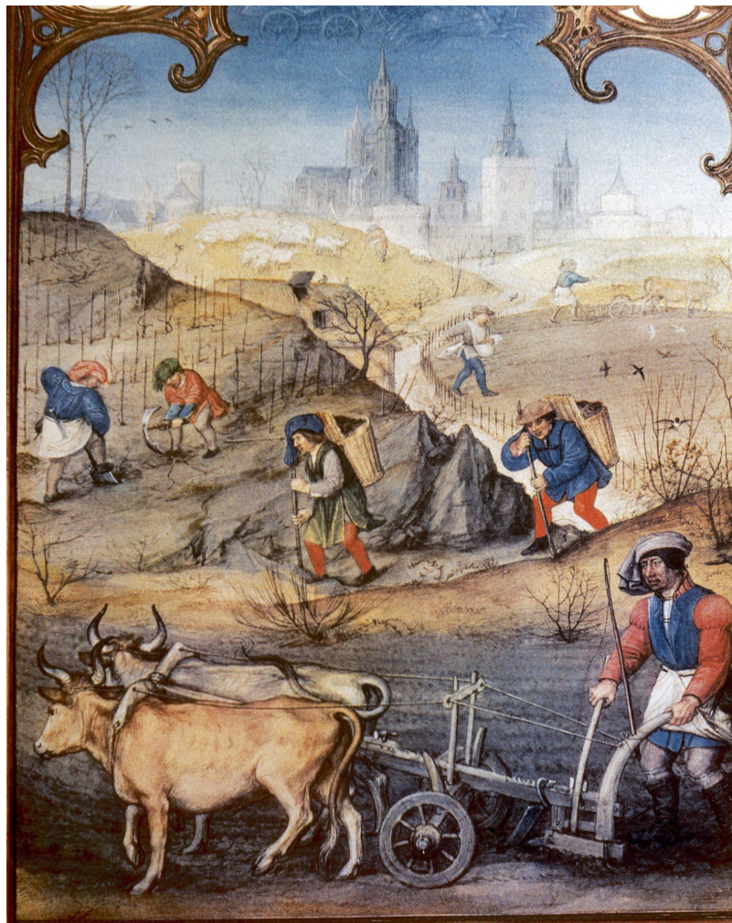
Los agricultores a arar y sembrar. Miniatura de 'Breviario Grimani'. A finales del siglo XV. La Biblioteca de San Marcos. Venecia. Italia