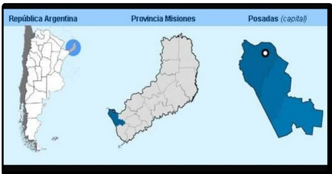
Mapa 1: Posadas en el contexto Nacional y Provincial

Pensar la complejidad que presenta una obra pública como ésta, deja a la vista la existencia de varios ejes que la atraviesan. Por una parte, la incidencia de las alteraciones del territorio, que por más pequeñas que sean (y no es este el caso) influyen la vida de las personas que se encuentran en ese espacio; por otra parte, las tensiones políticas y de poder que se ponen de