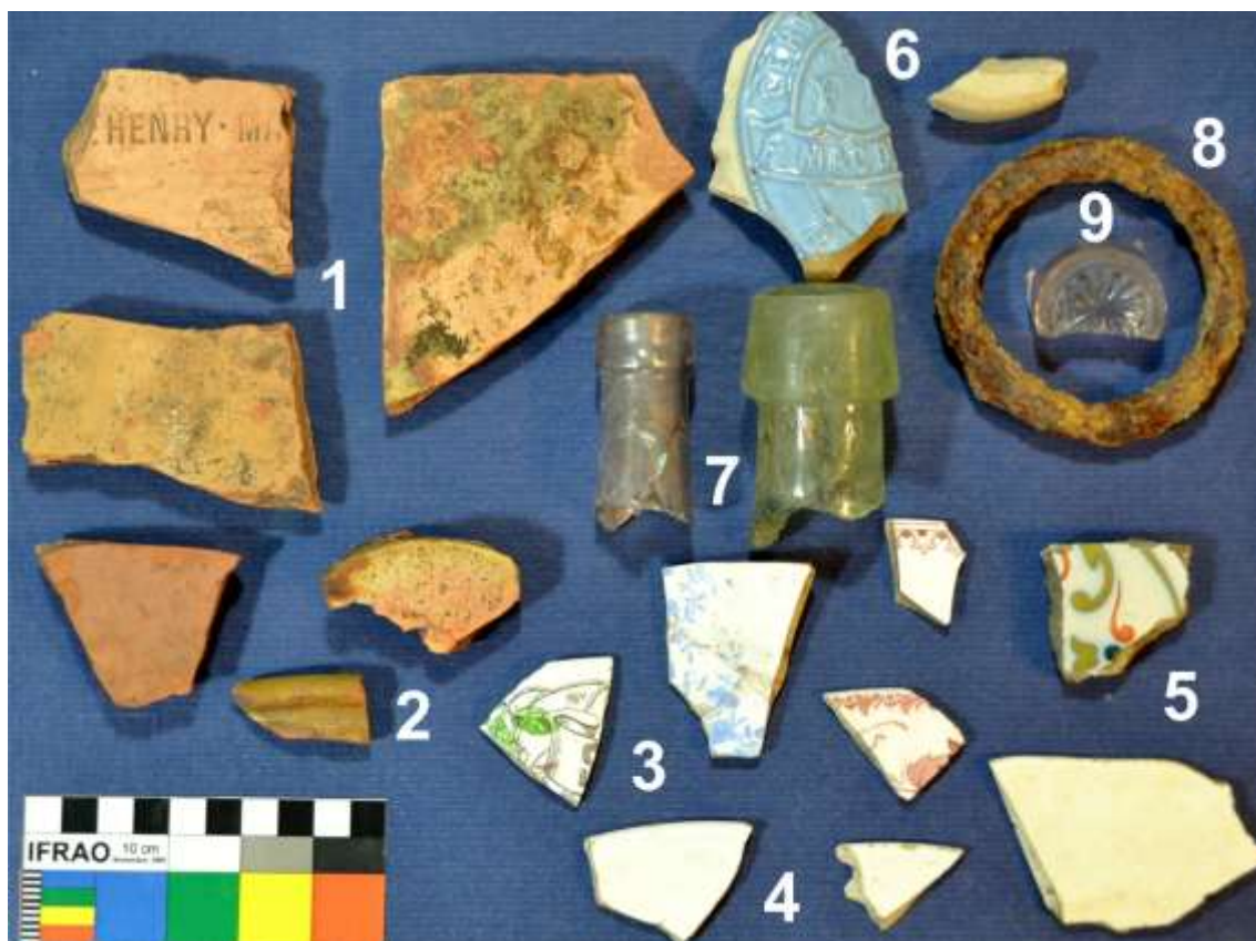
Figura 3. Parte del registro hallado. 1- Cerámica roja de pisos, “St. Henry Marseille” y de fabricación local c. 1890; 2- Ollas y botijos; 3- Cerámica importada transferware y handpainted c. 1890; 4- Loza tipo Wheat. C.1900 5- Fragmento de revestimiento (mayólica, c. 1900); 6- Botellas de cerveza” Magdelin” c. 1878; 7- Picos de botella de vino “tapered collar” c. 1890; 8- Argolla de lazo; 9- Vaso para licor de cristal de Bohemia (violeta)

El material recolectado en los tres sub sitios fue sobre todo cerámico, en gran parte cerámica domestica europea, vidrio de vasos y botellas, material ferroviario y de construcción, trozos calcinados de cal, ladrillos refractarios de medidas anómalas respecto a los de la época de la crónica (estandarizados en 27x12x5) y hulla. La recolección superficial no fue exhaustiva, pero evidenció material antiguo muy mezclado con otros más modernos e incluso actuales (Figura 3).