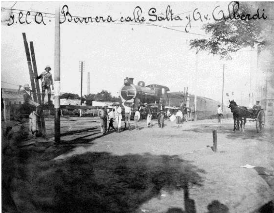
Figura 5- Fotografía del Diario La Capital del Cruce Alberdi. Puede verse la chimenea de las Caleras Rosarinas y un niño probablemente afrodescendiente. Obsérvense las viviendas detrás de la locomotora.

Si bien no se ha profundizado sobre este emprendimiento, arqueológicamente pudieron hallarse abundantes trozos de cal quemada, obviamente ya hidratada por la intemperie. Restos de hulla también se encontraron dispersos, aunque pudieron provenir de un uso ferroviario. Resultaron importantes en el registro frecuentes ladrillos especiales, de tipo briqueta, de leve curvatura y que en dos caras presentan tres orificios apenas marcados en la pasta. Probablemente estos mampuestos provengan de la chimenea principal, hoy demolida. Otros ladrillos refractarios y de grandes dimensiones completan el panorama arqueológico que podría corresponderse a esta empresa.