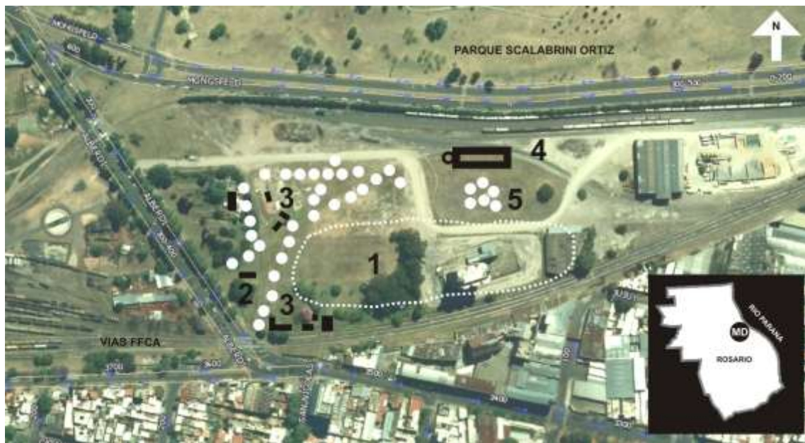
Figura 1- Panorama general del sitio. 1- Ubicación probable del Baño de Mandinga. 2- Bar El Cometa. 3- Viviendas. 4- Caleras Rosarinas. 5- Parquización (La Montañita). Los círculos claros se corresponden esquemáticamente a los hallazgos de la recolección superficial.

El lugar del Baño de Mandinga (Figura 1) está edáficamente alterado y muy antropizado, mediante tramos de vías nuevas, extensas estabilizaciones del suelo con agregados de material ferroso, carbón y piedra granítica. Pero sobre todo hay una presencia de restos calcáreos. La documentación histórica (escasos documentos, pero se logró determinarlo por estar en planos) precisó que en el sitio existió una fábrica de cal, las Caleras Rosarinas S.A.