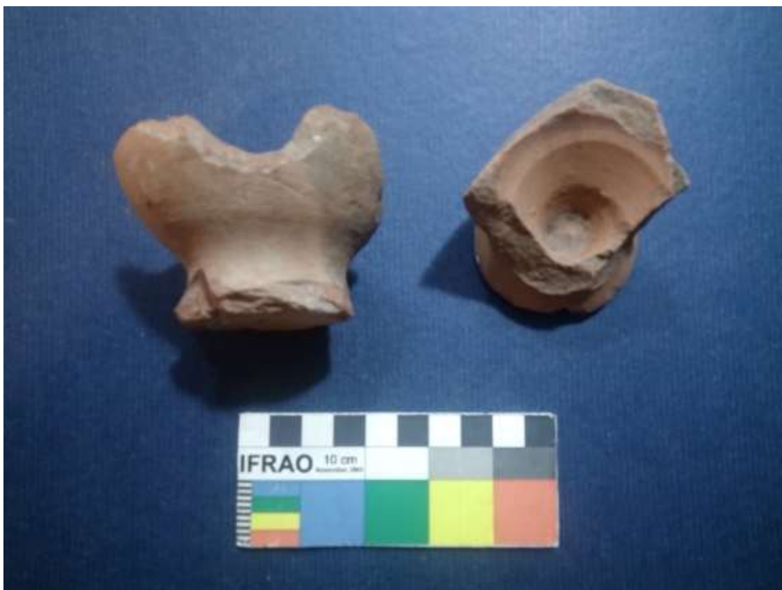
Figura 4- Copas o vasos de cerámica roja sin esmaltar.

La cerámica criolla, si bien cuantitativamente poco relevante, contrasta con la europea en tanto tiene una presencia de la que carecen otros sitios relevados por los autores. Solamente en el sitio La Basurita (1870-1900) pudieron hallarse cantidades significativas de cerámica de este tipo.